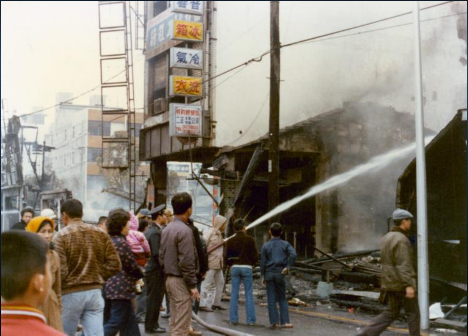
花蓮市中正路、自由街、博愛街2日清晨發生大火，造成六十餘戶商家燒毀。 1977.02.02