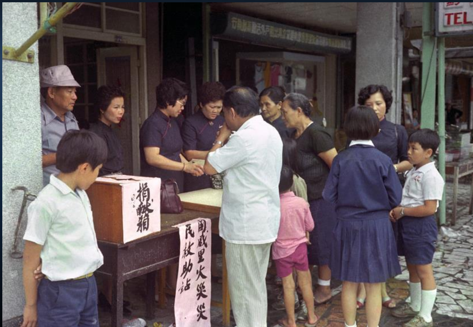
花蓮市國盛里火災發放。