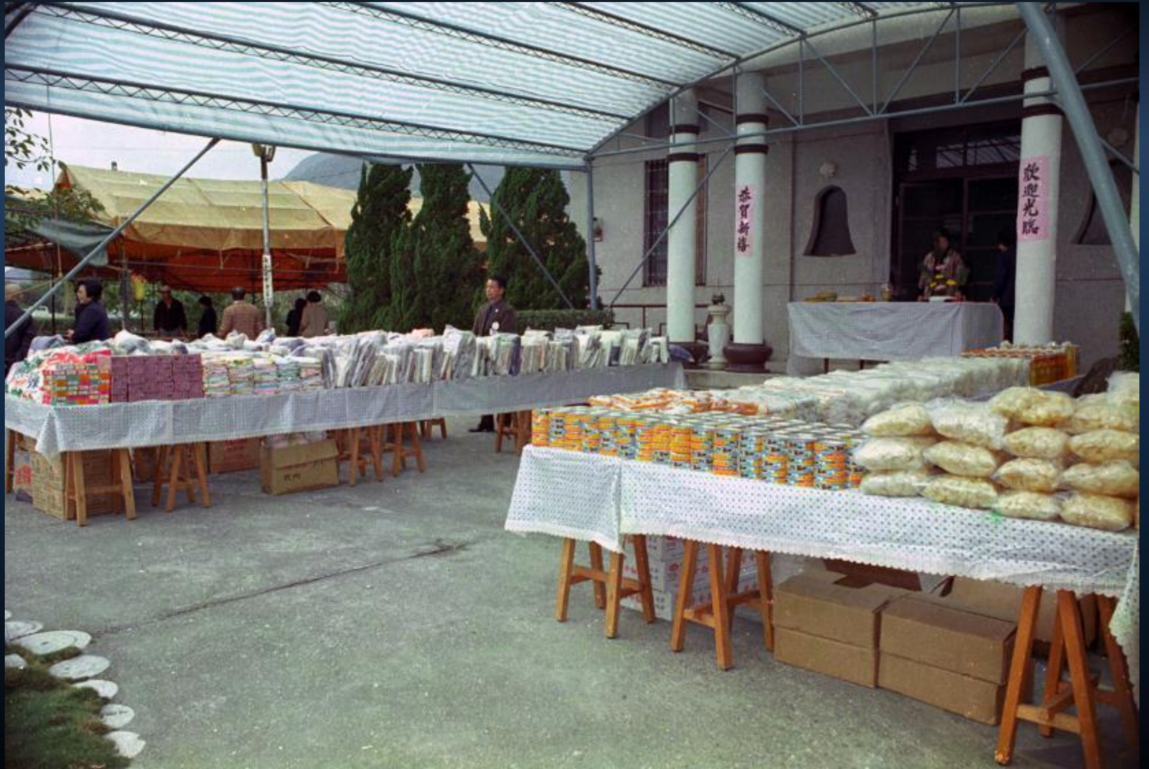
精舍大殿前面擺放整齊的冬令發放物資。