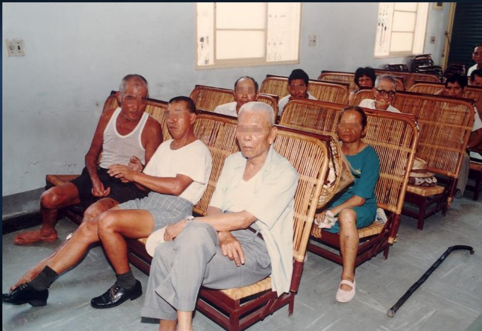
在義診所內等候看診的患者。 1983