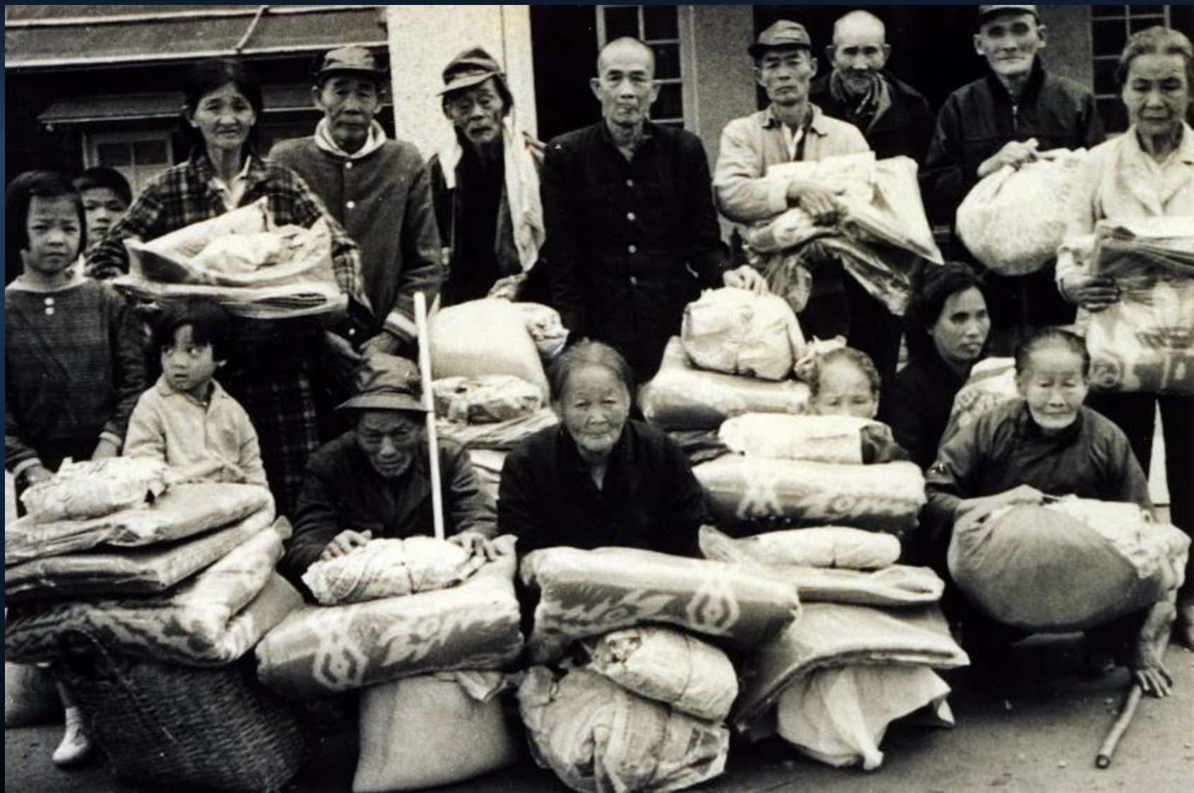
1969年2月9日，濟功德會在普明寺第一次辦理冬令救濟發放。