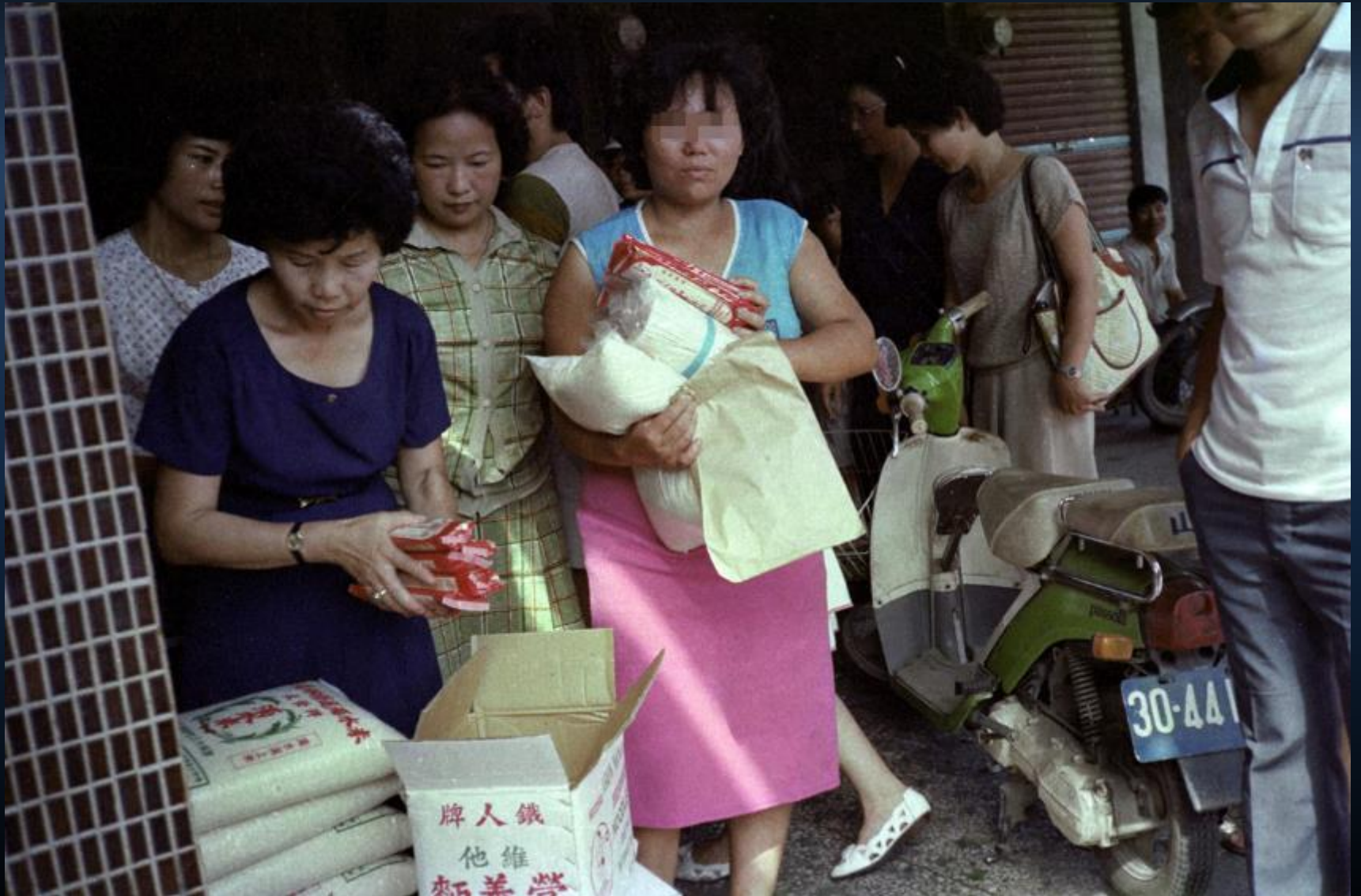
台北三重仁政街火災發放。