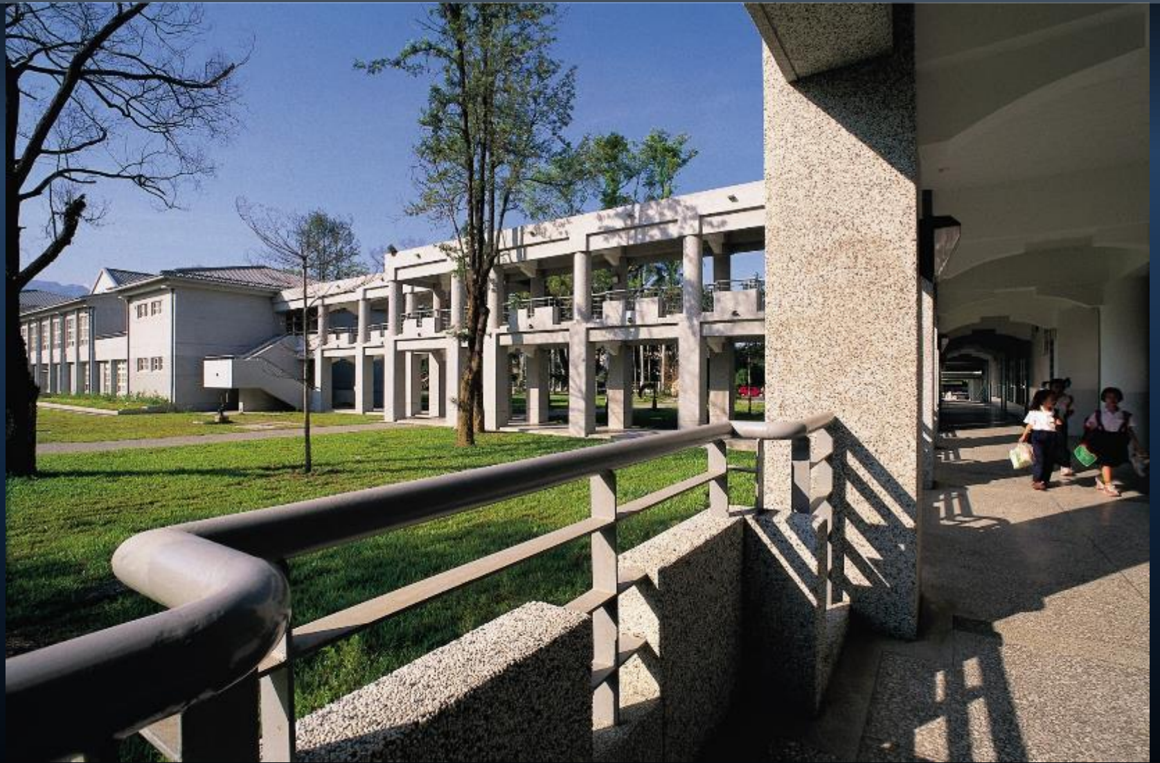
921希望工程—竹山國小。 2002.06.28