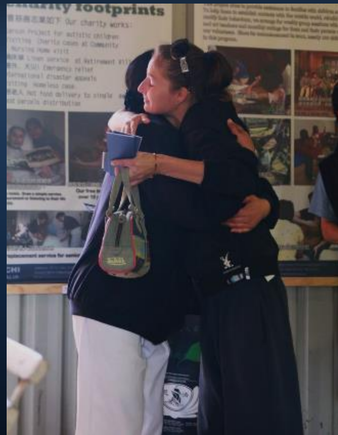
志工和居民溫馨擁抱。 2012.03.24