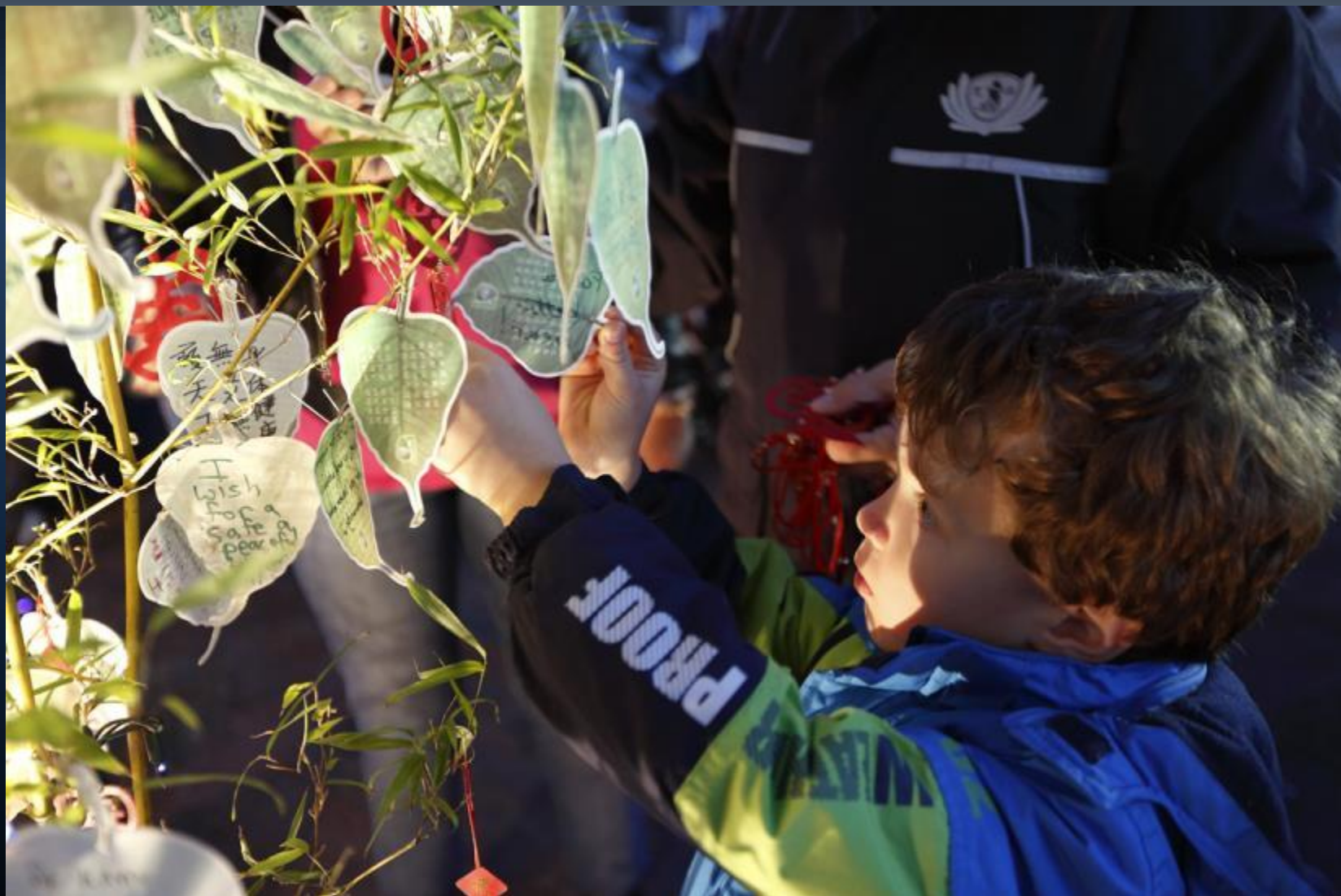
美國紐約史坦頓島社區桑迪颶風周年紀念祈福會，慈濟志工邀請民眾將心願寫在菩提葉祈福卡上。 2013.10.29