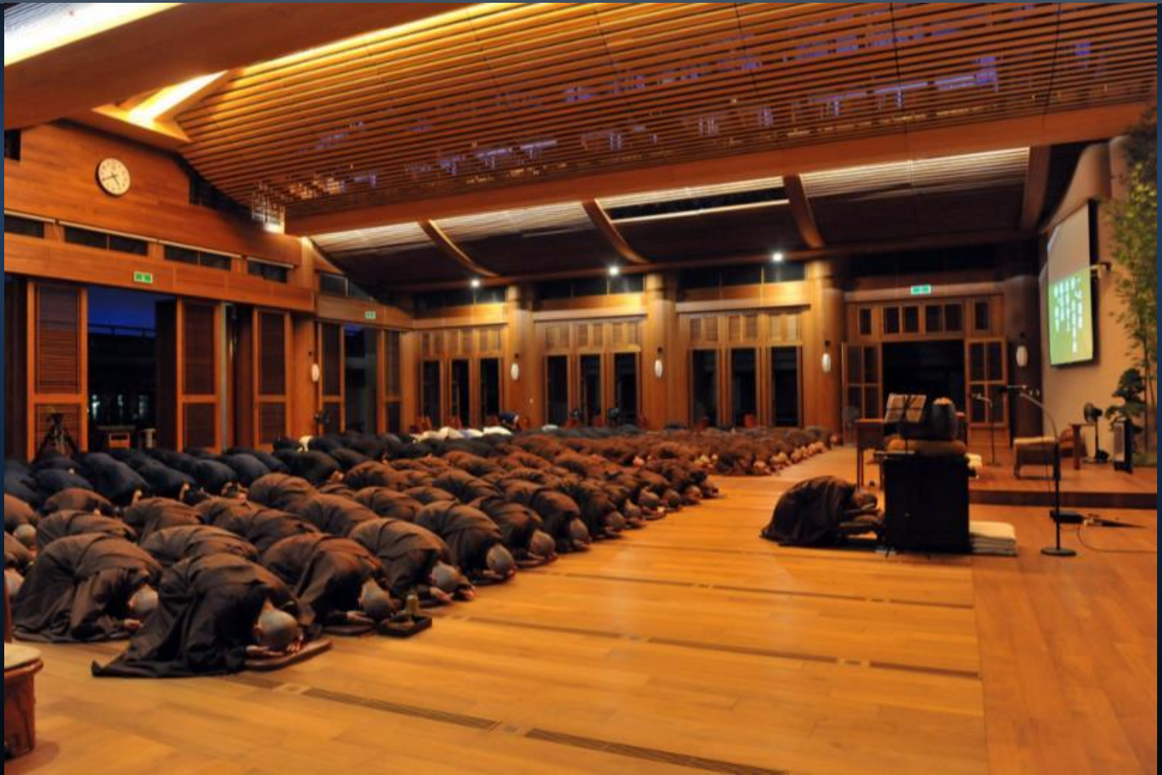
花蓮靜思精舍早課。 2012.05.28