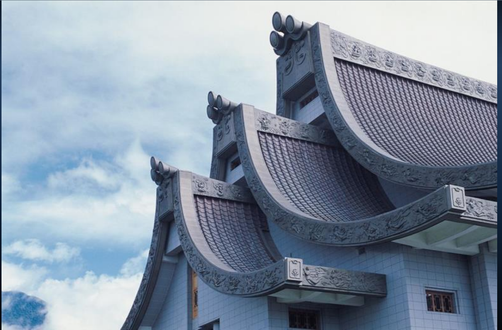
花蓮靜思堂三寶明珠屋頂。