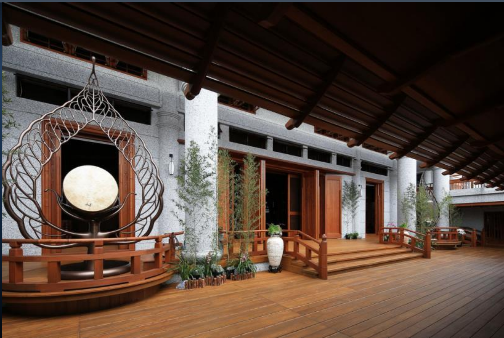
花蓮靜思精舍主堂中庭、大鼓。 2013.02.08