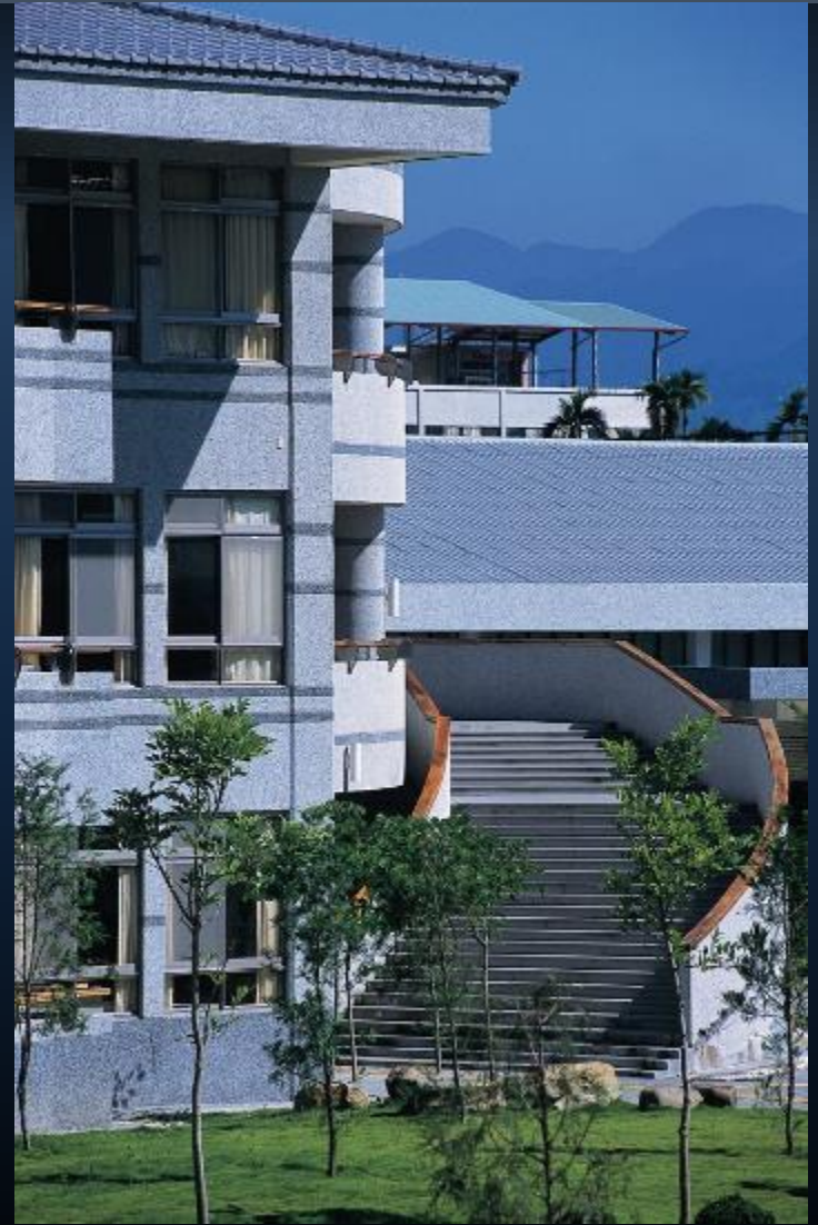
921希望工程—埔里國小。