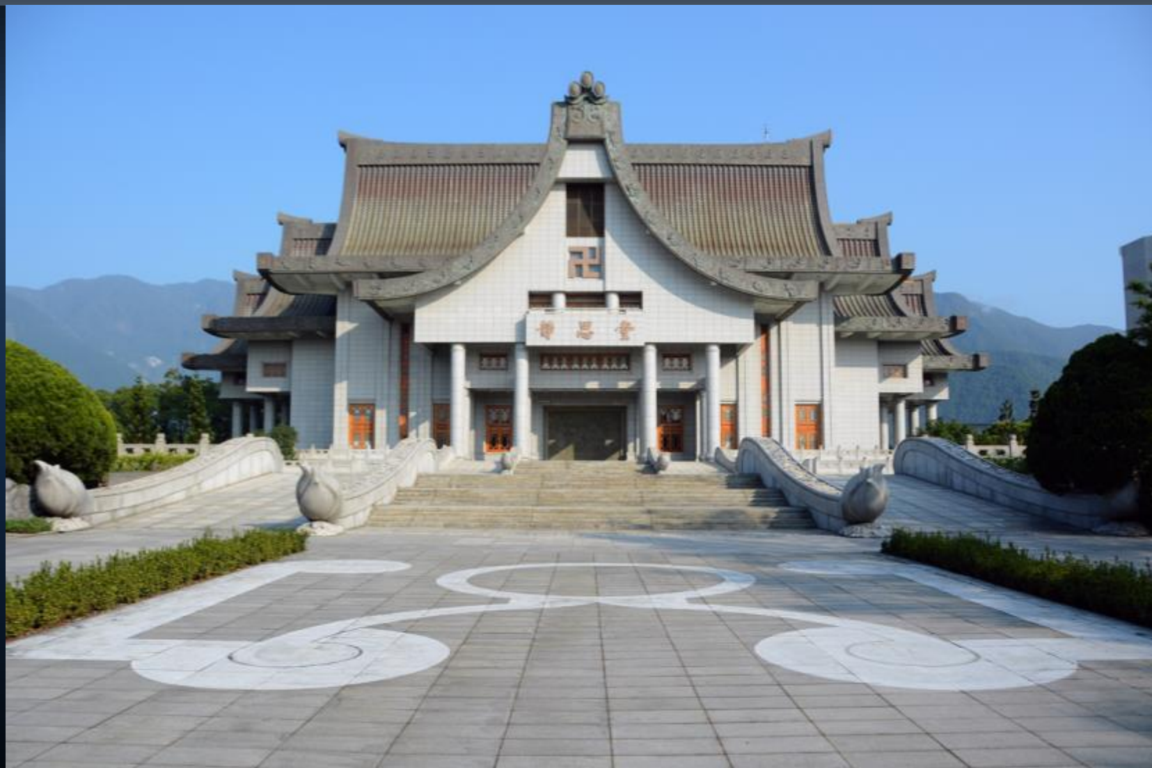
花蓮靜思堂外觀。 2014.04.18