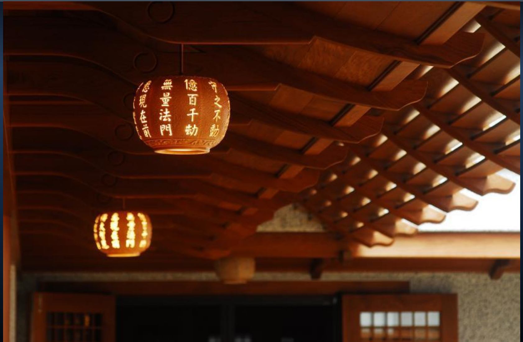
花蓮靜思精舍主堂中庭的陶燈。 2012.07.07