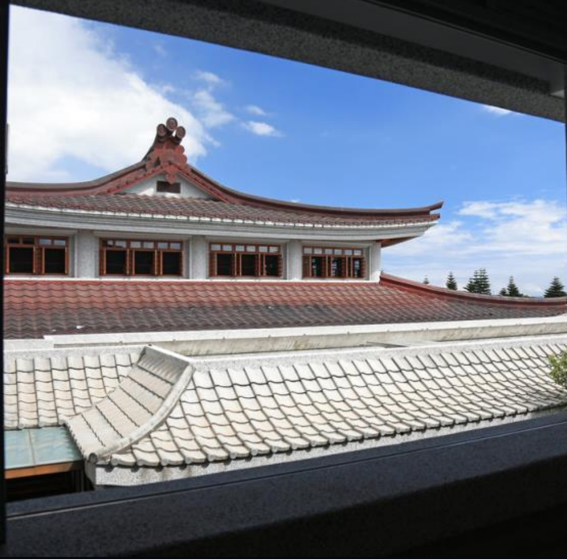
花蓮靜思精舍主堂屋簷。 2013.02.07