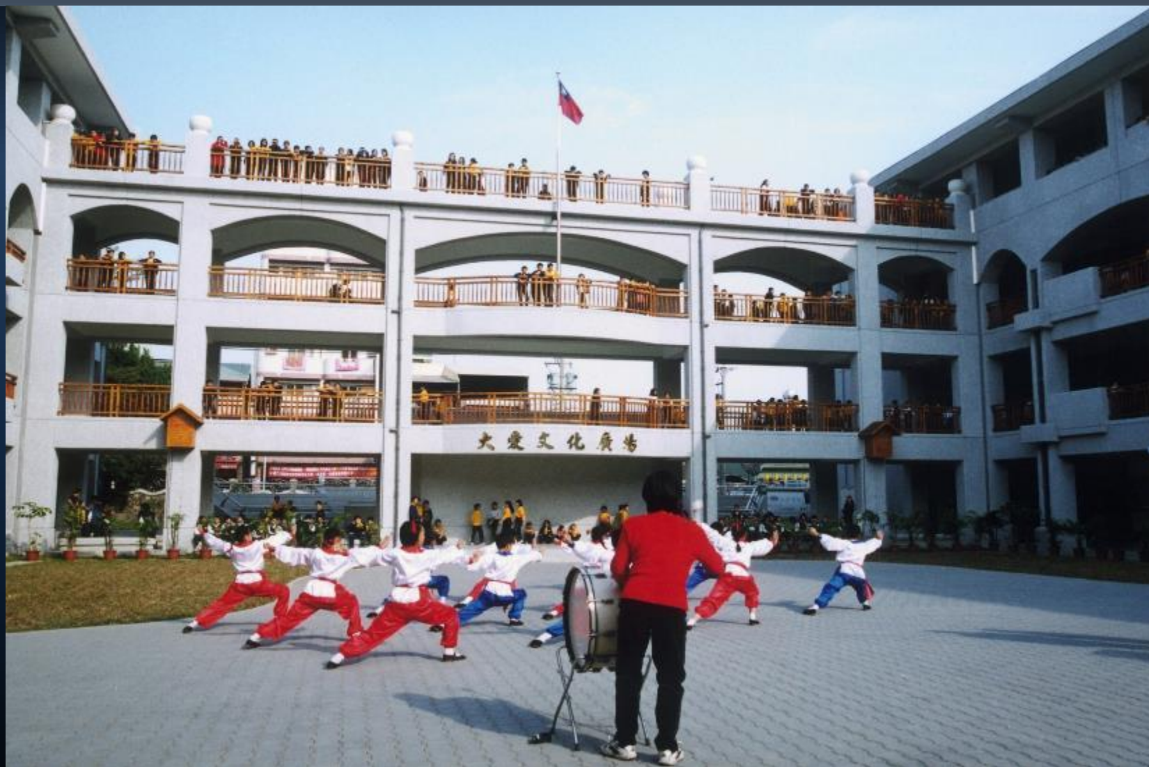
921希望工程—太平國小。 2001.12.27