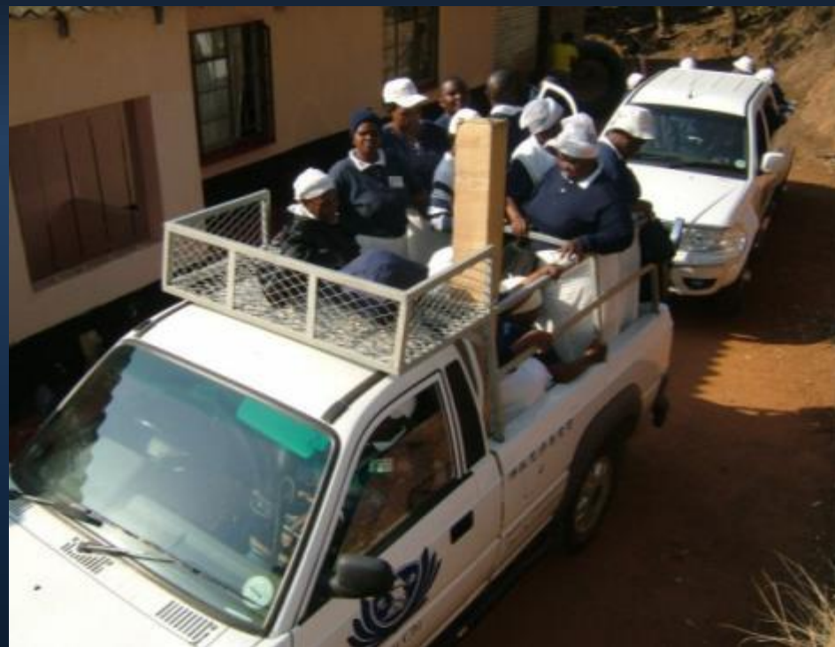
南非德本訪視發放 2008.08.14