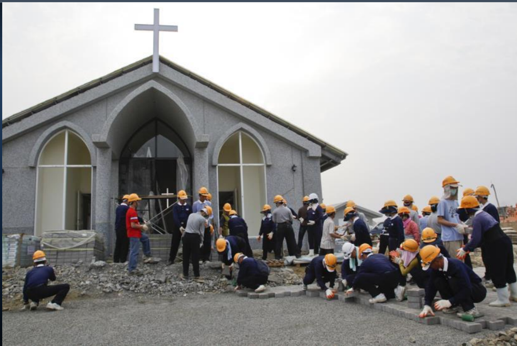
高雄杉林慈濟大愛園區援建工程，慈濟志工在園區內的教堂鋪設連鎖磚。 2010.02.08