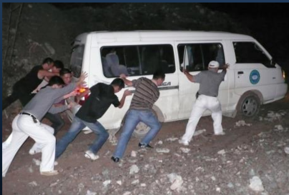
慈濟志工前往訪視的途中車子深陷泥 濘，志工合力推車。 2008.10.18