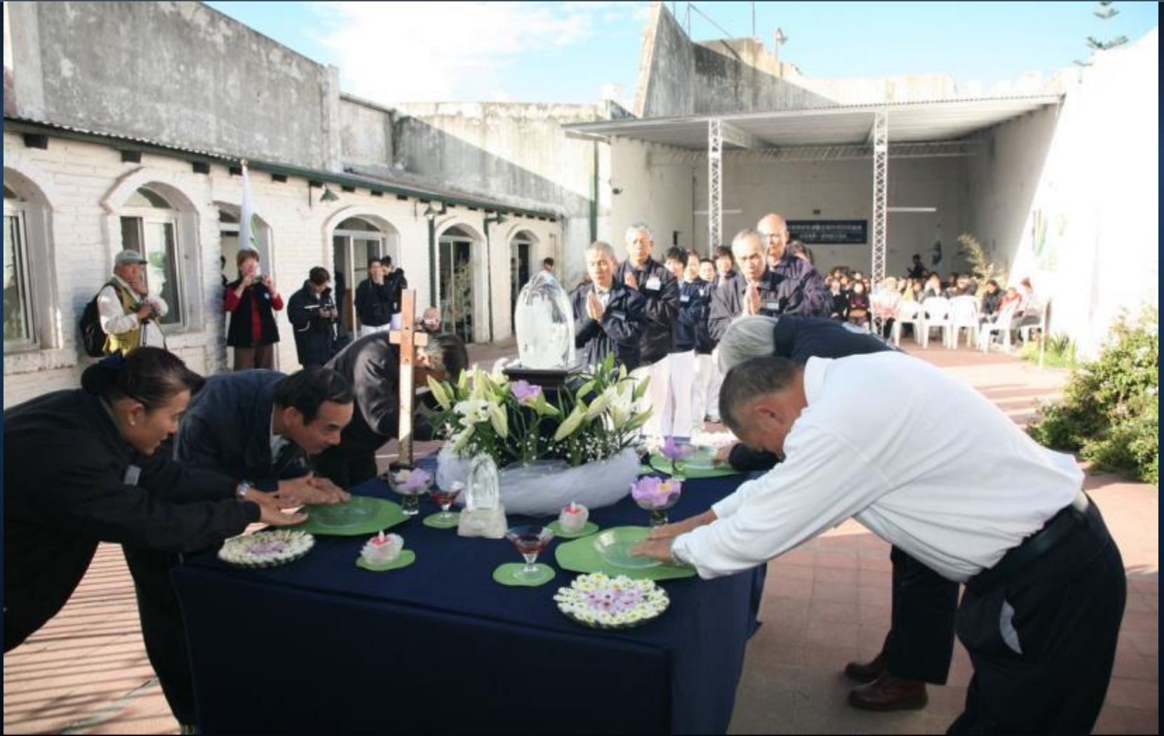
阿根廷安德列理歐斯省瓜雷瓦市佛誕日浴佛典禮，浴佛台上擺設佛陀 灑淨地球像和天主教十字架，共同見證這場莊嚴的盛典。 2012.05.14