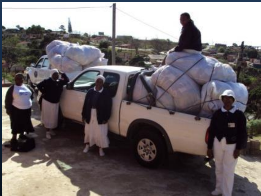
南非德本訪視發放 2009.08.14