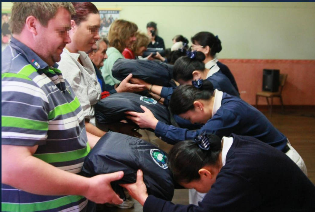
澳洲新南威爾斯省接連大雨，造成豪雨成災，慈濟志工前往災區發放同時舉辦愛灑人間活動。志工恭敬地發放物資。 2012.03.24