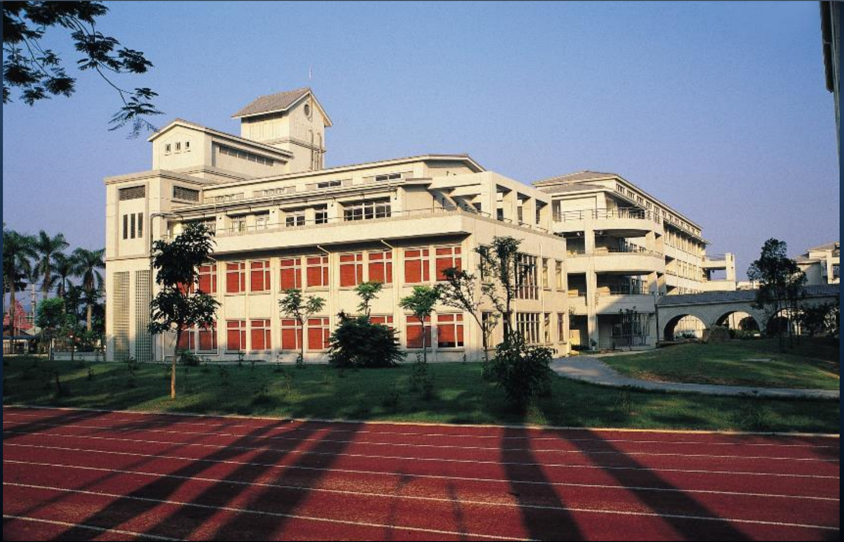
希望工程—旭光高中。 2002.07.24