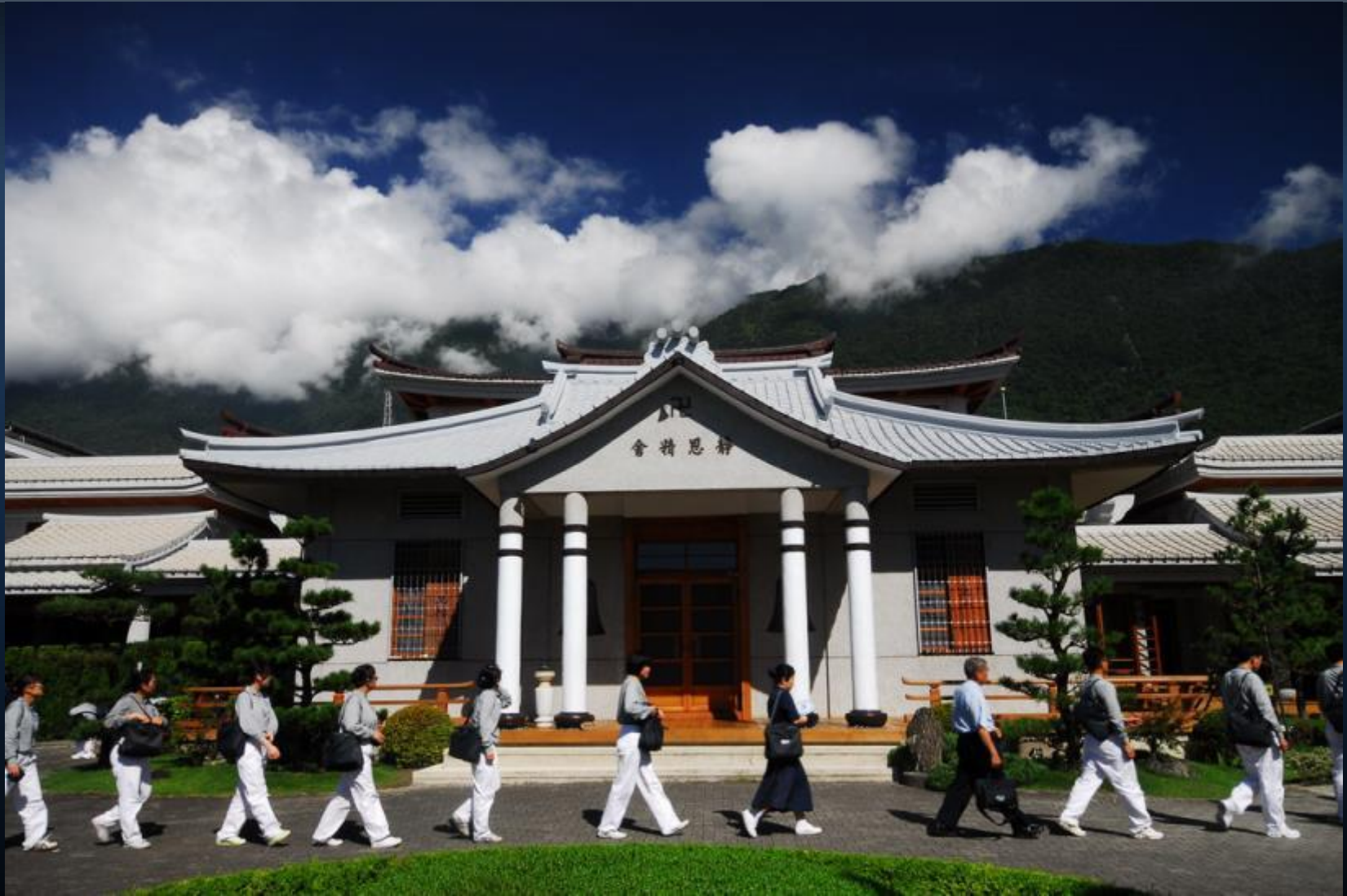
花蓮靜思精舍大殿與巡禮的志工隊伍。 2012.07.07