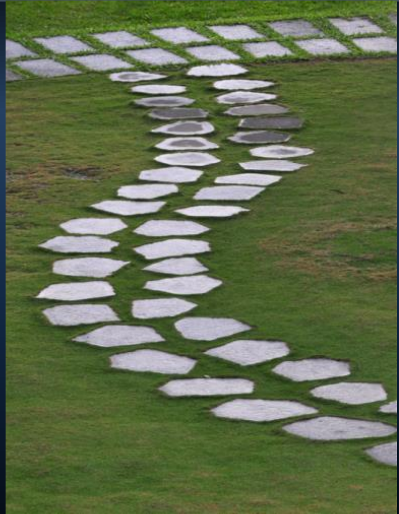
花蓮靜思精舍石頭步道 2012.10.28