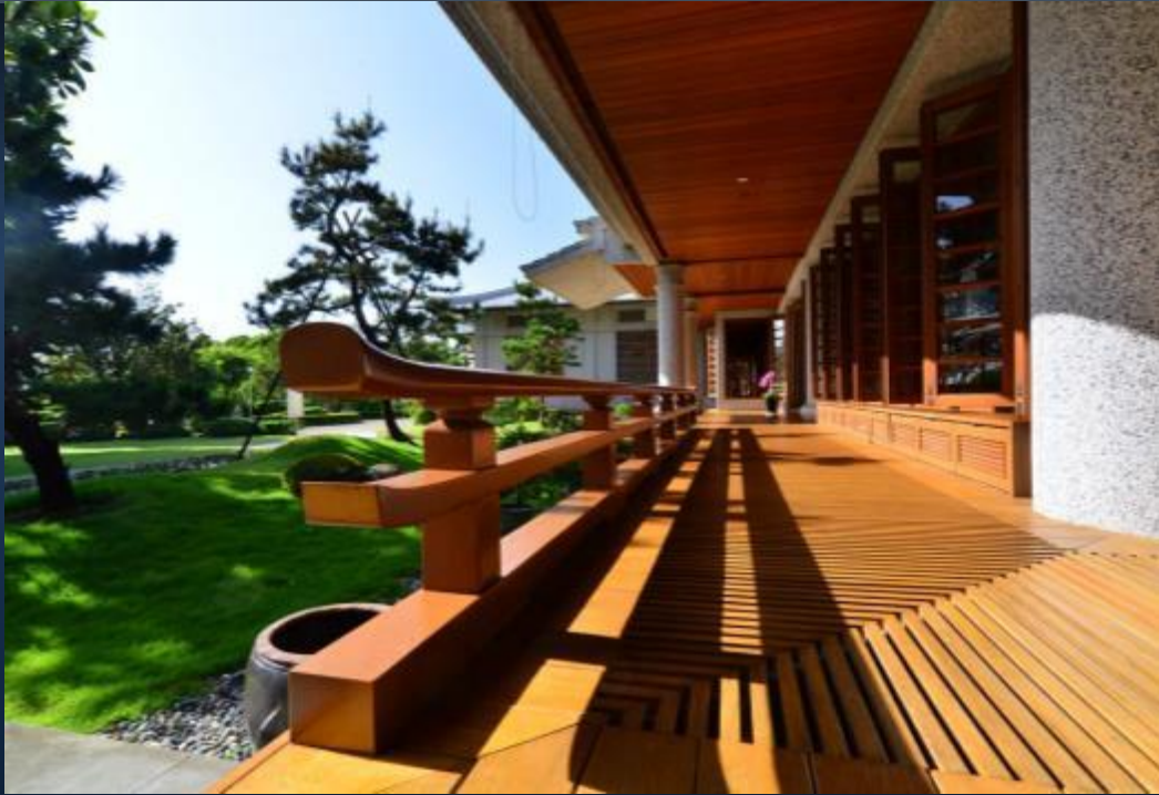
花蓮靜思精舍主堂走廊 2013.09.19