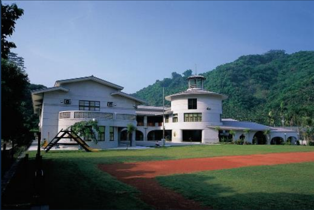
921希望工程—桐林國小。 2002.08.15