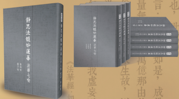
證嚴上人 講述 靜思法髓妙蓮華——法華七喻 醫珠喻 醫子喻 定價：360元

諸善男子！於意云何？頗有人能說此良醫虛妄不也，佛言：如是，成無量無量生故，亦言阿含。