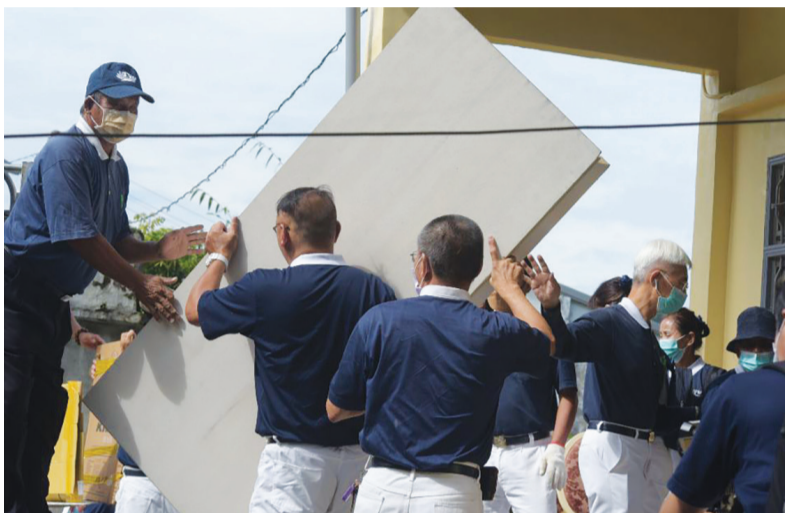
▲高雄慈濟志工將募集而來的物資，接力搬進阿州與阿民兄弟的家。