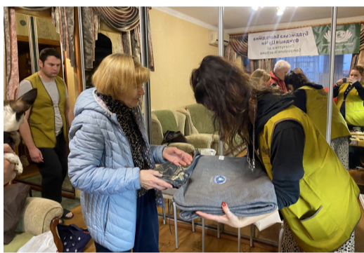
▲烏克蘭慈濟志工在札波羅熱進行首次冬令發放。志工以恭敬的心，鞠躬、雙手將環保毛毯贈給受難民眾。

烏克蘭訊 / 俄烏戰爭迄今已逾一年八個月，超過五百一十萬烏克蘭民眾依然無法返家。面對即將迎來的烏克蘭冬季，難民的生活無疑是雪上加霜。 期待他們能安穩度過戰爭以來第二個寒冬，慈濟遂與多機構合作，分別在烏克蘭、摩爾多瓦及波蘭華沙，規劃進行冬令發放。物資包含有環保毛毯、現值卡、糧食及日用品。 首波發放預計在烏克蘭的札波羅熱及基輔，預計發放一萬四千條毛毯及一千份糧食包，可維持兩個月生活所需，受益三萬人。除了定點的發放外，行動不便者，志工則帶著物資前往住處發放。 「我每天都在想：『如果我的家被炸掉，我可以去哪？』」