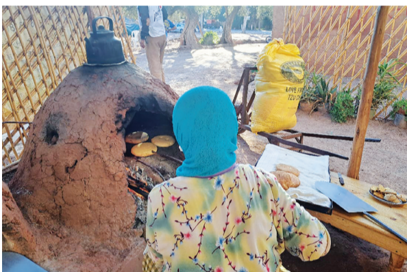
◀鄉親領到慈濟的家庭糧食包後，回家馬上用來做成烤餅。

摩洛哥訊 / 距今兩個月了，北非摩洛哥九月八日發生芮氏規模六點八強震，奪走二千九百多條人命的悲劇，早已淡出媒體關注，慈濟卻不曾遺忘；十一月八日，在當地開始進行大規模發放活動，民眾牽騾子或騎摩托車前來領取賑災物資，有男孩是哭著來的，因為這場地震讓他失去了爸爸媽媽，成了孤兒。 強震導致阿特拉斯山脈 (Atlas Mountains) 山區村落嚴重受災，多數居民至今還住在帳篷裡，甚或露宿街頭；震