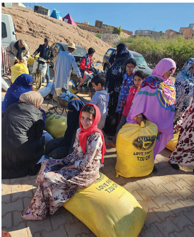
►摩洛哥於九月八日發生芮氏規模六點八地震，慈濟與舊德協會 (Jood Association) 合作展開紓困發放。領到物資的婦女，露出難得的笑容。