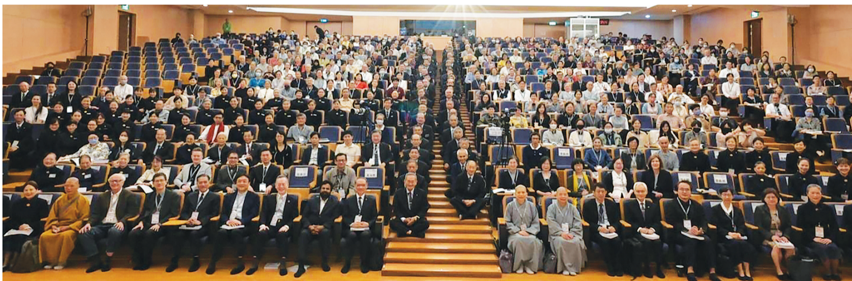
◀最迫切的危機、最熱情的關注，第八屆慈濟論壇「邁向平等的新世代」，包括線上觀看網路直播，萬人參與。