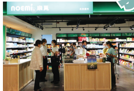
◀ 複合多元的植境空間，引導更多民眾輕鬆體驗一日蔬食。