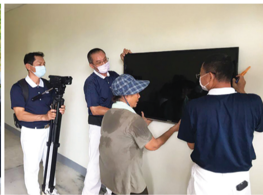
▲志工將社區募集來的大小家具及各式家電，包括床墊、冰箱、電鍋、電視……等，搬進屋內，並幫案家一一裝設妥當。