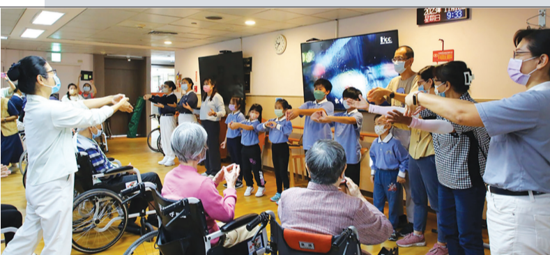
▲孩子們為大林慈院老人家帶來各項表演與同樂活動。

嘉義訊 / 小朋友們戴上老花眼鏡，再套上兩層手套，拿起筷子準備從碗裡挾出四種豆子……十一月十二日，慈濟嘉義親子班小朋友來到大林慈院，藉著探訪院內的老人家，也學習體會「什麼叫做老」？