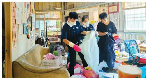
▲志工為小馭（右一）的家打掃，藉由陪伴，讓他不孤單。