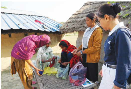
▶慈濟志工透過「以工代賑」的方式，廣邀尼泊爾村民為地震受災鄉親織絨線帽。

尼泊爾訊／為幫助尼泊爾民眾脫貧，慈濟志工開設職能培育班，繼裁縫及手工皂製作課程之後，又開設絨線帽職能培育課。十一月初尼泊爾發生芮氏規模五點六強震，慈濟志工已啟動勘災，因應日後發放需要大量絨線帽，志工於十一月十八日再增開三班絨線帽職能培育課。其實，從十月十九日起，即有十二位婦女「以工代賑」，在家編織絨線帽，為家庭增加收入。村民得知絨線帽是要發給在地震中受災的鄉親，紛紛把握機會送上溫暖與祝福。（文：慈濟基金會文史處）