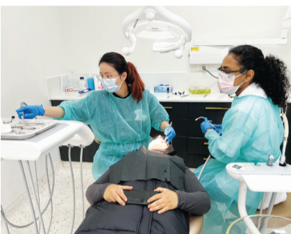
▲澳洲柏斯的慈濟人醫會牙科義診，每個月一次，幫助弱勢患者解決牙疼的困擾，也讓他們更有自信開口表達。

澳洲訊／澳洲柏斯的慈濟人醫會，從二〇一三年開始舉辦牙科義診，今年屆滿十年。開始時每半年一次，後來發現病情嚴重的患者為數不少，於是自二〇一七年開始，招募西澳大學牙醫系學生參與，每個月一次，幫助弱勢患者解決牙疼困擾，也更有自信開口表達。