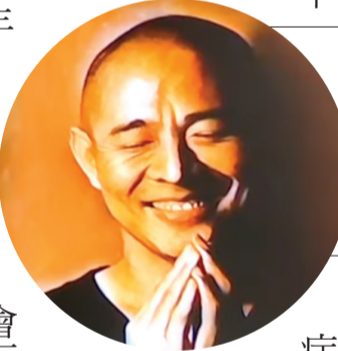
◀李連杰分享世間的「快樂認知」，人的欲望隨時變動無止境，因為追逐新的快樂許多煩惱跟著來。照片為大愛電視新聞畫面。

本刊訊 / 「我還沒死，托福了！」今年六十歲的「功夫皇帝」李連杰，十一月十六日擔任靜思書軒心靈講座講師。近年來，李連杰已經鮮少公開露面，還不斷被傳烏龍死訊，一出場就幽默地自嘲「還沒死」，駁斥網路流竄的不實傳言，也讓全場哄堂大笑。李連杰八歲進入武術學校，十歲從影，一路走來，總認為在演別人的故事，從中他一直在尋找自己的角色定位，用了二十五年時間去了解生、死是什麼，也用這樣的心態撰寫《超越生死：李連杰尋找李連杰》這本書。