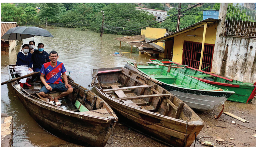
▼災區被水淹沒，慈濟志工僱船進入災區勘災。

巴拉圭訊／巴拉圭第二大城東方市，十一月初因為暴雨不斷，導致巴拉那河水位暴漲，造成鄰近低窪地區變成水鄉澤國。當地慈濟志工接獲通報，啟動勘災並發放，包括糧食和生活用品，希望一解災民的燃眉之急。黃澄澄的泥水湍急而下，原本的街道全變成一片汪洋，志工前往勘災，在聖拉斐爾區寸步難行，只能坐獨木舟，靠居民划行，才能實地了解災區情況。