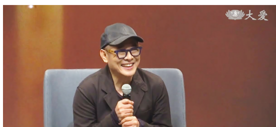
知名影星 李連杰 我還沒死 夜安新聞

慈濟大學模擬醫學中心3至6日舉辦模擬手術課程，啟用六位無語良師，7日舉行送靈、追思感恩暨入龕典禮。