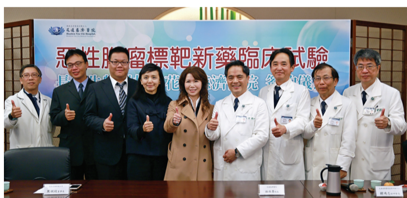
▲花蓮慈院與長弘生技進行Cerebraca® Wafer新藥開發，為腦瘤患者帶來治療新曙光。

花蓮訊／惡性腦瘤是最難治療的癌症之一，且近二十年來尚未開發出有效藥物。花蓮慈濟醫院林欣榮院長帶領慈濟創新研發中心團隊與長弘生技公司成功開發惡性腦瘤標靶新藥Cerebraca® Wafer，已於二〇一七年啟動臨床試驗，經由花蓮慈濟醫院、三軍總醫院、臺中榮民總醫院神經外科團隊的共同努力，目前已完成第二期臨床試驗，預計明年啟動全球Phase II/III期臨床試驗。