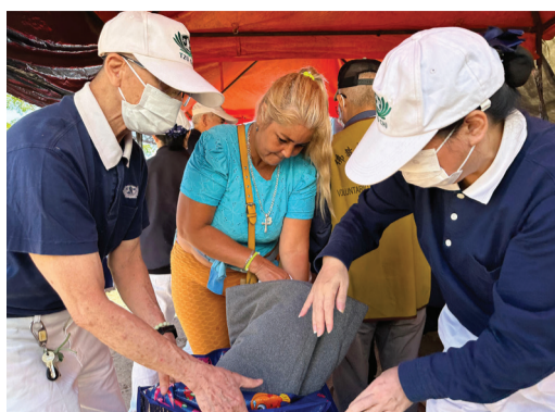
▶慈濟志工前往河邊兩個受災區的臨時避難所發放物資，為災民送上毛毯，協助將毛毯裝進環保袋中。