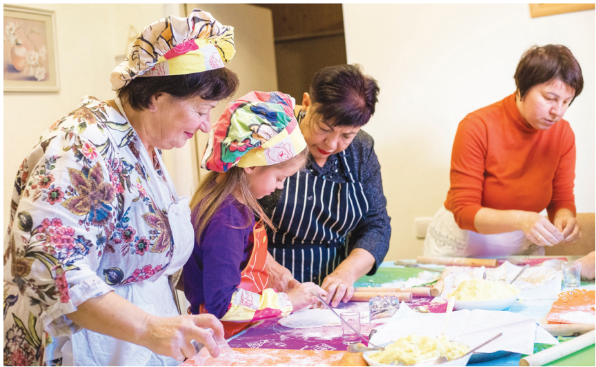
▲烏克蘭札波羅熱的「餃子俱樂部」讓難民以愛撫傷悲。

烏克蘭訊／「烏克蘭難民的餃子俱樂部，現在在札波羅熱設有分部。」它是由烏克蘭老年人發起的，希望讓孤寂的老人藉由一起包餃子，撫慰心靈。 俄烏戰爭下，烏克蘭札波羅熱天天砲火聲或遠或近，沉悶與悲傷重重地籠罩著當地的居民。十月廿七日至十一月一日，慈濟為札波羅熱居民舉辦冬令發放。發放同時，慈濟也與他們分享竹筒歲月的精神，以及在波蘭的烏克蘭難民成立餃子俱樂部「八分飽兩分助人好」的故事。 「餃子俱樂部」的構想是由烏克蘭志工們提出，他們在波蘭家訪難民的過程中，看到許多老人家離開了家鄉又不懂當地語言，無事可做、不與人溝通、不與社會交流，甚至覺得人生沒有意義，於是開辦了「餃子俱樂部」，讓老人家有事可做，還能聚會聊天，餃子販賣所得八分回饋給老人家們使用，另外