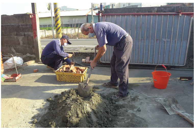
慈濟志工自帶工具、材料來到林顏阿嬤家，展開修繕作業，解決庭前廣場與馬路的高低落差問題。

臺灣邁入老年化社會，獨居長者或是兩老相依的情形不少，慈濟志工透過安美專案，讓社區長者們能有安穩、安心的居家生活。（文：陳夢希、蔡能通、陳盈光）