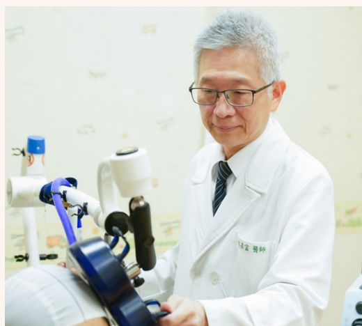
▲ 重複穿顱磁刺激術 (rTMS) 是強迫症與重度憂鬱症患者的新療法之一。

臺北訊 / 強迫症是廣義的心理焦慮症之一，臺灣人罹患強迫症的盛行率約百分之二到三，醫師表示，實際罹患比率可能更高。因為患者的重複行為與思維症狀若不明顯，則不易診斷。 臺北慈濟醫院近期協助一位強迫症患者，透過「重複穿顱磁刺激術