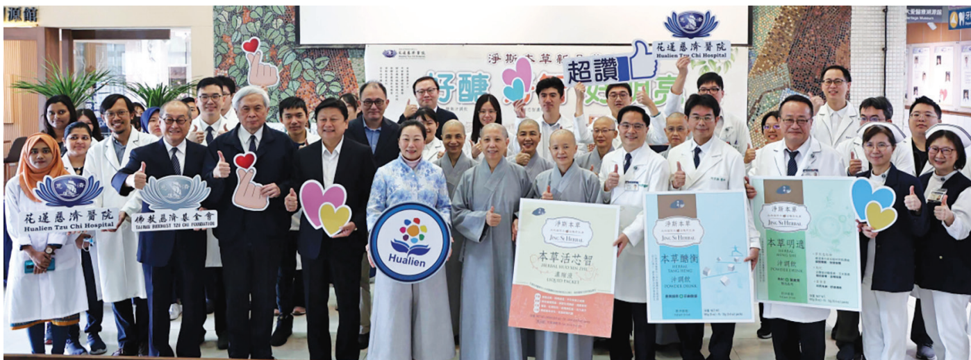
▶ 花蓮慈濟醫院針對明目、護心、護腦與穩定新陳代謝等四大主題，舉行研究成果發表會。

本草系列產品可輔助中西醫治療，但也提醒民眾，建議食用前可與中醫師討論使用方式。（文：黃思齊、江家瑜）