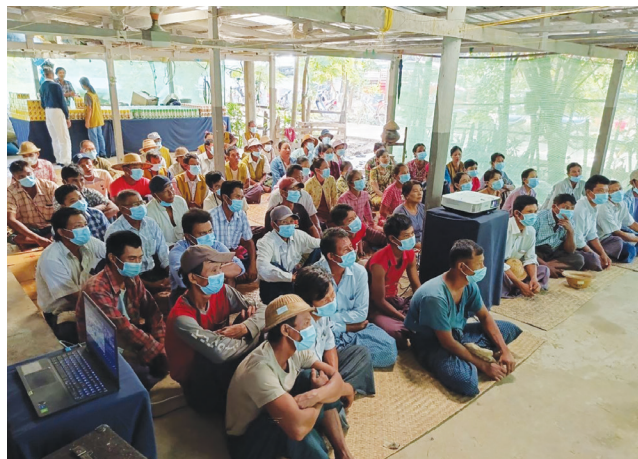
▼緬甸水患後，災區農田受損嚴重，圖為等待領取肥料的農民。