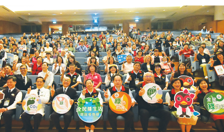
▶ 花蓮縣政府與慈濟基金會一起推廣「淨零綠生活」，合作辦理一系列「友善蔬食」座談體驗活動。

從回饋中，有許多業者懷著熱切想改變的心，也希望以自身行動，為地球及居住環境盡一分心力。（文：慈濟基金會文史處）