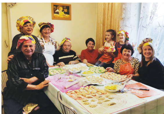
▲烏克蘭難民用捲心菜和馬鈴薯包餃子，捐贈給有需要的家庭，熟悉的家鄉味，溫暖入心，也支持著他們面對未來的日子。

兩分幫助其他需要幫助的難民。老人們因為「餃子俱樂部」，找到了心靈的依靠，重拾人生希望。 這樣的故事觸動了札波羅熱的居民，表達也希望成立「餃子俱樂部」；志工不負眾望，達成他們的心願。他們用捲心菜和馬鈴薯包餃子，捐贈給有需要的家庭，熟悉的家鄉味，溫暖入心，也支持著他們面對未來的日子。 (文：慈濟基金會文史處)