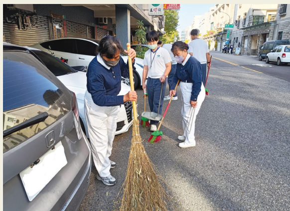
▲臺南慈中同學們深入社區街道進行打掃，懿德媽媽以行動作典範，帶動學生為環境盡一分力量。

臺南訊／十一月廿五日週六早上，段考結束隔日，臺南慈濟中學的學生們用掃街當志工來慶祝段考結束。當天兩百多名學生與師長和慈誠懿德爸媽，以校園為中心，認真清掃附近街區。學生跟著長輩們細心掃地，蹲下身來拔除