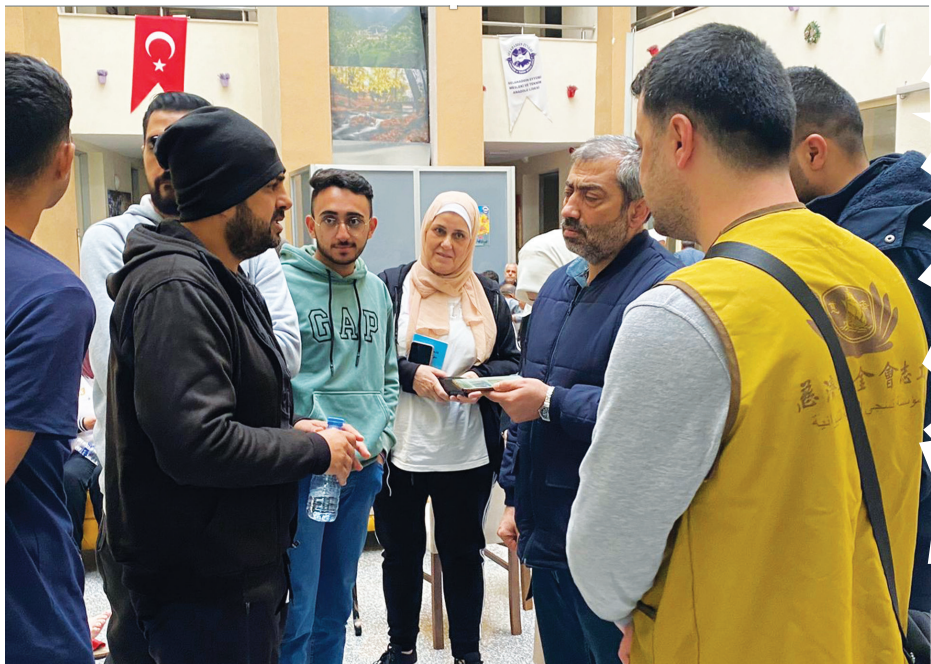
▲從加薩走廊到達土耳其的巴勒斯坦難民，向慈濟志工述說他們的艱困處境。(文：慈濟基金會)