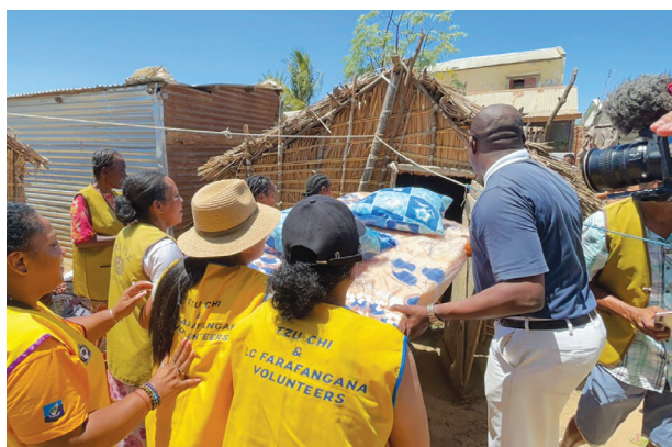
▶慈濟志工為實業家創造親手布施的機會，帶著他們為貧苦的老奶奶送來新的床鋪和枕頭；付出的當下，他們體會到人生行善的價值與意義。