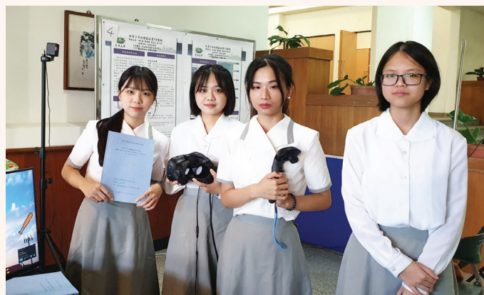
▲慈大醫資系同學與兒家系合作發展「給青少年的情感疾患 VR 衛教」。