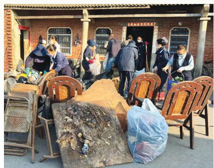
慈濟志工幫忙清理室內外環境。