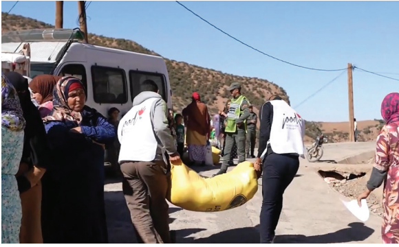
▲慈濟援助摩洛哥震災的物資委由舊德協會志工執行發放，截至十二月四日已於三個區廿二個村完成發放，受惠三千零四十四戶家庭，總受益人數約兩萬人。