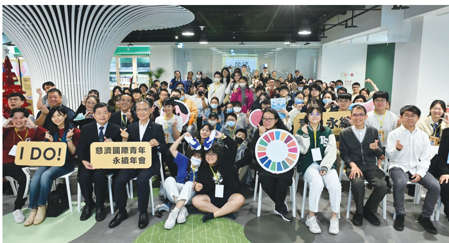
▶ 第二屆慈濟國際青年永續年會以「青力永續，我願意！Sustainable · I DO！」為主軸，匯聚年輕世代，關注永續議題，團結起來付諸行動。