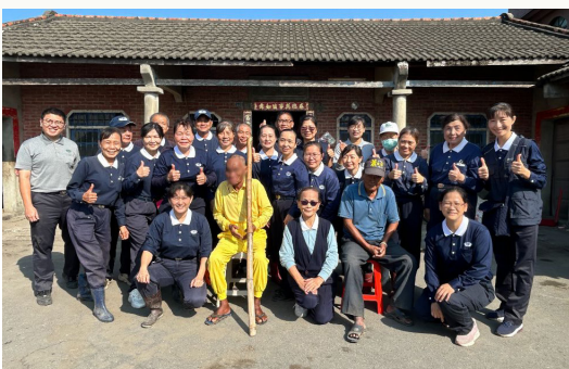
北港慈濟志工及社工一起幫忙清掃，意外化解兩兄弟多年心結，為這次關懷行動畫下圓滿句點。