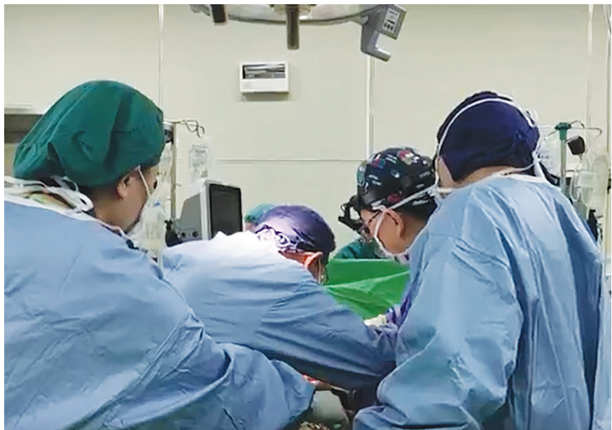
▶在大林慈濟醫院醫師同心協力下，完成高難度的肝臟移植手術。