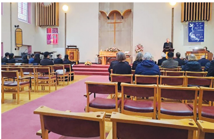
▶十一月十七日，在慈濟志工協助下，陳姓老夫婦為女兒舉辦了告別式。