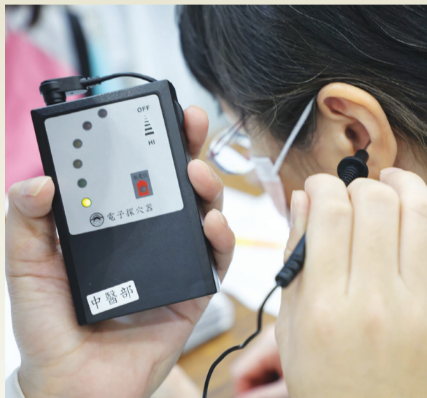
▶花蓮慈濟醫院中醫部醫師駐點，運用耳穴探測儀，從體驗民眾的耳朵對應身體各部位的穴位來檢測身體狀態。

臺北訊 / 花蓮慈濟醫院已連續六年參加臺灣醫療科技展，除了專家講座、海報展，中醫部設置的體驗區年年都是「人氣熱點」，今年除了中醫耳穴檢測、氣場能量檢測，還有智順科技公司帶來的「一手診儀」，以及由臺灣大學