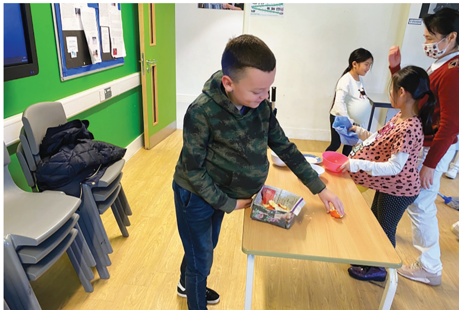
▲扮演媽媽遊戲，體驗媽媽懷孕、做家務的辛苦，讓小朋友懂得感恩媽媽，孝順媽媽。

英國訊／倫敦慈濟人文學校是目前歐洲第一所慈濟人文學校，由於疫情的關係，學生人數從一百二十位降至六十位，為了學校的穩定發展，倫敦慈濟志工決定多管齊下，申請臺灣華語文學習中心，以及招募老師與學生。