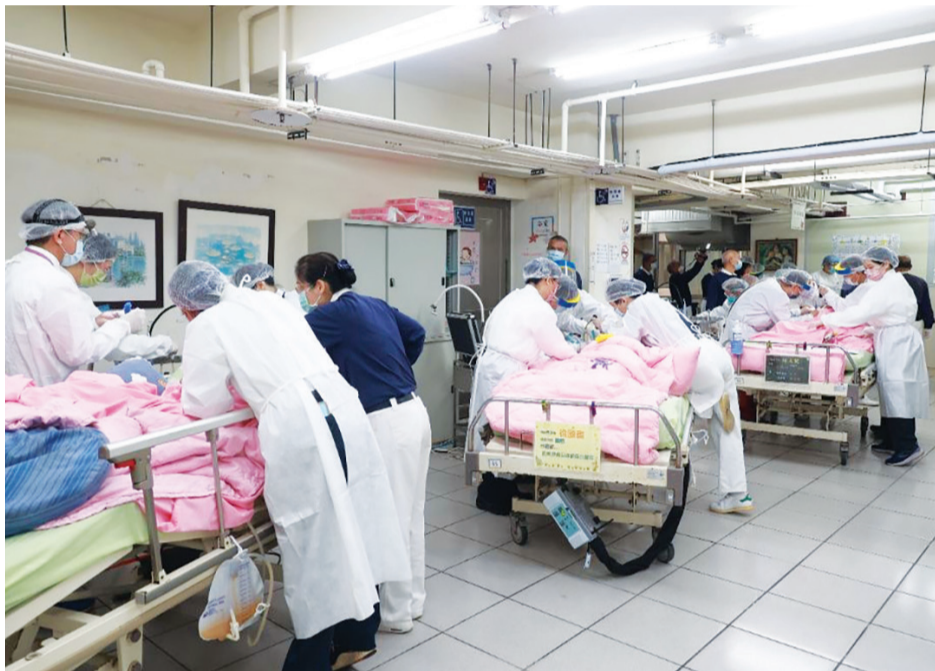
▲北區慈濟人醫會與慈濟志工，在基隆展開因疫情停辦三年的植物人洗牙義診。