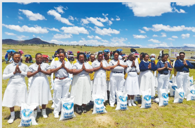
▲賴索托大米發放後，慈濟志工會帶著村民一起祈禱，感恩發放圓滿，也祈願天下無災難。

賴索托訊 / 非洲南部賴索托因為土地乾旱、農作歉收，加上百分之二十二點四的超高失業率，許多家庭難以溫飽；尤其鄉村地區的村民，經常要與飢餓奮戰。 慈濟基金會在二〇二三年，動員了當地志工一千六百八十三人次，在賴索托境內馬費滕 (Mafeteng)、馬賽魯 (Maseru) 等地，總計進行了一百七十四場大米發放，送出三萬六千兩百六十五包大米，希望藉由發放，緩解貧苦居民食物匱乏的苦境。 一名賴索托的村長表示，很感恩慈濟的發放，因為氣候變遷，天氣時而乾旱，時而暴雨，導致農作物無法生長。許多民眾為了領取一包大米，甚至是涉水而來，因為發放前突來的一場暴雨，讓河流漲出水