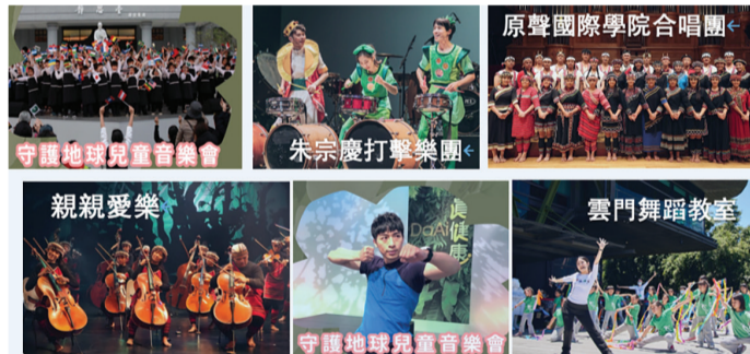
▲第二天的藝術表演者和團體。

十二月卅日更新增一個「甜心區」，要給參與的民眾們一個驚喜的歲末跨年。為響應環保，主辦單位提醒，參與的民眾請自備環保餐具。 【快閃】十二月廿九日中午時段，於華碩、和碩與和信三個大型機構，進行「快閃」表演，提醒大家，在忙碌一天下班後，讓藝術、蔬食，幫助您從工作模式切換到放鬆模式。 【健康守護區】十二月廿九日有捐血、癌症篩檢宣導、骨髓幹細胞中心驗血建檔、3C 商品回收及智能健康小站。當日捐血及骨捐建檔民眾，有機會獲得味全龍職業棒球隊的小禮物。