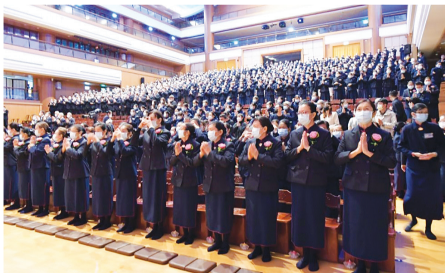
▲一百一十四位甫受證的慈誠委員接受證嚴上人的祝福，九百多位慈濟志工和二十五位家屬同場觀禮，還有十二個國家地區線上同步參與。