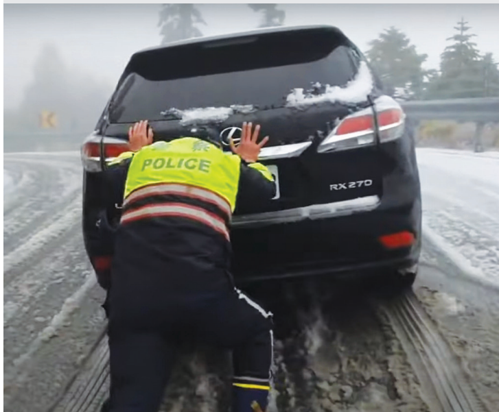
▲合歡山雪季開車上山追雪的民眾，若車況出問題，提供即時救援的就是山上值勤的員警。