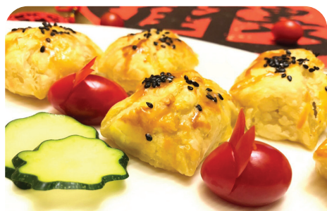
食譜設計：許美惠 (圖 / 文：靜思園地提供)

年糕的熱量高，含碳水化合物及糖；鹹年糕的鈉含量也不低，因含水量少，不易消化，不宜多吃，可用酥皮做變化，既應景又解饞，全素者可安心食用。