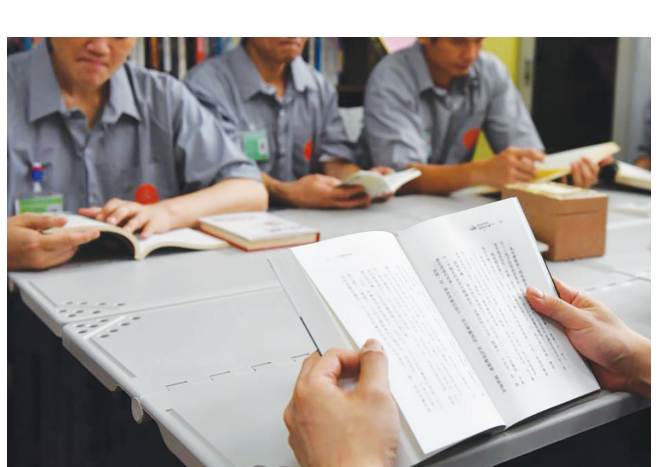
▲五百多本好書，期許受刑人們能因為其中一本書，或是一句話，受到正向影響。