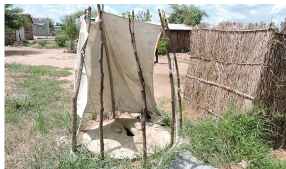
村民用帆布或茅草搭建的廁所。