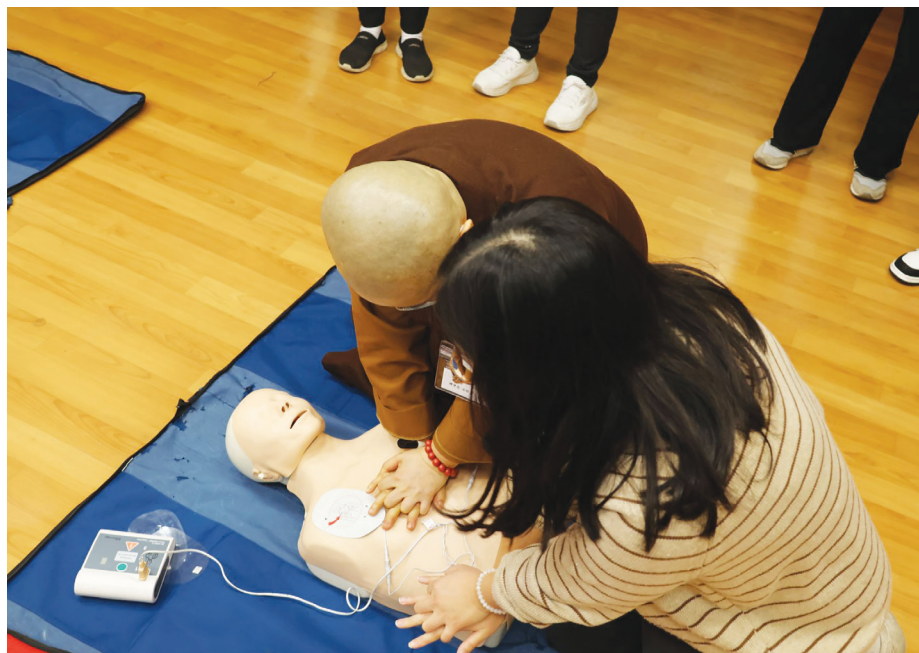
▲開訓第一天下午進行實作課程，法師專注學習心肺復甦術。

臺中訊／臺灣步入高齡化社會，全臺的僧伽同樣面臨老化和病痛的問題，去年八月證嚴上人行腳臺北，中華僧伽長照人文關懷教育協會（以下簡稱僧伽長照協會）會常法師拜訪上人，提出希望與慈濟醫療和長照合作協助僧伽的照護，促成本次照顧服務員培訓課程的因緣。 首屆的僧伽照顧服務員培訓課程，二〇二四年一月四日至九日在臺中慈濟醫院進行六天課程。來自全臺的僧伽長照協會，共二十七位學員，包含九位法師報名參加。在這次照顧服務員培訓之後，他們將返回各自的道場，投入年邁法師的長照服務工作。 會常法師表示，感恩證嚴上人抱持「我們都是一家人」的慈悲心念，促成本次合作，協助建立僧伽老病的照護網。在長照的學習課程中，慈濟以人為本、長期照顧、永續經營這三大區塊，與僧伽長照協會想推動的理念是一致的，同樣都是在落實人間菩薩行，藉由照顧法師的身體先安身，再以共修共學形式而安心。 (文：鄭淑鳳)