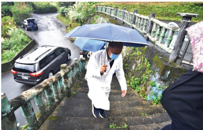
▲新北市十二度低溫，慈濟義診團仍走訪關懷每一戶案家。

慈濟醫護團隊安慰楊先生，此刻正是報答親恩的時刻，並分享證嚴上人所說，行善行孝不能等。楊先生聽了感到寬慰許多。慈濟人醫義診，除了醫病，也慰暖了許多人的心。 (文：池亮蓁)