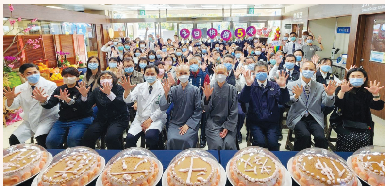
▲與會來賓及醫護同仁大合照，祝賀斗六慈濟醫院五歲生日快樂。

斗六慈濟醫院看到這個需求，有大林慈濟醫院當後盾，把資源帶到雲林，為在地鄉親注入一股醫療活水，不用再舟車勞頓到外地就醫。此外，醫療團隊更舉辦多場篩檢、義診、醫療保健等，從源頭守護民眾的健康。 靜思精舍德俱法師勉勵大家，斗六慈濟醫院一路走來，發揮證嚴上人建院的心念，因慈善而醫療，如今又從醫療而回到慈善，照顧雲林這塊土地，慈善、醫療一體，做得更多更好，發揮更大力量來照顧鄉親。 (文：黃小娟)