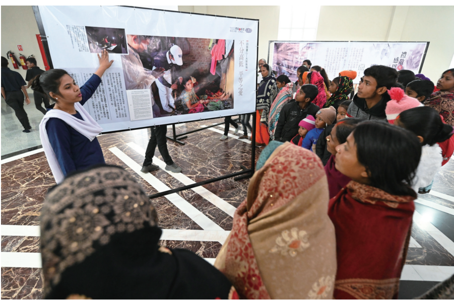
印度首場歲末祝福結合「佛陀足跡展」，讓印度鄉親了解慈濟在地的慈善關懷。