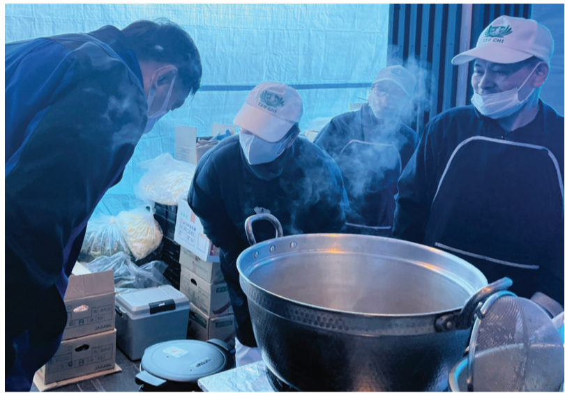
▲日本石川縣知事(左一)親自到慈濟志工烹煮熱食的冥王星交流會館外區，致謝感恩。

日本訊／慈濟志工投入 石川縣穴水町關懷，進行每天中午的熱食發放，已進入第二週。災區何時才能回歸日常生活？居民心裡沒有答案。但居民知道慈濟的午餐熱食，百分百準點供餐，且志工自十二日以後的熟悉身影，似乎也稍緩了居民懸宕的心。 前來領取餐食的六十歲有田女士告訴志工，因為這碗熱食，讓她嘗到幸福的滋味。她流下眼淚，向志工傾吐近日來的心聲，志工輕輕擁抱她，希望帶給她一點力量。 慈濟在日本的熱食發放受到日本當地媒體關注，日本放送協會(NHK)、日本雅虎(YAHOO)、日本產經新聞都報導了志工們的行動。一月二十日，石川縣知事馳浩與總務大臣小森たけお，親自來到志工們烹煮熱食的冥王星交流會館外區，向志工們表達至深的感謝。 (文：慈濟基金會)