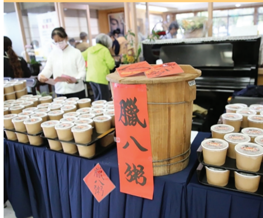
▲紀念佛陀成道日，農曆十二月初八這天靜思精舍會煮「臘八粥」，供眾結好緣。