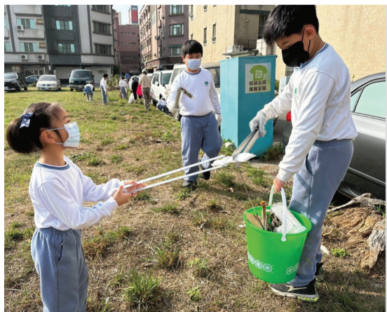
▶臺南慈小的同學們用心投入，撿起草叢中的垃圾。（圖：臺南慈濟高中國小部）

科學家——趣味科學特展」，有許多好玩富知識性的互動展品，歡迎大家在春節期間，把握機會規劃一趟親子之旅！（文：溫燕雪）