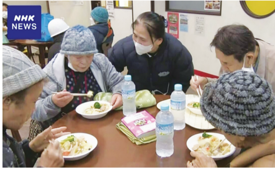
▲日本放送協會NHK報導慈濟志工在熱食烹煮上付出的細心與愛心。

日本訊／慈濟志工投入 石川縣穴水町關懷，進行每天中午的熱食發放，已進入第二週。災區何時才能回歸日常生活？居民心裡沒有答案。但居民知道慈濟的午餐熱食，百分百準點供餐，且志工自十二日以後的熟悉身影，似乎也稍緩了居民懸宕的心。 前來領取餐食的六十歲有田女士告訴志工，因為這碗熱食，讓她嘗到幸福的滋味。她流下眼淚，向志工傾吐近日來的心聲，志工輕輕擁抱她，希望帶給她一點力量。 慈濟在日本的熱食發放受到日本當地媒體關注，日本放送協會(NHK)、日本雅虎(YAHOO)、日本產經新聞都報導了志工們的行動。一月二十日，石川縣知事馳浩與總務大臣小森たけお，親自來到志工們烹煮熱食的冥王星交流會館外區，向志工們表達至深的感謝。 (文：慈濟基金會)