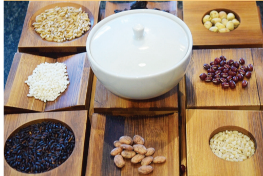
▲靜思精舍臘八粥是以長糯米為基底，加上黃豆、紅豆、花豆等食材調煮而成。