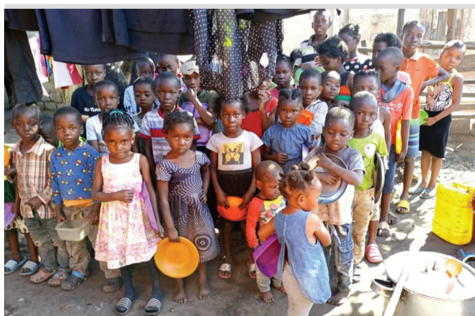
尚比亞曾經被列為全球飢餓程度緊急的國家之一，圖為當地的孩子拿著盤子等待領取玉米糊的情景。