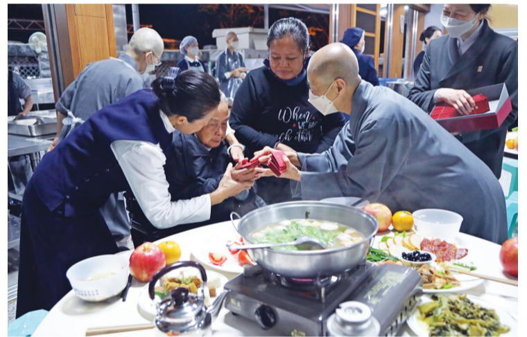
▲除夕圍爐，精舍師父發送紅包，祝福大家福慧平安。