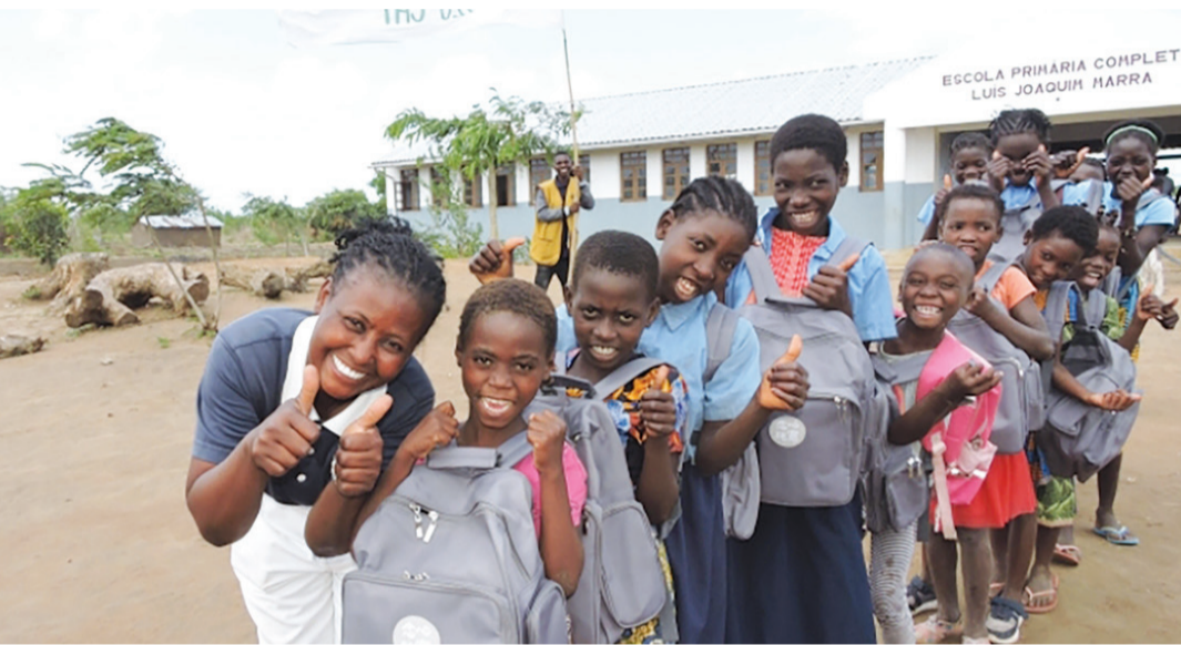
莫三比克慈濟志工於喬輕馬拉小學為學生發放書包、學用品及衣服，小朋友非常開心。