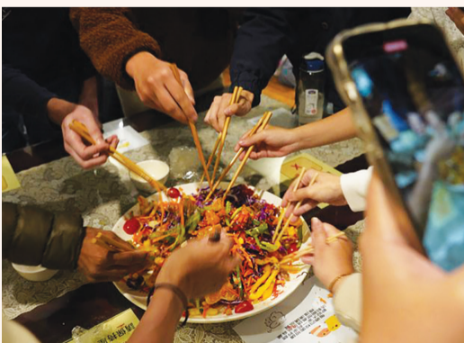
▲馬來西亞學生準備家鄉過年必備團圓菜「撈生」，讓慈大師生共同體驗異國文化。

前年，國際處邀請馬來西亞學生準備家鄉過年必備團圓菜「撈生」。臺灣除夕有團圓飯，在馬來西亞華人的除夕夜也是和家人團聚吃飯。有一道特別的料理「撈生」，食材可以高達三十樣以上，每一樣食材都取其吉利之意，例如：紅蘿蔔