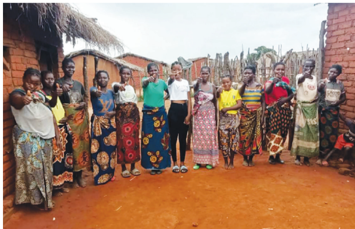
尚比亞的婦女行動力十足堅強，她們發願自籌玉米粉，要餵飽無依的老人和小孩。