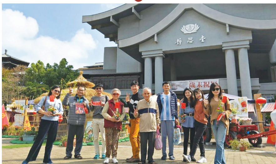
▲各地靜思堂初一~初三充滿年味的活動，歡迎來慈濟靜思堂走春，「ㄉㄨㄛ您龍吉祥·龍平安」。(攝影：郭綵娥)