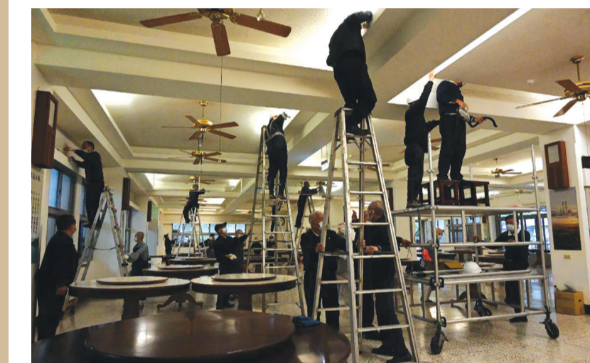
▶同仁、志工將靜思精舍當作自己的家來大掃除。