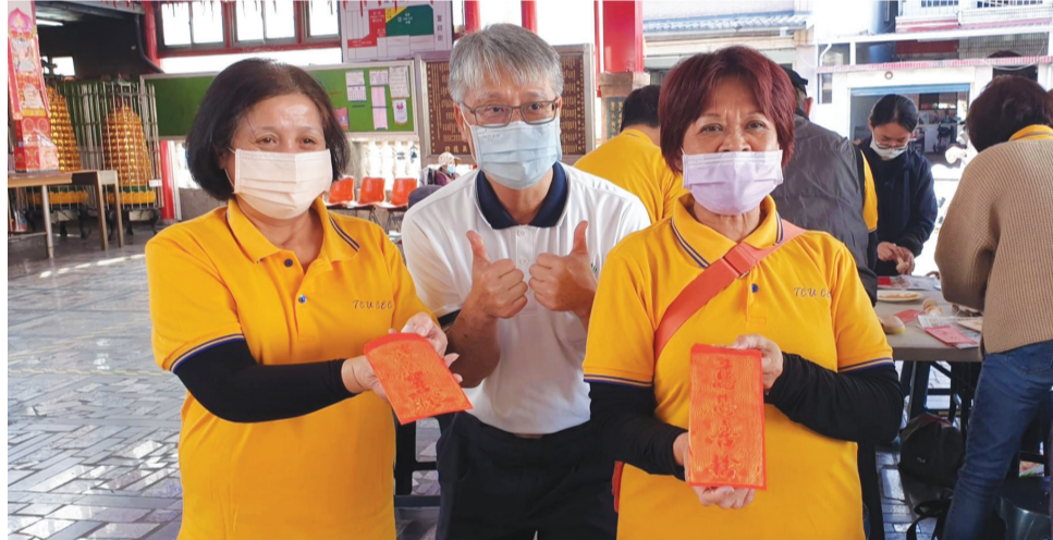
▲慈濟大學人文處同仁特別準備了應景的拓印紅包袋，讓長者可以「秀」出金光閃閃、福氣滿滿的紅包。

絲（鴻運當頭）、芝麻（子孫滿堂）、黃玉米（金玉滿堂）等。「撈生」其實是一個動作，圍桌的所有人拿起筷子，把材料撈（拌）在一起，口中要同時說「撈起」、「步步高升」、「年年有餘」等吉祥話，撈得愈高，代表運勢愈好。前年一起參加的人數將近百位，包括臺灣、香港、馬來西亞、印尼、尼泊爾、烏克蘭等地師生，慈大馬來西亞籍的老師溫秉祥表示，來到臺灣已經超過十五年，今年是第一次在臺灣吃撈生，感謝同學們的用心準備。