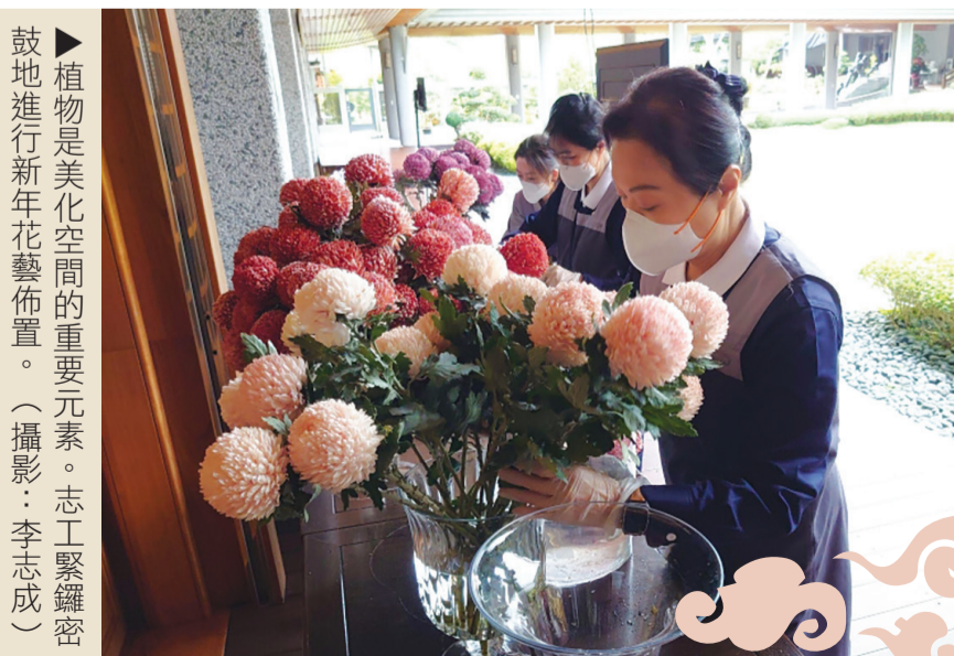
▶植物是美化空間的重要元素。志工緊鑼密鼓地進行新年花藝佈置。