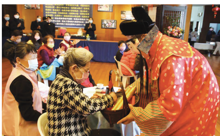
▲志工扮財神爺，捧著裝滿糖果的金元寶及金幣的提籃，為鄉親獻吉祥祝福。

本刊訊 / 初一出行稱為「行春」、「走春」，「春」臺語表示剩餘，「行」則有聯誼、祝福之意。過年走春，人們一定都會先到寺廟祈福，然後到親友家拜年，或者以旅遊方式「走春」。新年期間到親友家拜年，主人會以甜點招待，客人拿起甜點必須「講好話」祝福對方，比如說「吃甜甜乎恁賺大錢」、「吃紅棗乎恁年年好」等等。