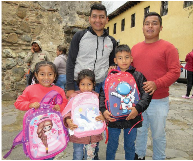
◀領到書包的孩子與爸爸開心合影。

瓜地馬拉訊 / 小朋友領到新書包和文具，全家人跟著歡喜雀躍！ 這是慈濟志工在瓜地馬拉薩卡特佩克斯省別哈城市府活動中心 (Salón de municipal Ciudad Vieja, Sacatepéquez, Guatemala) 為孩童發放書包與文具，現場見到的溫馨情景。 慈濟瓜地馬拉志工趕在新學期開學前，準備了新書包與成套文具用品，送給當地學童，總計有八百名小學生、中學生領到這份禮物。這份禮物為當地家長們減輕了很多負擔。 活動現場仿如慶典般熱鬧，家長見到孩子領到書包和文具，神情跟孩子一樣喜悅。不少家庭為此特地拍照留念。 捐贈典禮上，市長弗雷德里克 (Federico Bethancur) 親自頒發感謝狀與木製手工藝品向慈濟致謝，慈濟志工林慮瑤和張慈燃則以福慧紅包、平安吊飾和環保筆作為回禮，互表感恩與愛。 (文：朱秀蓮、吳慈恬)