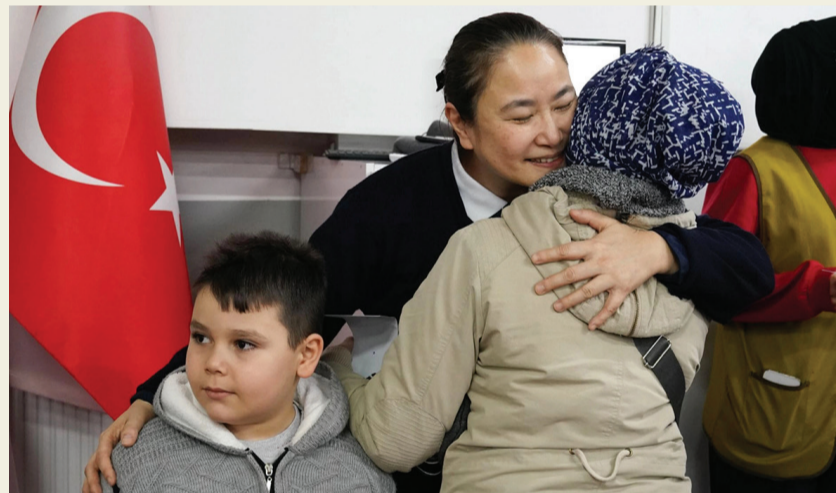
▲二月六日土耳其地震滿週年，許多家庭仍然深陷貧困，慈濟的陪伴與關懷讓災民深深感動。