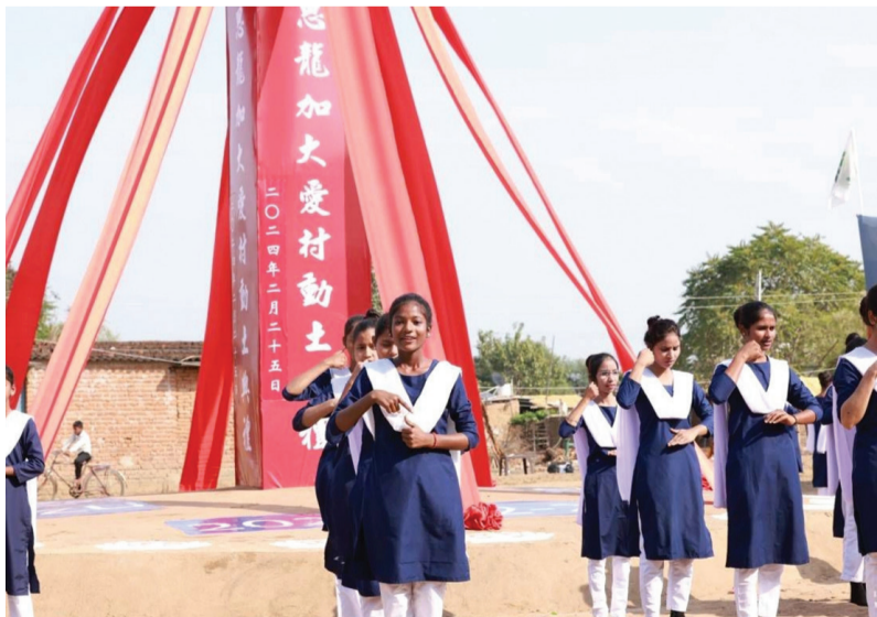
▶當地六十三位年輕女孩演繹慈濟歌選〈千手世界〉，柔和手語與身形，感動現場許多人。

二〇二三年二月十三日，慈濟志工走入思龍加村，見村內以土牆及茅草搭屋，難以抵擋大風大雨。三月十一日起，馬來西亞與新加坡慈濟志工即開始接力耕耘菩提迦耶至今。 (文：張美齡)