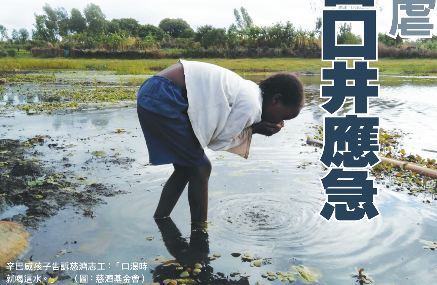
辛巴威孩子告訴慈濟志工：「口渴時就喝這水。」