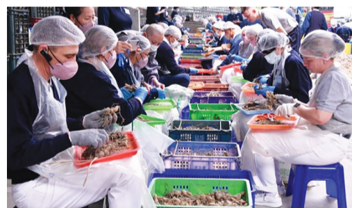
▲波蘭烏克蘭志工回到靜思精舍，在齋堂前幫忙整理薑黃，農禪生活的專注、寧靜像是一種療愈，膚慰了與家鄉親人分開的傷痛。