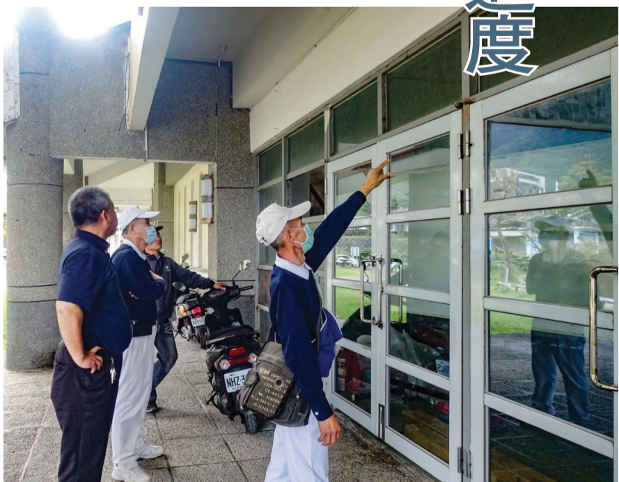
▲慈濟基金會同仁偕同志前往小犬風災受損嚴重的蘭嶼高中了解重建進度。

蘭嶼訊 / 二月二十日慈濟志工重回蘭嶼關懷「2023小犬颱風」災後重建工作進度，獲得援助的民眾與學校都對慈濟志工表達謝意與感動。 二〇二三年十月，小犬颱風重創蘭嶼，慈濟基金會安排貨輪運送物資協助蘭嶼鄉親，並透過臺東縣府與當地公所及社福單位的提報，經由實地的勘查與評估後，協助部分家庭進行重建。此外，也協助島上蘭嶼高中修復門窗與水電。 這次回訪關懷，也確認修復的工程都在進度中，希望能讓受災的居民安心安居，生活早日步上常軌。 (文：慈濟基金會)