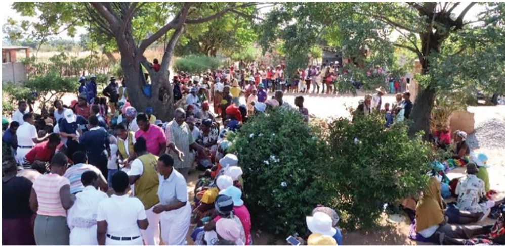
▶每天前來供食站領取餐食的人潮排成人龍。