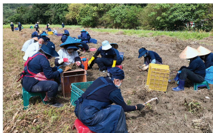
▲人人蹲身採薑黃，猶如一幅慈濟版的「拾穗」。

本刊訊 / 春寒料峭，乍暖還寒。每年二月到三月之間，是薑黃收成的季節。然而，春季天氣不穩定，必須搶晴天戰雨天，趁著天晴趕緊採收。薑黃採收下來，需要大量人力幫忙刷掉泥垢、剪除鬚根，還要小心清除爛掉的部分；但不能直接切斷，以免造成傷口容易腐爛……這些過程，在在可見收成的過程，既繁瑣又艱辛。