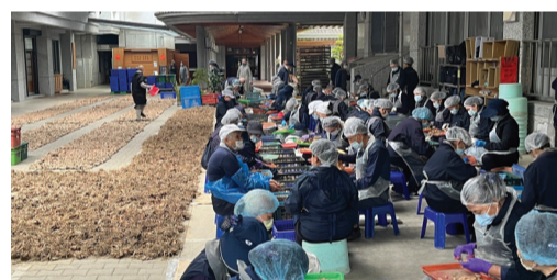
▲齋堂前，志工們將粗略剔除的薑黃鬚根及泥垢，進一步清理得更乾淨。