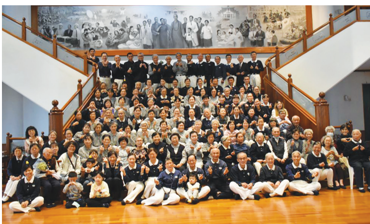
▲臺南東區慈濟志工新春慶團圓，大家相約一起走在助人的菩薩道上。