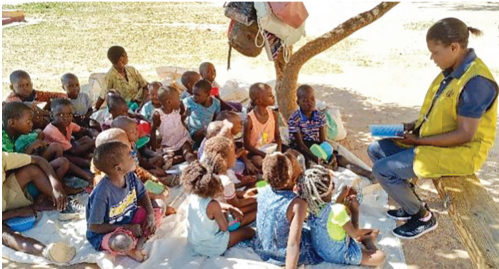
▶當地慈濟志工帶動前來領取餐食的孩童學習唱供養歌。