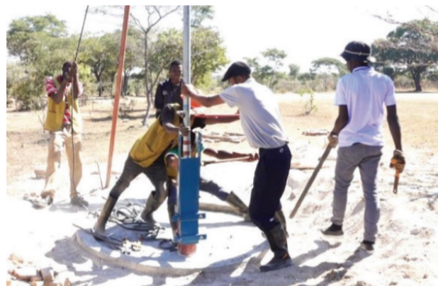
▲慈濟在辛巴威協助鑿井、修井，從四十公尺深鑿到八十公尺深，因當地無工業污染，井水可確保乾淨。