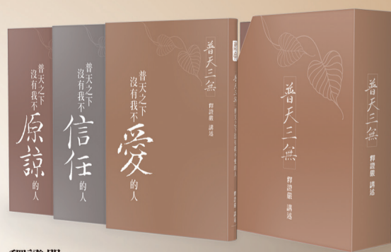
釋證嚴 講述 ■ 三冊 600元（附贈精美書盒）