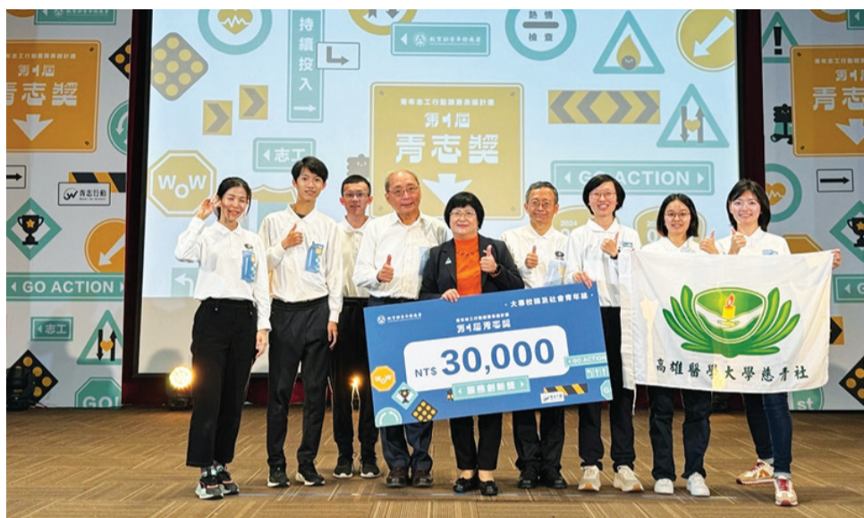
►高雄醫學大學慈青社組成的高雄青年醫療志工，首次參賽即獲得「服務創新獎」。