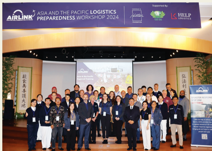
▲第二屆「亞太區非營利組織應對人道救援物流備災」工作坊，共計二十五個 NGO 交流學習。