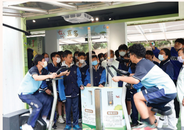
►「人力發電機」闖關遊戲，以腳踏車發電讓乒乓球上浮，學生猛力踩踏，乒乓球才緩緩上浮，切實感受到發一度電很不容易。