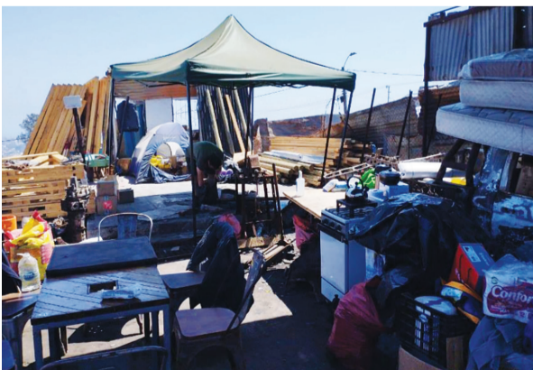
▲災民搭起簡易帳篷，留守在自己的土地上。

的肚子都能填飽。災區多數位於山坡地，災民告訴志工，火災發生時，緊急疏散的通道僅有兩道，導致逃難時出現出逃路線壅塞的困境。 倖存下來的災民告訴慈濟志工，罹難人數應該不只政府公布的一百三十一人。前市議員羅德里戈將派員協助慈濟志工進行造冊，希望能夠在第三階段的購物卡發放，實際幫助到有需要的災民。 (文：慈濟基金會)