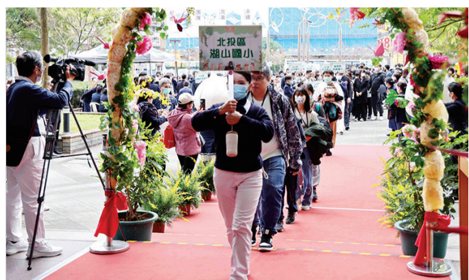
►臺北市參賽的八十五支小勇士團隊，在師長的陪同下一起開心走星光紅毯大道。

慈濟基金會劉效成副執行長代表主辦單位致詞，他說：「感恩所有貴賓、學校校長的支持，最重要的是參與競賽所有的選手，因為有你們的參與，所以我們才有勇士，讓環保從小在教育扎根，有這樣的帶動，相信整個臺灣的社會，一定能加速淨零排放。」 (文：吳珍香)