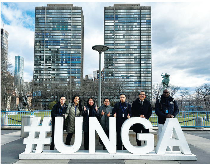
▲第六十八屆聯合國婦女大會，慈濟基金會代表團出席與會。

美國訊／第六十八屆聯合國婦女大會（Commission on the Status of Women）三月十一日至廿二日在美國紐約舉行。慈濟基金會自二〇一〇年起，正式成為聯合國經濟與社會理事會的非政府委員會成員，至今已連續十四年參與大會。今年代表基金會出席的成員總計二十三位，成員來自慈濟全球合作暨青年發展團隊成員、慈濟紐約志工、莫三比克志工及國際青年領袖培育計畫成員等。 本屆大會致力從制度與經濟面，改善全球婦女遭遇的貧窮及不平等待遇。大會期間，慈濟代表團將舉辦多場周邊會議分享慈濟經驗，並藉此為倡議女性權益及性別平等者提供交流平臺。此外，也設立女性手工藝品展示站，期盼藉多元管道，凝聚與會人士對婦女權益的重視。 慈濟莫三比克代表團也將透過平行會議，與聯合國婦女大會分享慈濟如何透過學校與大愛村的援建、教育援助，帶動當地婦女參與社區工作，提升經濟與各方面能力。代表團也將讓國際再次認識到慈濟現今的能量，緣起於五十八年前三十位家庭主婦日存五毛錢的一心善念。（文：黃靜恩、陳思育、褚于嘉）