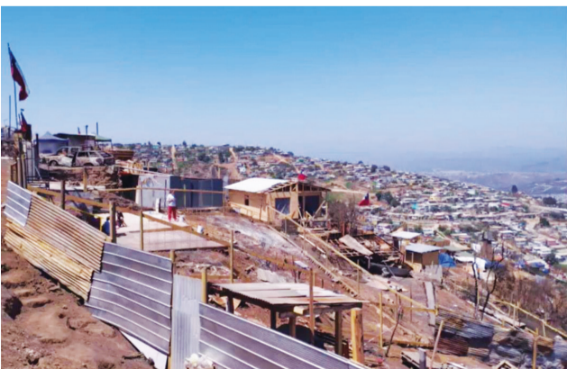
▲智利比納薩瑪是這次林火影響面積最大的區域。

智利訊／被稱為本世紀的第二大火——智利二月林火，造成目前部分南美國家仍持續高溫，智利民眾受災人數高達四萬多人，一百三十一人罹難，三百多人失蹤，以及數萬人無家可歸。慈濟志工分別在二月廿四日、廿六日，完成第一、二階段的糧食與購物卡發放後，三月四日，由智利前市議員羅德里戈 (Rodrigo Kopatic) 陪同，接續深入十個社區進行勘災，希望了解災民的需求，所到之處，災民處境讓人見了非常難過。 災民將領取到的物資，放在被燒毀的車子裡，因為家園已成灰燼，東西根本無處安置。用帆布、塑膠布，簡單搭起的帳篷，成了災民暫時窩居的處所。有些人聚集起來，共同煮食，大家一起共餐，希望用最少的資源，想辦法讓每一個人