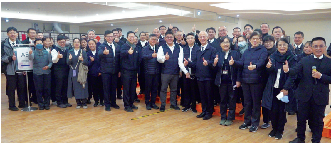
▲慈濟基金會與新竹物流公司共善分享急難物資倉儲管理經驗。