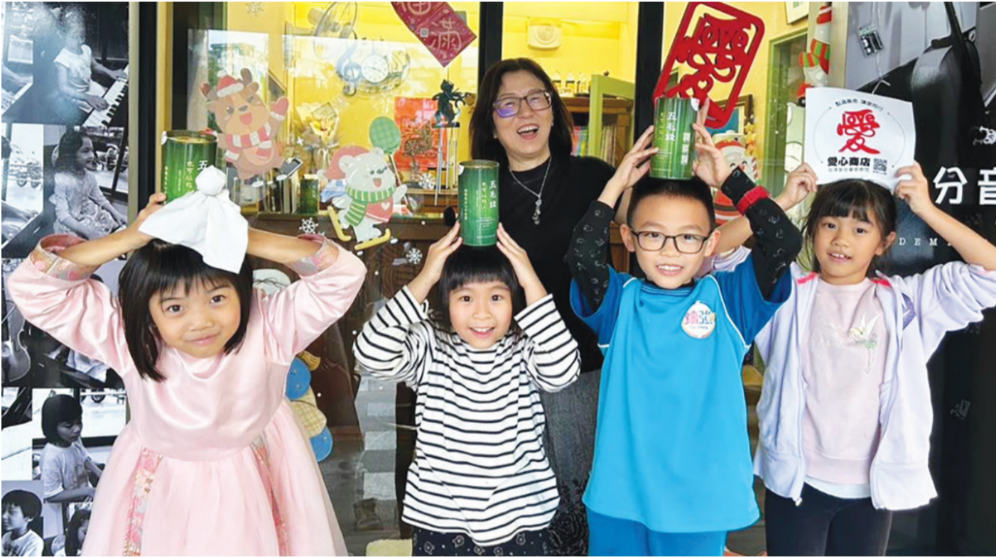
▲愛心竹筒是愛的匯聚，是歡喜善念的累積。