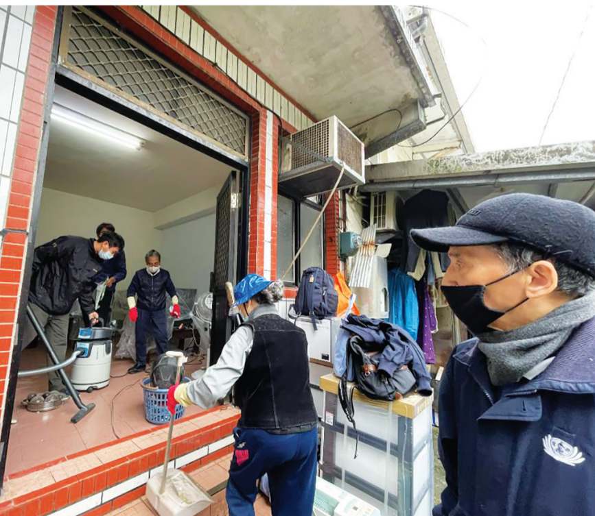
▲慈濟志工十多人為案家整理居住環境。

什麼都要買，就要多給一點生活費補助，先讓個案心安，才能真正幫助到對方。她提到上人很重視對單親家庭的照顧，因為要獨力扶養小孩很不容易，所以請大家要幫忙顧好。因此，每逢過年過節，或者寒暑假時，委員們就會幫單親個案家庭的孩子量身，為他們準備符合尺寸的衣褲。