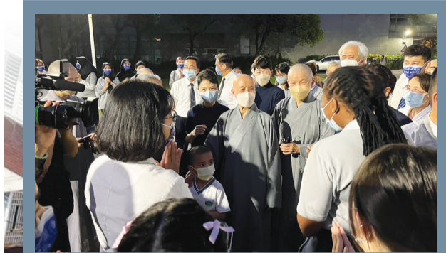
證嚴上人帶領精舍師父們，前往花蓮市災區關懷地震災情。