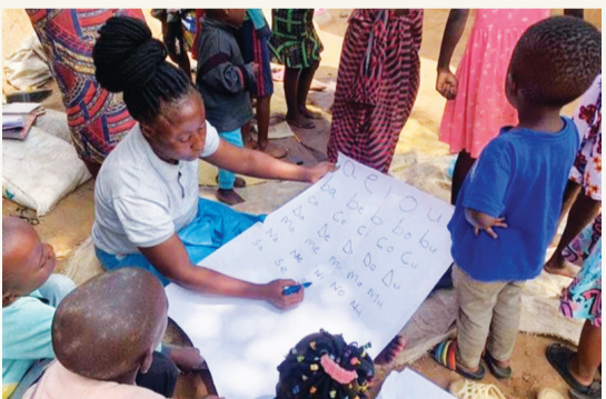
▲透過用心自製的大字報，社區志工媽媽教導週末幼兒園的孩子認字，甚至學習基礎天文，認識太陽系的八大行星。(圖：慈濟尚比亞志工)

►社區志工的巷弄成了孩子的學習遊樂場，當天小孩按照身高排隊入學的情形。(圖：慈濟尚比亞志工)