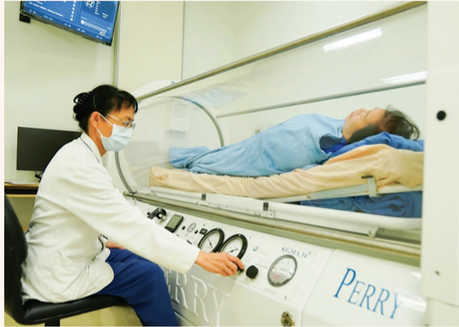
▶ 操船員執行單人艙高壓氧治療。

新北訊 / 五十八歲的劉女士患有三高，平時並未就醫追蹤，三個月前突然出現頭暈噁心，且左側身體偏癱、意識不清等情形。經電腦斷層檢查，發現為自發性腦溢血，會診神經外科後，建議採高壓氧治療，讓腦部損傷區域的腦細胞恢復作用，遂來到臺北慈濟醫院高壓氧中心張孟宗主任門診。經過單人高壓氧艙治療，並輔以復健治療後，劉女士偏癱症狀改善，意識也逐漸恢復清晰。