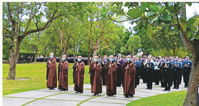
▲經行又稱為行禪，是一種以步行方式來修行止觀的方法。

德松法師認為「朝山」是一門內外兼修的功課，他並期望遠道回來精舍朝山的志工們，也同樣感受到心佛一境的法喜美好，將心靈與自然融合，感受內心的平靜與喜悅。（文：慈濟基金會）