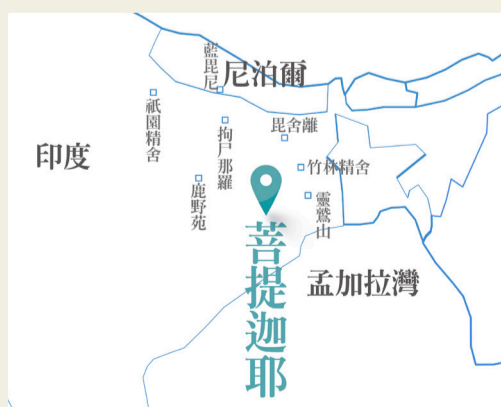
▲二千六百多年前佛陀在印度菩提迦耶，悟道成佛。

印度人口高達十四億，但由於數千年的種姓制度，約占總人口數百分之二十的貧困族群，高達四億人，貧困率更高達總人口的百分之六十。現今佛陀成道的菩提迦耶與兩千多年前的景象沒有什麼不同，苦難依舊。證嚴上人期待慈濟人以「弘法利生，回饋佛國」，透過醫療、教育、居住環境來改善當地生活，為佛國帶來轉變。（文：丁碧輝）