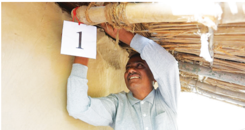
►賈格迪什布爾村的村長為拉胡納加爾村第一戶接受健檢的村民家，綁上慈濟門牌。