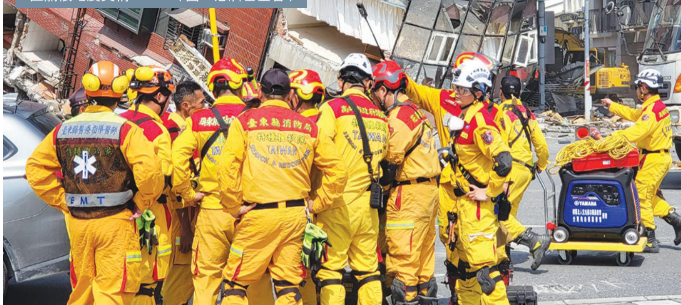
▲四月三日強震花蓮市大樓傾斜，救難人員搶救災民住戶。

花蓮訊 / 四月三日花蓮近海上午發生規模七·二地震，最大震度達六強，氣象署地震測報中心表示，這是台灣首次達六強的地震。 三日上午七時五十八分發生於花蓮縣政府南南東方二十五公里處芮氏規模七·二地震，全臺強烈有感。慈濟基金會花蓮本會在第一時間即成立「0403花蓮地震災害關懷與應變中心」，證嚴上人親自坐鎮，關懷各地回報的災情並指示災害相關應變機制。 各地慈濟志工也即刻啟動災害救援網絡，隨時彙整各地災情回報花蓮本會。花蓮慈濟醫院也立即啟動「中級急診紅色九號」應變機制。三日上午慈濟基金會已在花蓮德興棒球場內架置福慧床，提供民眾避難使用。各區也設立臨時服務中心，提供救援所需物資和人員關懷。當天餘震不斷，顧及志工們的安全，上人僅允靜思師父們進入不時搖晃的大寮為災民們烹煮熱食慰暖。 三日下午，證嚴上人在靜思精舍清修士林碧玉與慈濟基金會張濟舵、熊世民與何日生三位副執行長陪同下，前往花蓮市災區進行關懷。慈濟基金會指出，慈濟慈善事業基金會執行長顏博文，除於0403地震第一時間啟動慈濟災害應變機制外，對於0403地震後續關懷與需求問題，將持續透過慈濟的關懷機制，與中央及地方政府密切配合，希望能將此次震災所造成的影響，儘速降到最低。 （文：慈濟基金會）