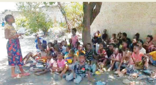
▲新志工憑著自己募來的玉米粉、油、菜、鍋子供餐，一百一十六位孩子享用後，歡喜坐在大樹下，聆聽「靜思語故事」。

窮弱勢的孩子一個未來。於是，她們一回到尚比亞，就馬不停蹄地到社區供食站，招募志工媽媽一起來開辦「週末幼兒園」。許多家長心想：本來就沒錢供應小孩就讀幼兒園，何不利用週末，讓孩子聚在一起兩小時共同學習？