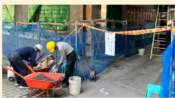
▲強震後，慈濟志工回靜思精舍進行修繕工程。志工說：「精舍就是自己的家，做好事要把握因緣，多做多得。」