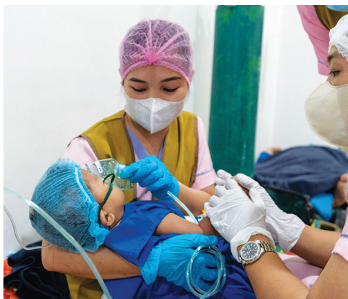
▲護士們細心照顧剛結束手術的孩子。