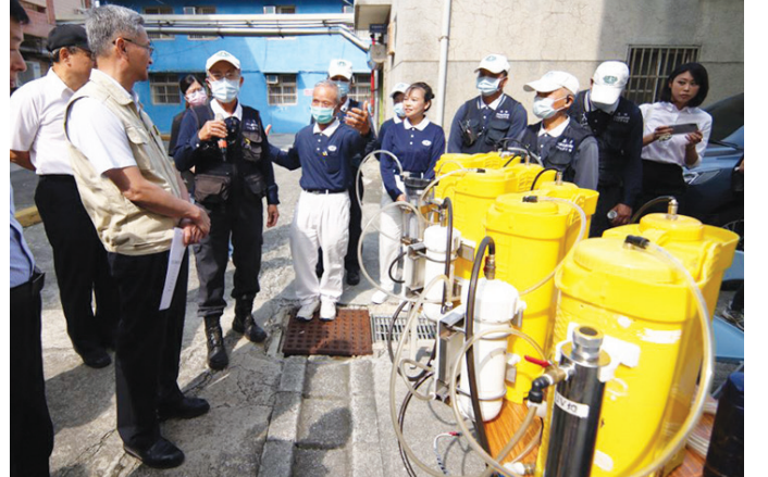
▲慈濟志工說明行動淨水器的功能。

桃園訊／四月十一日，桃園市竹圍漁港、竹圍國中舉行了一「桃園市一三三全民防衛動員暨災害防救（民安10號）演習」。桃園市政府消防局表示，本次演習以「戰爭災害」為演習主軸。模擬戰爭發生時，可能造成的各類災害情形，參與者包含慈濟基金會、行政院原子能委員會、海巡署、桃園市各防災編組單位、防災團體、國軍、外縣市消防局等超過十個單位團體一同演練。 演練的項目包含「災害搶救」、「民眾疏散」、「傷患救助」、「收容救濟站開設」等廿一項防救災工作。桃園區慈濟志工約四十人參加此次演習，慈濟基金會也在竹圍國中，實際使用阻燃隔屏、福慧桌椅床，以及淨斯食品等設置了特別照護區、家庭照護區；此外，慈濟急難救助隊也帶來行動淨水器，模擬災害發生時可即時提供乾淨的飲用水。 這次演習不僅是對災害應變能力的測試，更是展示了人與人之間的相互扶持及同理心。同時，演習活動對於提升社區的凝聚力與應對災害的準備具有重要意義。 （文：陳秀貴、洪瑞仁）