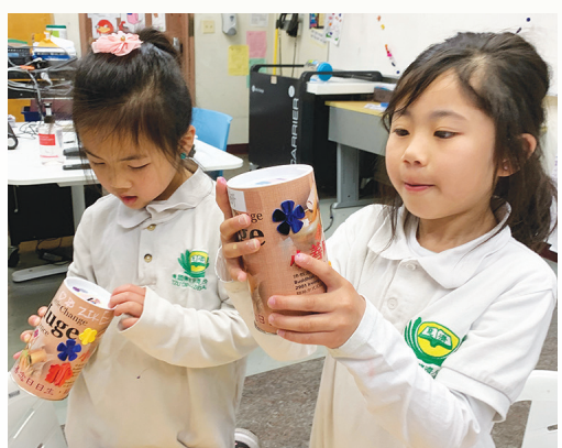
▶小朋友接過竹筒，回到座位後，拿起畫筆、貼紙，裝扮竹筒，為竹筒注入滿滿愛的能量。