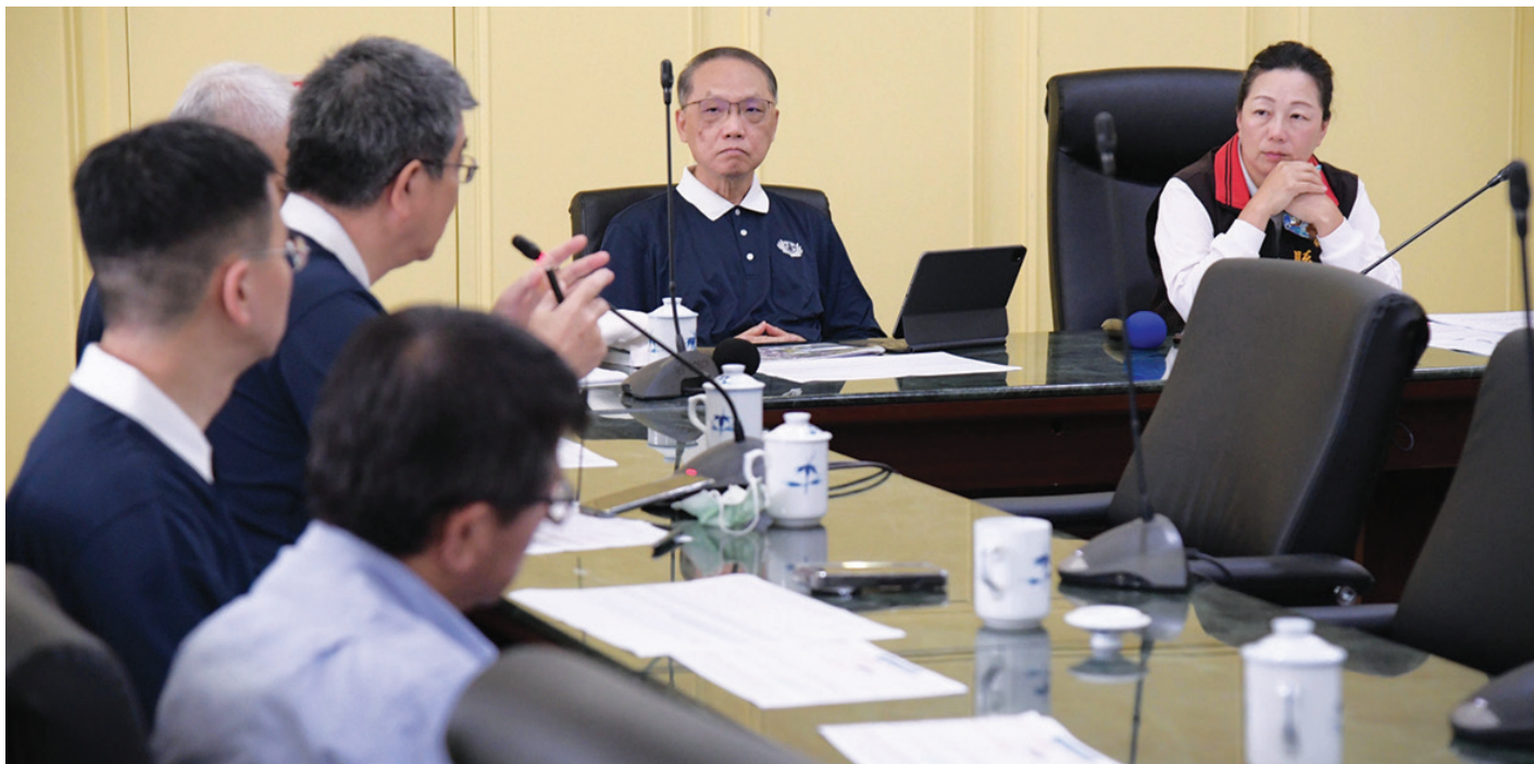
▲花蓮縣政府與慈濟基金會共同召開會議，研商為受災鄉親搭建中繼屋事宜。

慈濟 榮譽發行人——釋證嚴 發行人——顏博文 編輯——文史處 發行：佛教慈濟慈善事業基金會 地址：花蓮市中央路三段七〇三號