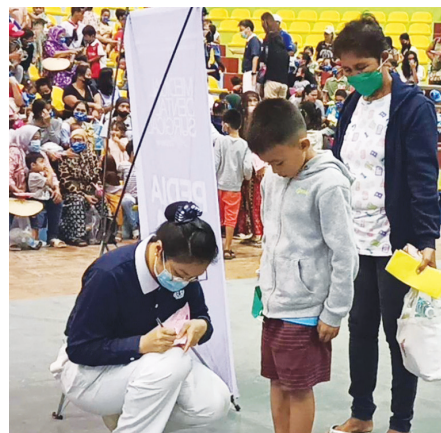
▲義診現場，志工們片刻不停地照料一切環節，眾人的努力讓義診順利圓滿。