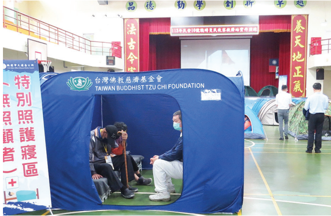
▲慈濟在演習活動中使用阻燃隔屏、福慧桌椅床等，設置收容場域。