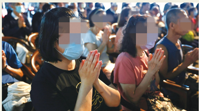
▲安心祈福會上，南機場居民虔心祈禱，祝願受災鄉親都能早日回歸生活。

臺北訊 / 臺北市南機場地區受到○四〇三花蓮強震影響，造成部分公寓式建築受損，居民第一時間被迫撤離，公寓經搶修補強結構後，居民已返家安居。四月十三日晚間，慈濟志工重回社區，搭起兩座帳棚，舉辦安心祈福會，並準備了兩百份祝福禮向居民與商家表達深切關懷。