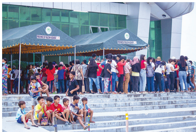
▲萬人體育館內展開兩天半義診，數千民眾前來就醫，圖中是排隊等候就診的民眾。