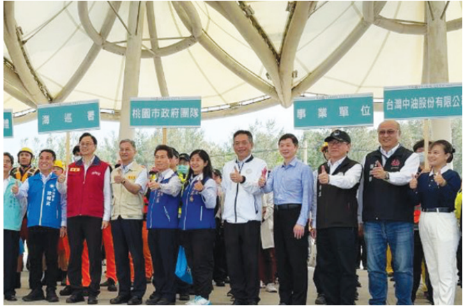
▲桃園市民安10號演習圓滿。