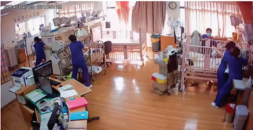
►地震發生時，花蓮慈濟醫院小兒加護病房的護理師不顧自身安危，第一時間衝向病床，穩住嬰兒。