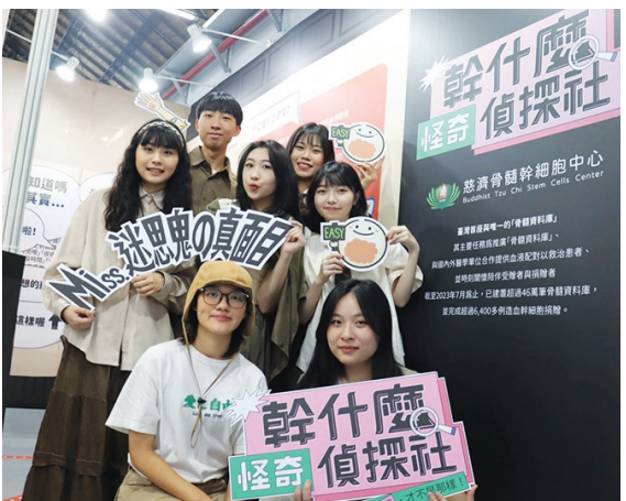
►輔大廣告系第廿七屆畢展，八位畢製小組學生，希望可以透過實際接觸群眾，破除人們對骨髓捐贈的迷思，傳達正確觀念。