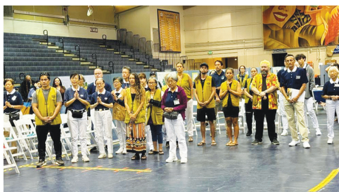
▲夏威夷慈濟志工為○四〇三花蓮強震受災鄉親祈禱募款。

安全岌岌可危，但當地志工對慈濟懷抱感恩之心，仍為臺灣受災鄉親祈禱並捐助了四百多美金。（文：慈濟基金會）