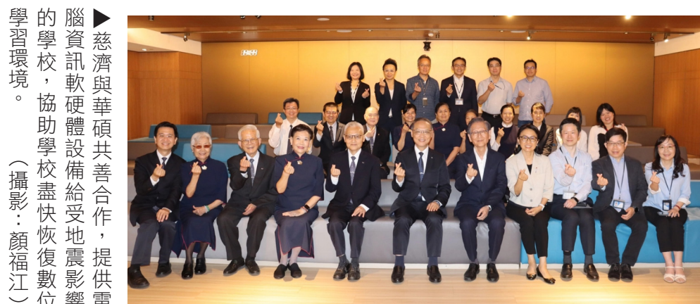
▲慈濟與華碩共善合作，提供電腦資訊軟體設備給受地震影響的學校，協助學校盡快恢復數位學習環境。

慈濟基金會與華碩共善合作，提供電腦資訊軟體設備給受地震影響的學校，協助學校盡快恢復數位學習環境。