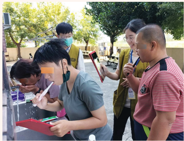
►大家一邊刷牙一邊照鏡子，把正確的刷牙方式學起來，然後重複練習，養成習慣。

高屏區慈濟人醫會與高雄青年醫療志工，三月卅一日首次前往該機構為住民們做口腔衛教活動。一早八點半不到，從遠處