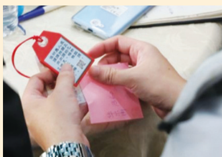
▲靜思語的話語安住了受災鄉親的心。