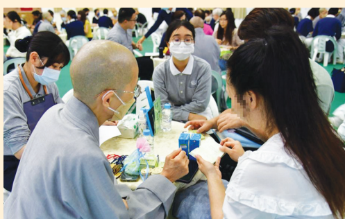
▲受災鄉親翻開《靜思語》，讀一句好話，心開意解，不安難過的心情平復不少。