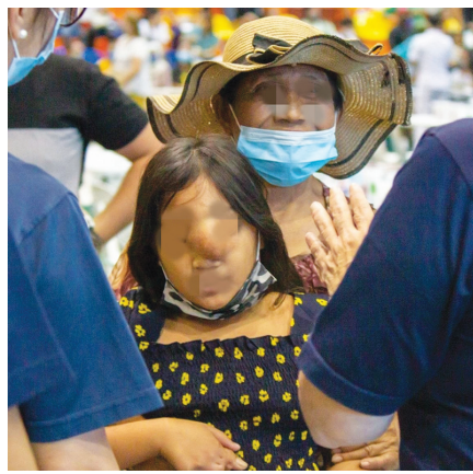
▲照片上的小女孩臉部中央有一顆大腫瘤，陪外婆到義診現場外賣米糕時，被志工看見，志工邀請女孩前來義診。