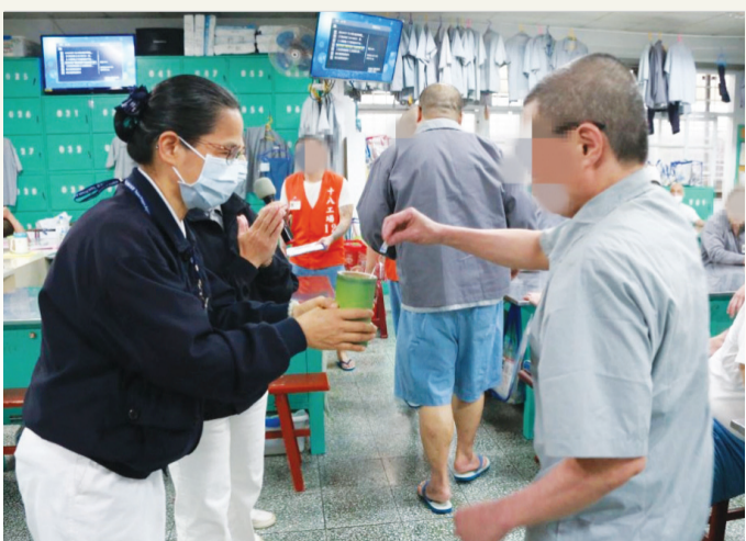
▶將郵票投入竹筒，受刑人祝福花蓮災鄉親早日重建家園。

一位來自越南的劉姓年輕受刑人，於監所服刑十年了，首次經歷大地震的他及另一位最年長的七十六歲受刑人，都表達對這次花蓮災情的不捨。共善不分身分，每位受刑人各自背負著不同的過去，然而這次花蓮災難，他們發揮愛心，以愛弭災，讓監所裡充滿濃濃正能量。 （文：李明霖）