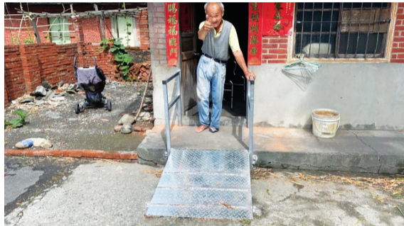
▲志工為林老先生製作完成鋼板坡道，老人家握著扶手，露出滿意的笑容，並比了一個「讚」。

彰化訊／四月廿三日清晨，六位慈濟志工相約來到彰化縣田尾鄉海豐村要為廿二戶長者家屋進行扶手、止滑地墊、照明燈具等施工作業。原本預計要花上兩個工作天，六位志工作展現螞蟻雄兵的精神，相互補位，僅用一個工作天，就完成了預定中廿二戶、七十九件的施作。