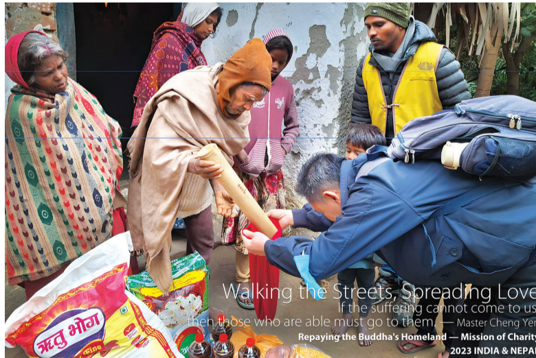
Walking the Streets, Spreading Love If the suffering cannot come to us then those who are able must go to them. — Master Cheng Yen Repaying the Buddha's Homeland — Mission of Charity 2023 INDIA & NEPAL

扶助的個案，造冊定期訪視，每月慈善日結合營養物資發放計畫，發放下個月的物資，讓貧困家庭不必擔心生活難以為繼。 跟隨慈善人文特展的主題設計，瀏覽佛陀行跡的八大聖地，穿越時空看懂二千五百多年前，悉達多太子從出生、離家、成道、傳法到涅槃的成佛之路。看慈濟人深入當地的生活，用真實精彩的圖文，以今證古，示現菩薩在人間的真實故事。