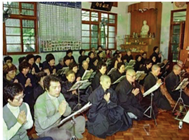
▲早期靜思精舍藥師法會。