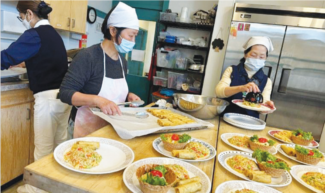
►加拿大高貴林(Coquitlam)區的中途學校多為流落街頭的青少年，這裡的學生缺乏物質，更缺乏愛，因此，志工備餐時格外用心，希望孩子們能感受到這份愛。

童的健康與學習狀況，展開「藍天助學計畫」，針對一些原住民、難民或者低收入家庭，到校提供孩童上學的愛心早餐。 七大工業國(美國、德國、英國、法國、日本、義大利、加拿大)組織中，加拿大是唯一沒有營養午餐的國家。為什麼呢？因為加拿大政府認為，針對孩子已有許多福利政策。可是根據二〇二三年多倫多大學的報告，小孩子空著肚子去上課的比例，小學生有百分之十三、中學生更達將近百分之三十，他們多來自難民家庭。 空著肚子去上課對孩子的學習、健康都有影響。於是從二〇〇七年開始，慈濟志工在本拿比推動愛心早餐，剛開始是溫莎小學(Windsor Elementary School)，後來陸續推展到石溪(Stoney Creek Community School)、阿姆斯特壯(Armstrong Elementary school)、史翠街、