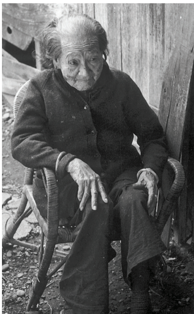
▲林曾老太太棲居花蓮市中華市場小巷裡，一間僅有三個榻榻米大的小屋，她是功德會第一位長期濟助的對象。