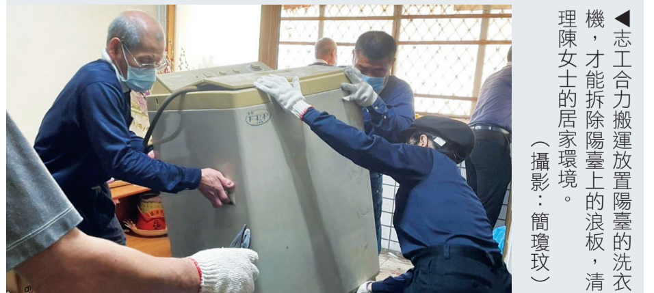
▲志工合力搬運放置陽臺的洗衣機，才能拆除陽臺上的浪板，清理陳女士的居家環境。