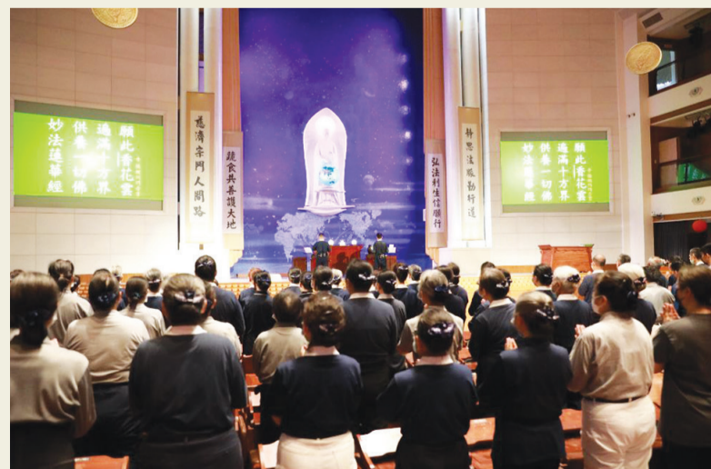
▲眾人到達朝山的終點講經堂，虔誠禮拜《藥師經》。