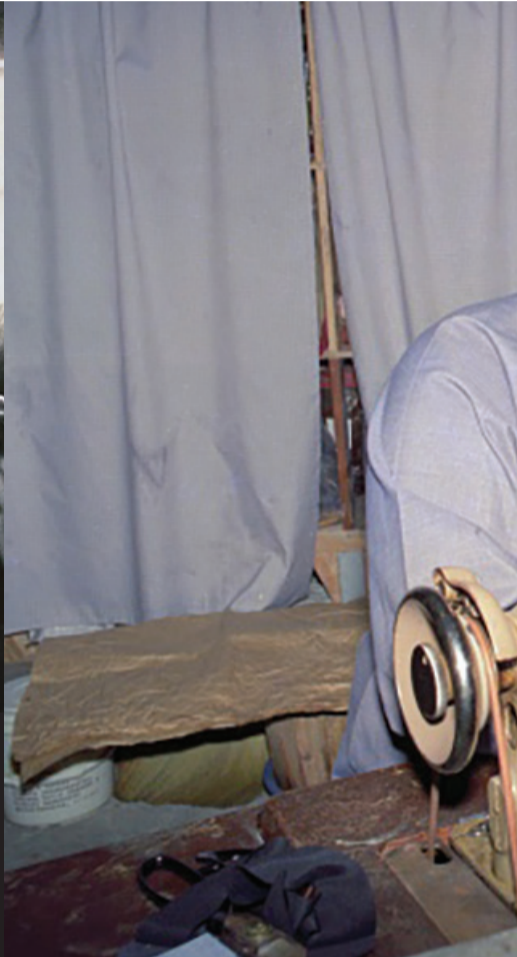
▶靜思精舍衣坊間，德仰師父縫製嬰兒鞋。