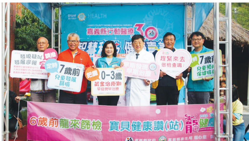
大林慈濟醫院自啟業起，即與嘉義縣政府衛生局合作複合式健康篩檢活動，深入十八鄉鎮，守護民眾的健康。