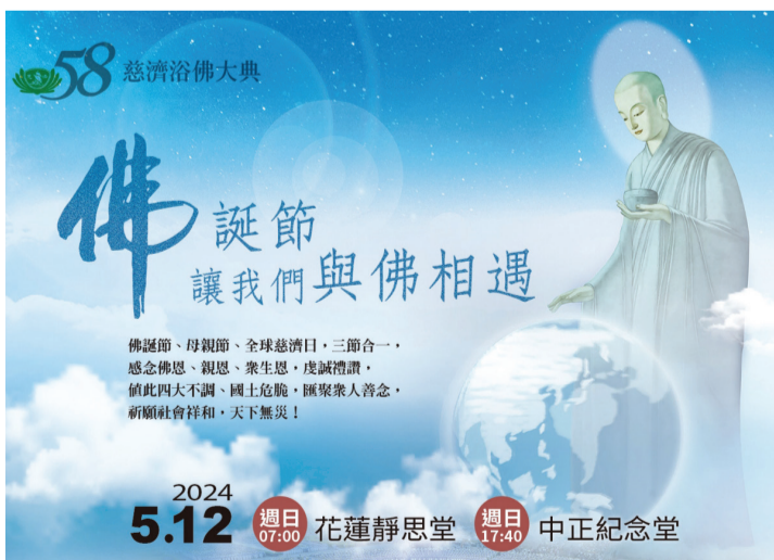
▲五月十二日慈濟浴佛大典歡迎民眾前往參加，共振善念上達天聽，祈願平安吉祥。

今年在花蓮靜思精舍、花蓮靜思堂、中正紀念堂，並設有佛陀足跡展，歡迎大家前來感受佛陀慈悲的人文之美。（文：慈濟基金會）