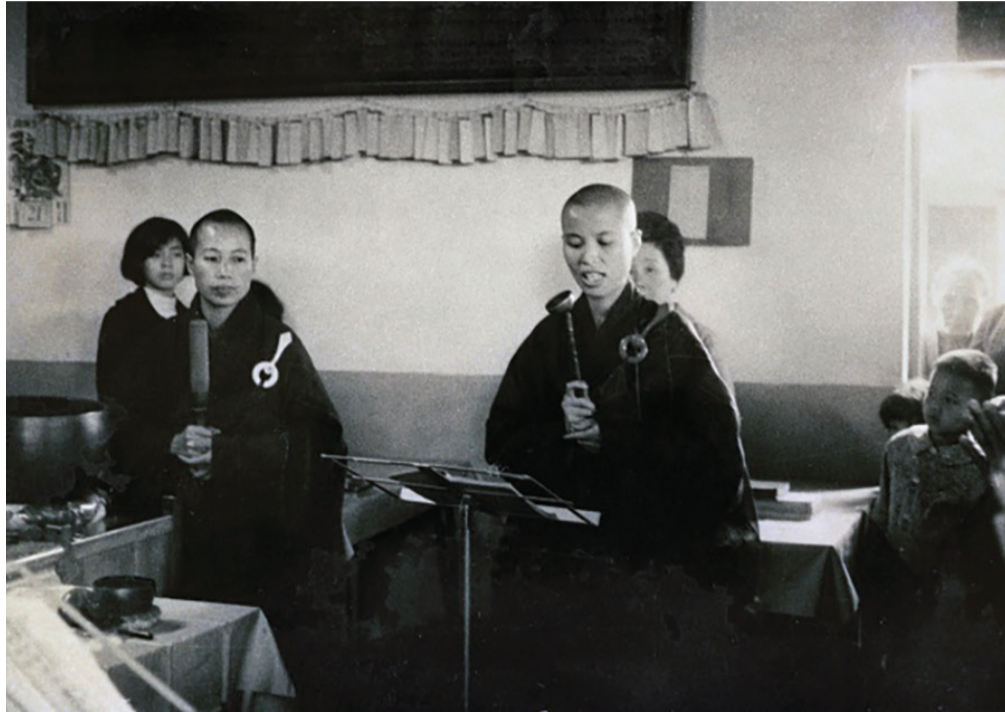
▲一九六六年，農曆閏三月廿四日「佛教克難慈濟功德會」在花蓮縣秀林鄉佳民村普明寺正式成立，證嚴上人親自上殿主持藥師法會。