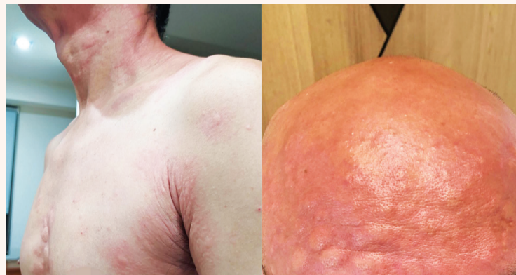
過敏水腫生在喉頭，會阻塞上呼吸道，甚至可能致命(左圖)。因食物過敏引發皮膚斑塊(右圖)。

皮膚長斑塊屬於輕症；嘴唇、眼皮腫，甚至眼睛都睜不開就屬於「血管性水腫」，如水腫在喉頭，會阻塞上呼吸道，甚至可能致命。更嚴重的是誤食過敏藥物或被蜜蜂叮咬引發「過敏性休克」，必須緊急送醫。通常接觸過敏原後兩個小時會開始有症狀，輕微過敏時可冰敷、多喝開水、多休息，一天或半天後能改善。一旦暈眩無力、呼吸困難，甚至腹痛、臉色蒼白冒冷汗，意味著已有危險症狀，就要趕緊就醫。(文：曾秀英)