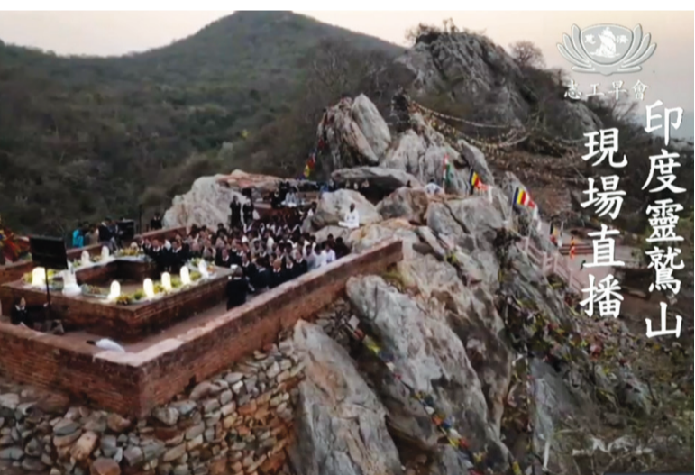
印度靈鷲山 現場直播