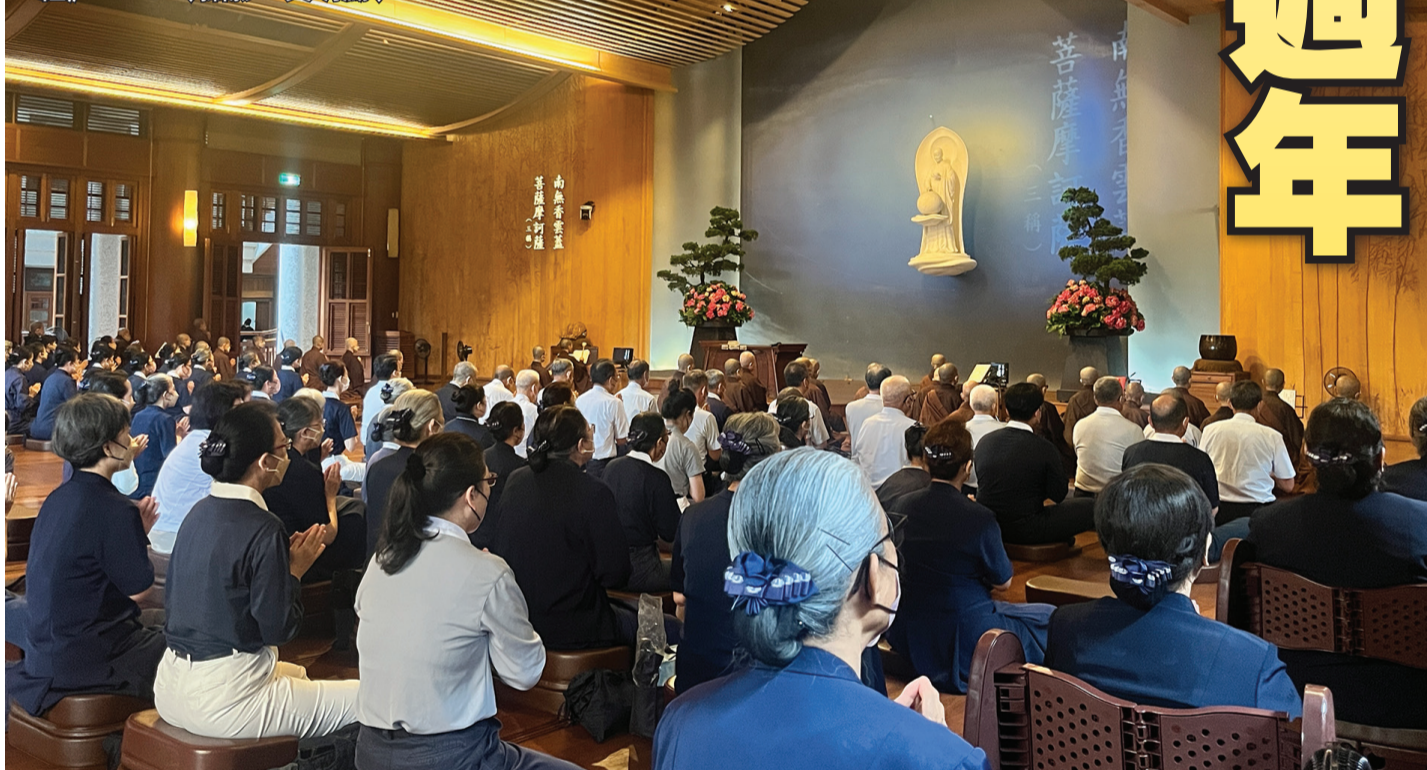
▼慈濟五十八週年，靜思精舍舉辦藥師法會奉誦《藥師經》。

回顧過往，雖然社會環境不斷變化，慈濟本著慈悲喜捨、拔苦予樂的初心始終未變。