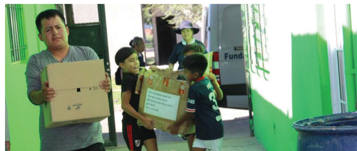
▲慈濟援助的物資送達，孩童也歡喜協助搬運。