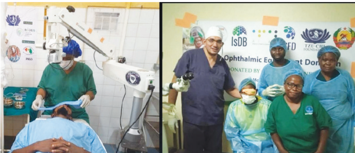
▲慈濟與伊斯蘭開發銀行合作共善，眼疾援助專案已展開白內障手術服務。