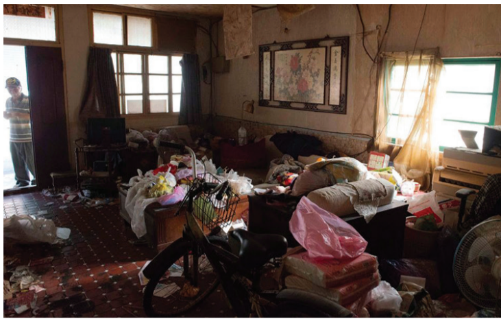
▲牆上「花開富貴」牡丹圖與眼下髒亂環境，形成強烈的對比。