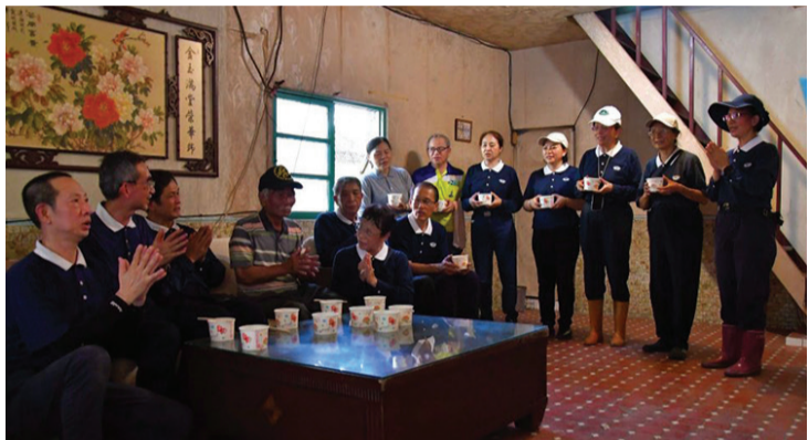
▲一樓環境清理後，空間寬敞明亮，復古式的紅磚地板也恢復原貌。