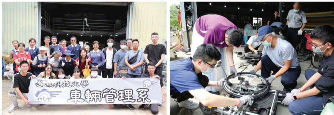
▲吳鳳科技大學的學生，參與環保輔具的維修與清洗。