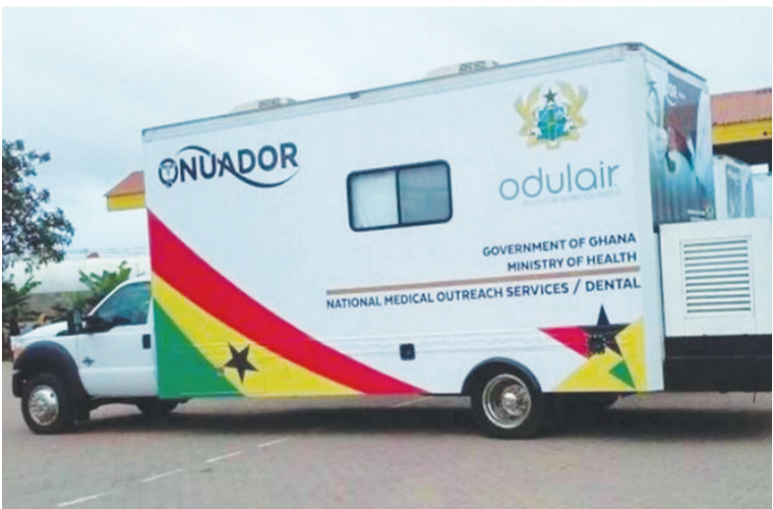
▲眼疾援助專案提供三部眼科診所行動醫療車為居民進行視力檢查服務。

本刊訊／研究報告顯示，隨著人類壽命的延長，全球的失明人口數估計在二〇五〇年達一億兩千五百萬人，其中以非洲地區最為嚴重。《刺絡針全球衛生》(The Lancet Global Health)期刊研究報告指出，視力問題多發生在年長者，但透過白內障手術治療失明問題，多數可以挽回。根據統計，非洲地區估計有四百八十萬人失明、一千六百六十萬人患有中度視力障礙。推測與非洲地區醫療資源有限、城市之外的區域少眼科服務相關。 二〇二三年四月，慈濟基金會與伊斯蘭開發銀行合作共善，啟動非洲眼疾援助專案並簽署合作備忘錄。現已擬定，將於近期為非洲吉布地、索馬利亞、莫三比克、布吉納法索、幾內亞、馬利等六個國家，提供十九套白內障手術設備。布吉地、索馬利亞和幾內亞，為慈濟新增的慈善援助國家。 目前援助專案已在莫三比克與幾內亞展開白內障手術服務，估計將有一萬四千人接受手術服務。後續也將有三部眼科診所行動醫療車前往幾內亞、吉布地及索馬利亞，為當地居民進行驗光等相關視力的檢查。(文：慈濟基金會)