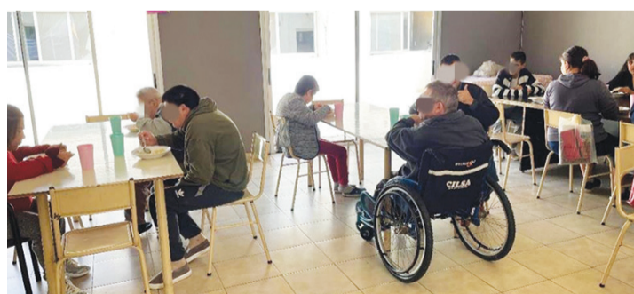
▲阿根廷高通膨讓社福機構在基本生活物資的採買也面臨沉重壓力。

阿根廷訊／根據阿根廷國家統計局數據顯示，今年三月通膨已達百分之二百八十八，物價不斷上揚。已有百分之五十七人生活在貧窮線以下。 慈濟阿根廷志工每月定期前往關懷的身心障礙收容所(Los Logros)，也因高通膨而面臨民生物資支出的經濟壓力，目前除了慈濟，其他捐贈單位都已停止物資援助。慈濟因應收容所提出的物資需求，提供米糧、麵條、油、糖、乾酪、番茄醬、漂白水、洗衣粉等基本生活物資。 慈濟阿根廷志工也為協助兒童課輔的民間社團「太陽與綠色」，增援一倍的生活物資，而為部分社區學童提供的文具發放也沒有中斷。(文：慈濟基金會)