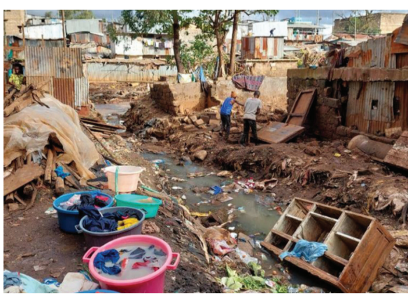
▲肯亞至今積水未退，被沖毀的家園，居民仍抱著希望，想尋找一點可用的物品。