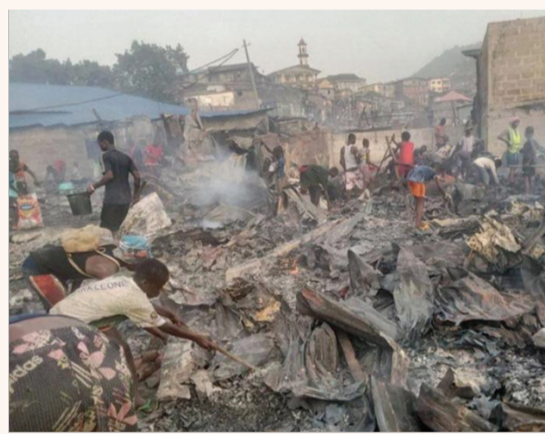
▲獅子山共和國首都自由城蘇珊灣貧民區大火，圖為居民在餘燼中翻找還可堪用的家當。

總協調工作，並先行前往勘災，了解災民需求。慈濟將提供已存放在獅子山共和國的米糧一千四百一十五包，每包十公斤，由蘭頤基金會與明愛會人員進行烹煮，自五月十三日起展開為期十四天、每天一餐的熱食供應。 獅子山共和國是全世界最貧窮的國家之一，這些熱食供應對災民而言，相當迫切，供應期間也將為居民進行火災防災教育。(文：慈濟基金會)