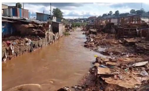
▲肯亞洪害首當其衝殃及河岸貧民區，沿河而居的房舍幾乎全數被沖毀。