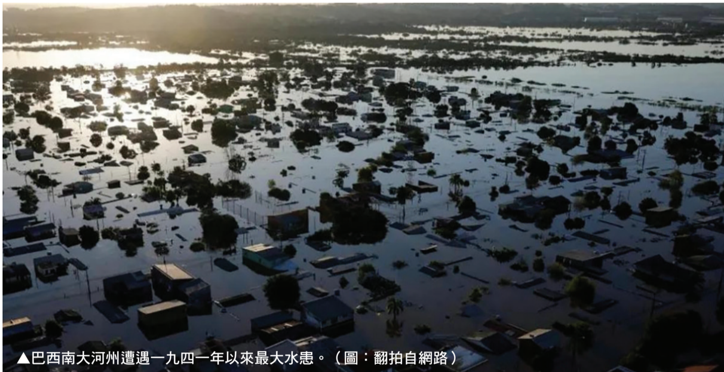
▲巴西南大河州遭遇一九四一年以來最大水患。