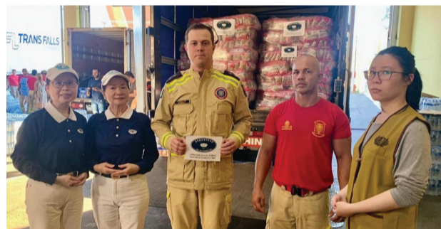
▲由於災區目前無法進入，志工將八千五百公斤的食糧委請巴西巴拿那州第九消防隊帶入災區。