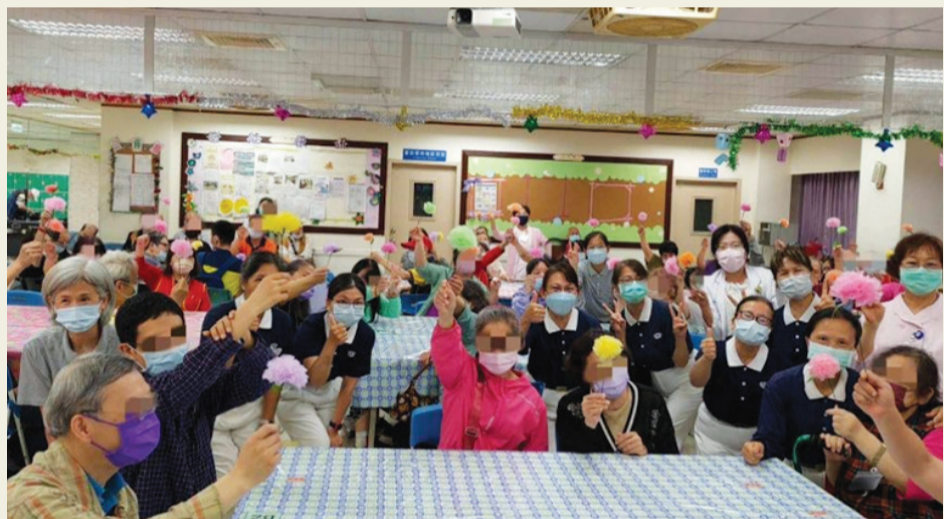
▲病友手上的康乃馨滿足了自信，也表達了對母親的祝福。