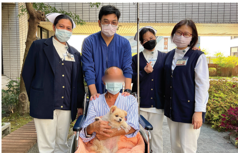
►「阿吉」是陳先生唯一的親人，也是生活下去的最大動力，所以聽到要住院，才會這麼抗拒；「根本沒想到醫院（醫護人員）會幫我照顧阿吉，真的非常感謝！」

心中的大石頭落地，陳先生更加積極配合治療，雖然化療的過程令他很不舒服，但只要一想到阿吉，就能產生無限勇氣。病況趨於穩定的陳先生在醫療團隊的安排下，與他唯一的家人阿吉相聚，醫療團隊也送上祝福和鼓勵，期待陳先生早日康復！（文：花蓮慈濟醫院）