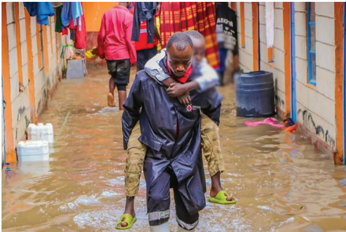
▲五月十四日、廿一日肯亞再度面臨兩波持續降雨威脅，肯亞紅十字會已進行多次救援行動。