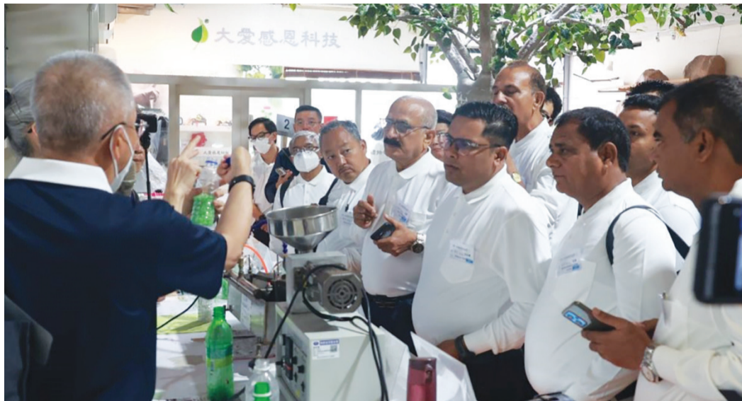
海外學員們參訪的第一站為慈濟內湖園區，在環保一條龍區，志工詳細解說寶特瓶如何從回收，到再製為環保紗線，最後製成慈濟國際賑災用的毛毯和環保衣物。