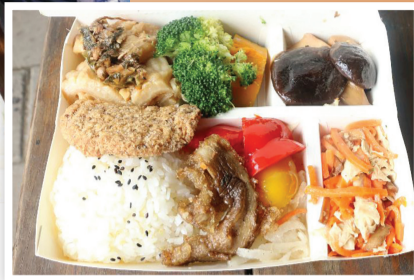
慈濟嘉義太保共修處第一次製作素食便當推廣素食，希望更多人選擇素食，共同為健康和環保盡一分心力。