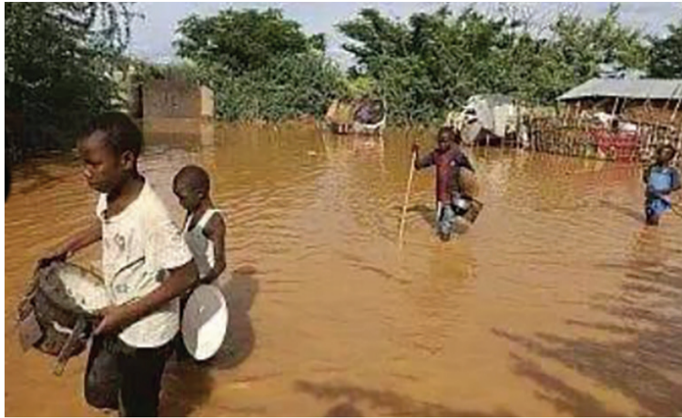
▲慈濟基金會第一波援助發放區域寬札，當地住民的泥土屋多數已在暴雨中被沖毀。