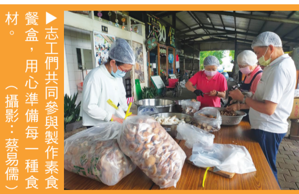
志工們共同參與製作素食餐盒，用心準備每一種食材。

曾聽證嚴上人開示說到，製作五百個葷食便當，會吃掉一隻大豬及三十八隻雞；如果是素食的便當，大豬和三十八隻雞就能得救。志工們將素食餐盒送到各單位行號時，還會附上農糧署的勸素小卡，宣導素食的重要性。 約十一點半，志工們順利將四百個素食便當發送完畢，太保共修處首次製作素食便當活動成功落幕。眾人充滿信心地迎接下一次的素食餐盒推廣活動。 (文：張小娟)