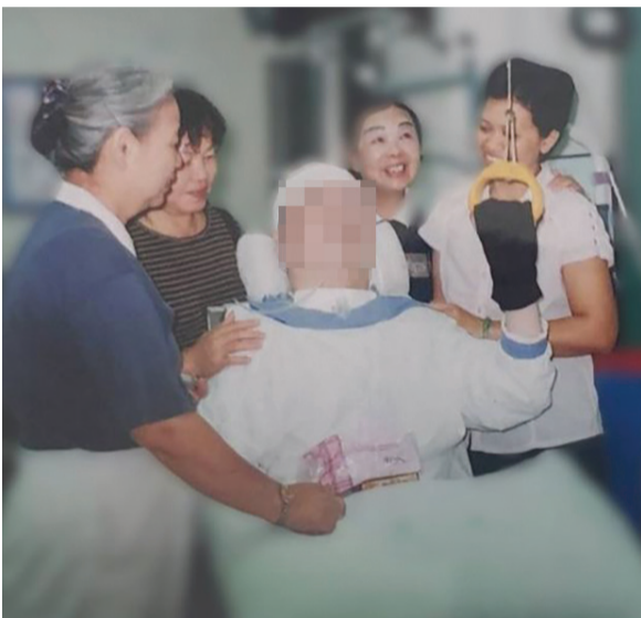
▲志工關懷受傷員警與家屬，一旁的家屬也露出久違的笑容。