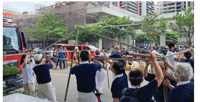
▲志工趕在下雨前於救難現場搭棚架。