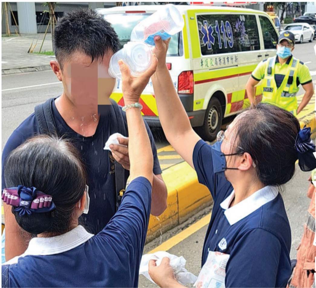
▲志工為撤離的住戶清理臉上的髒污。