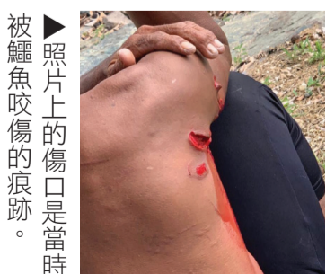
▶照片上的傷口是當時被鱷魚咬傷的痕跡。