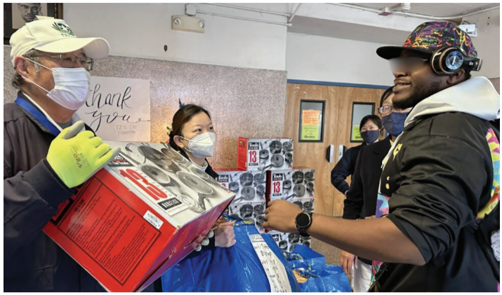
►二〇一三年，舊金山慈濟志工為弱勢家庭的家長，送上滿載關愛的聖誕禮物。