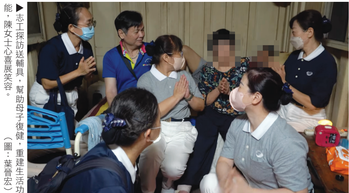
▶志工探訪送輔具，幫助母子復健，重建生活功能，陳女士心喜展笑容。