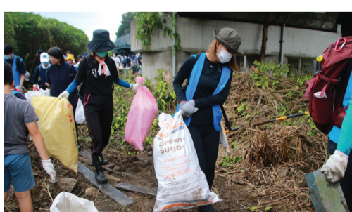
▲淡水河口紅樹林泥濘地攔下許多垃圾，汙染了水筆仔、彈塗魚、招潮蟹等棲息的空間。