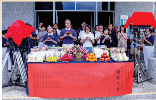
大愛劇《生命的麥田》導演、製作人、演員劇組們在臺東靜思堂開鏡儀式。