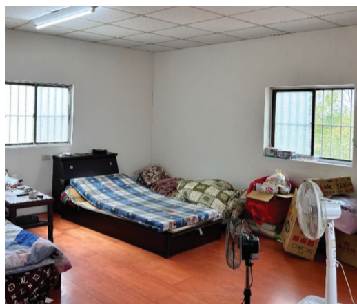
▲李姓兄弟倆住所翻修前（右）後（左）樣貌。