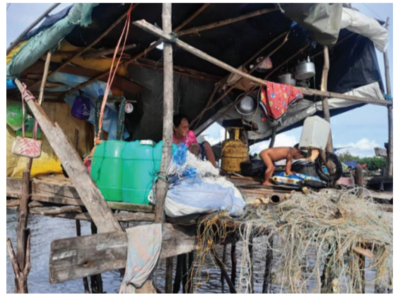
▲無國籍村民撿拾垃圾維生。