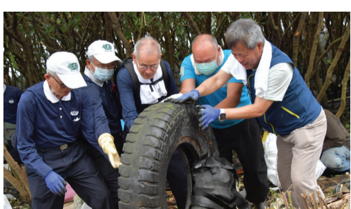
▲眾人齊心合力搬運大型廢棄物，要還給地球一個清淨大地的環境。