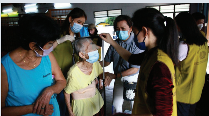
▲義診列車開往郊區小鎮，讓當地民眾可以就近接受醫療服務。