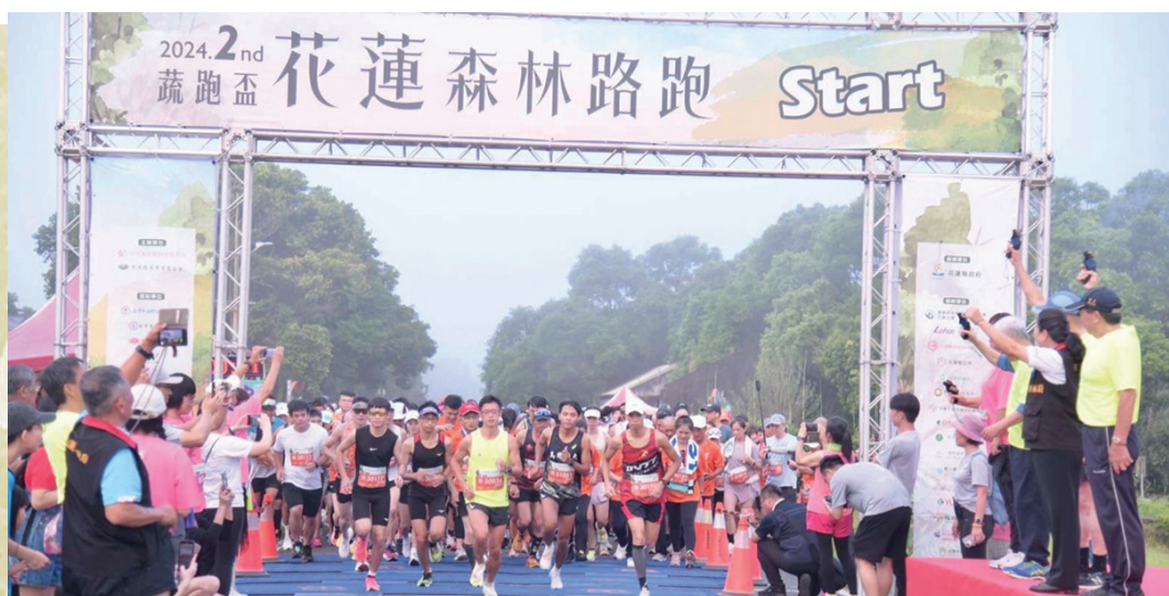
▲第二屆「蔬跑盃」，六月卅日上午五點半，於光復鄉大農大富森林正式開跑。

新冠疫情援助後續，慈濟在新竹縣、雲林縣展開「弱勢學生家庭暑期營養紓困計畫」，致送安心生活箱、健康蔬果箱及白米，與當地政府攜手關懷弱勢學童家庭。