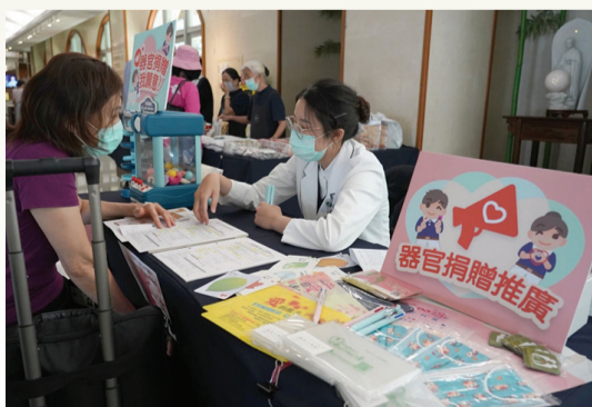
▲臺中慈院器官捐贈宣導週，於醫院大廳設置服務站，提供相關諮詢與簽署服務。