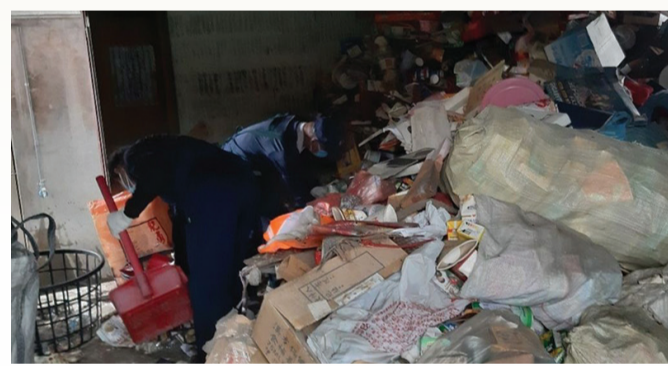
▲志工們利用三天的時間，動員六十人次，清掃室內外環境，讓阿志有個乾淨的住家環境能夠安心休養。

志工了解一家人所面臨的經濟困境，決定先予急難補助，再尋求其他社會資源一起來幫助這戶人家，志工也安慰阿志太太：「祝福先生早日康復，照顧先生，妳辛苦了。自己要多保重，我們會持續來關懷。」（文：詹大為、江豐作）