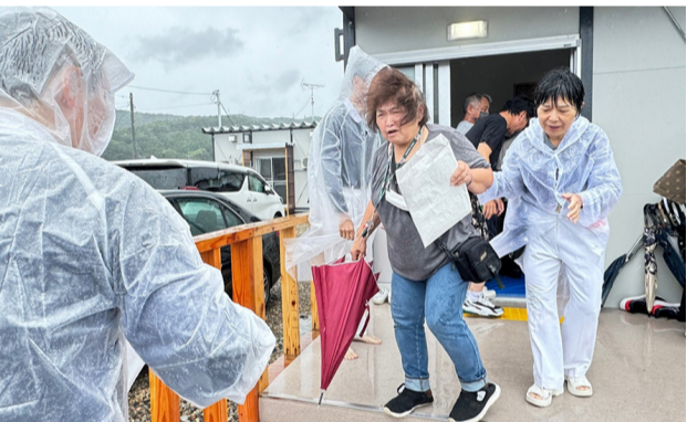
▲志工們在會場外確保每位鄉親的安全（圖左），室內志工彎身擦拭從戶外帶進來的雨水，避免鄉親不慎踩滑（圖右）。（攝影：吳惠珍）