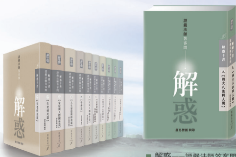
■ 解惑——證嚴法師答客問（九） 【四大八法利人間】 定價：480元

《解惑》第九冊〈四大八法利人間〉，看證嚴上人如何應社會所需發展出四大八法，又如何運用「戒」與「愛」，讓慈濟從一間小木屋拓展而出，走入國際，在娑婆世界中，化作一面無邊的菩薩網，回收無數感恩的故事。