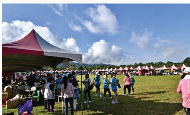
▲在日地月池的大草坪上的「綠活市集」，主辦單位邀集花蓮在地超過六十間店家設攤。(攝影：柏傳琦)

碳飲食與蔬食的重要性。自上午七點到中午十二點止，在日地月池的大草坪上，舉辦了一場「綠活市集」，邀集花蓮在地超過六十間店家設攤。市集以低碳蔬食為主題，讓民眾透過不同食材及料理方式，品嚐蔬食的鮮美。隨著近年來淨零排放議題，備受全球矚目，這場市集也吸引不少民眾前來，藉由蔬食市集支持無肉經濟，並為健康、環保、永續的地球，盡一分心力。 (圖／文：慈濟基金會)