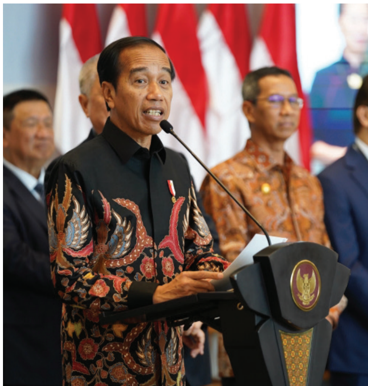
▲二〇二三年六月十四日，印尼慈濟醫院補辦正式啟用典禮，印尼總統佐科威出席典禮致詞。