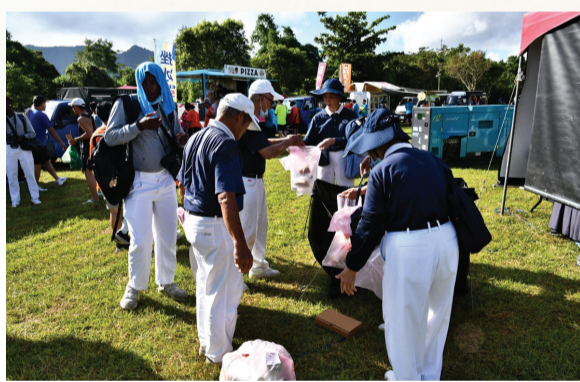
▲慈濟志工不僅推素，還在現場宣導環保、做環保。