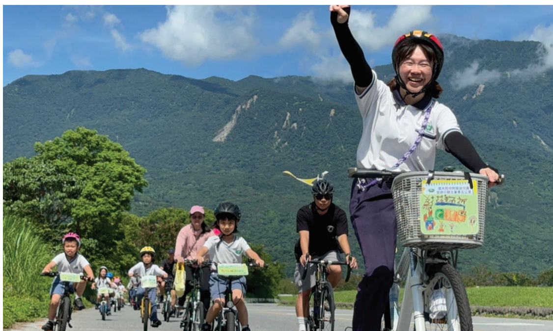
▲慈大附幼舉辦小騎士挑戰賽，讓孩子與家長共同騎乘腳踏車挑戰五公里路程，在畢業前累積孩子帶得走的能力。

「樂。斯屬」始終相信，教育，是社會永續的關鍵，唯有賦能偏鄉學童，才能由他們在家鄉創造改變。