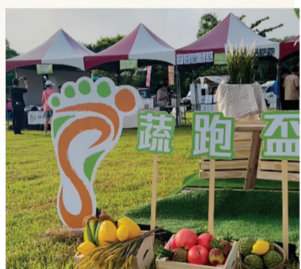
▲「蔬跑盃」結合路跑與蔬食市集，推廣低碳飲食與蔬食。