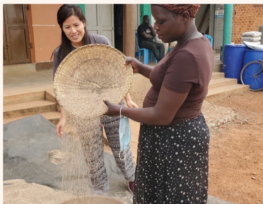
▲「愛女孩」在烏干達透過農業培訓提升婦女地位，並且讓食物短缺及教育問題得以改善。

本刊訊／東非人口雖佔全非洲不到百分之廿五，但挨餓的飢民卻佔全非洲百分之五十以上，許多家庭都在為食物而擔憂。為了改善此困境，愛女孩團隊透過參與慈濟基金會「E2」大視野想向未來」青年創新推動計畫，成功在烏干達偏鄉地區推動農村培力，建構偏鄉合作社農場機制、推動自然農法，鼓勵婦女種植多樣的作物，並教導如何使用自製肥料來提升當地作物產量，從而解決糧食安全問題。