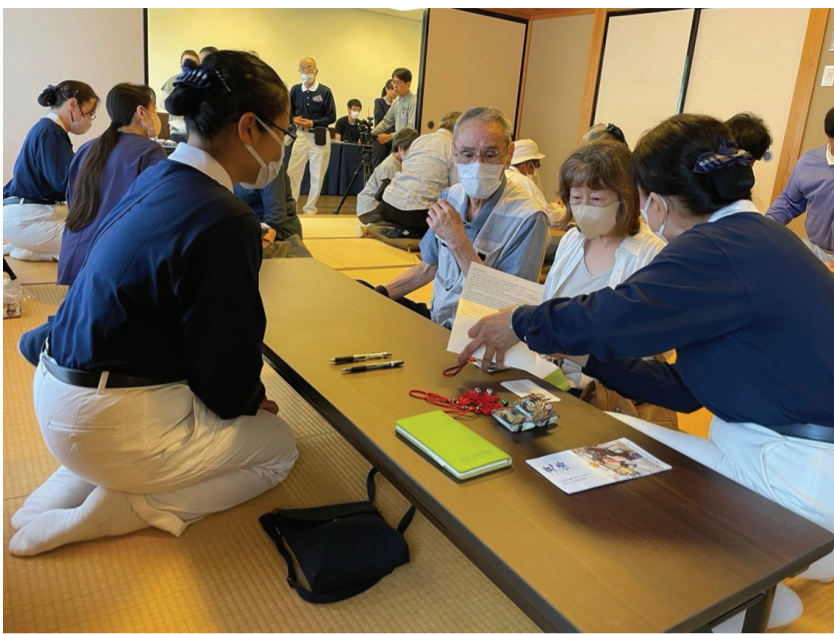
▲慈濟日本分會費心思尋覓發放場地，讓前來領取見舞金的鄉親能感受到進到家裡般的溫暖。這是七月十六日進行穴水町二次發放場地穴水町さわやか交流館ブルト。