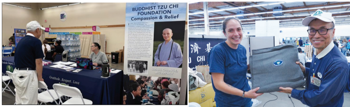
▲慈濟志工進駐地方救助中心設站(左圖), 收到毛毯與現值卡的災民露出欣慰笑容。

美國訊/極端氣候正為全球帶來致命性災難。 美國七月底, 一週內發生上百起嚴重山火, 部分地區炎熱乾燥, 儘管出動數千人力, 火勢仍難受控制。七月廿四日, 一名男子將一輛燃燒中的汽車推入路邊深溝, 從而引發爆炸性增長的「北加州公園山火」。 「公園山火」肆虐北加州哈瑪縣(Tehama County)和布特縣(Butte County), 由於山火發生地點地形崎嶇, 增加救援困難度, 儘管加州森林防火廳出動近四千人, 動用十六架飛機進行滅火, 也只控制了百分之三十六。