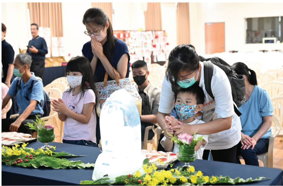
▲臺中慈濟心田聯絡處許多家長帶孩子來參加吉祥月祈福活動。