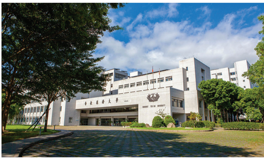
二〇二四年八月一日，慈濟大學與慈濟科技大學正式合併。

改名為「慈濟科技大學」。二〇〇三年，首次提出合併想法後，歷經廿多年，終於完成二校合併。 合併後的慈濟大學不但融合技職與高教的優勢，更打破傳統技職和高教分軌的學習界線，並於各學院融入「科技專業課程，追求卓越創新。同時連結在地與國際資源，為社會培育兼具頂尖專業與「尊重生命、以人為本」的優秀人才。 （圖／文：慈濟大學）