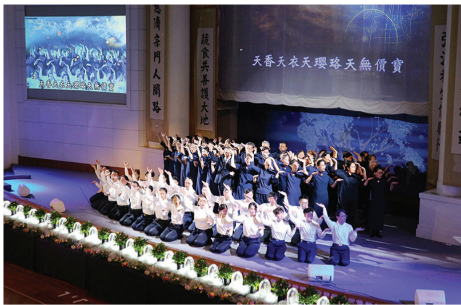
▲桃園靜思堂祈福會上展演經藏演繹。