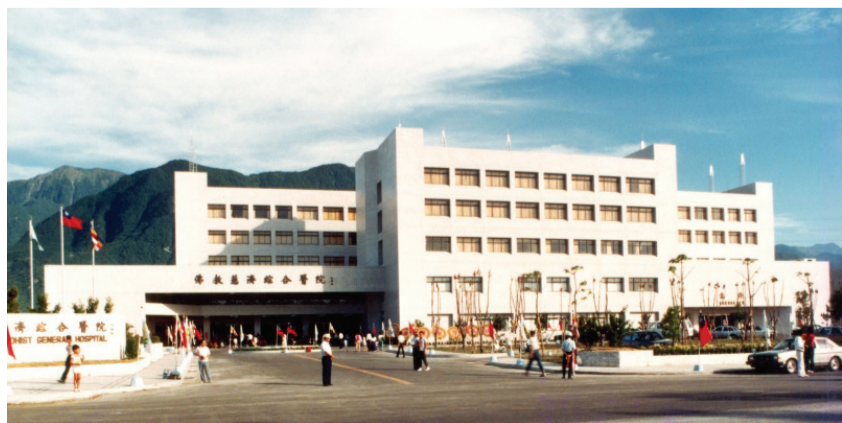
▲花蓮慈濟醫院啟業期間的外觀。