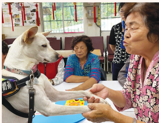
▲一位奶奶正扶著心輔犬奶茶表達愛意。心輔犬曾經是流浪狗，現在成為自閉、過動、身障者的專業心輔教育犬。

慈濟基金會透過「FCZ大視野 想向未來」計畫，積極支持團隊的活動和培訓，舉辦了全臺巡迴的心輔犬講座與遊戲互動工作坊，這些活動不僅宣揚心輔犬的