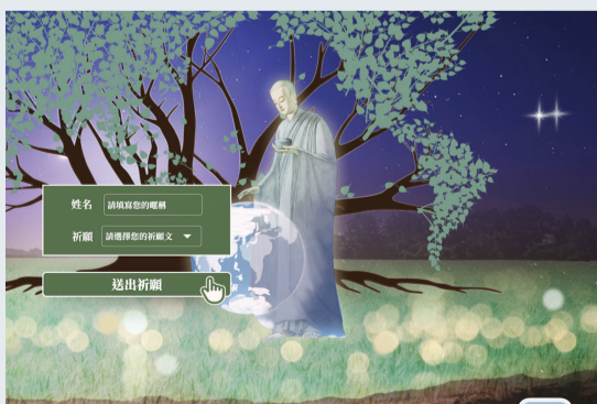
▲七月吉祥月慈濟線上祈福網站呈現寧靜視覺美。