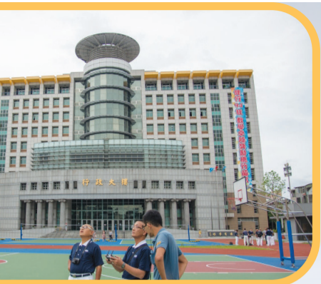
▲慈濟與健行科大合辦「勘災空拍訓練課程」，助教在旁指導志工空拍機操作。