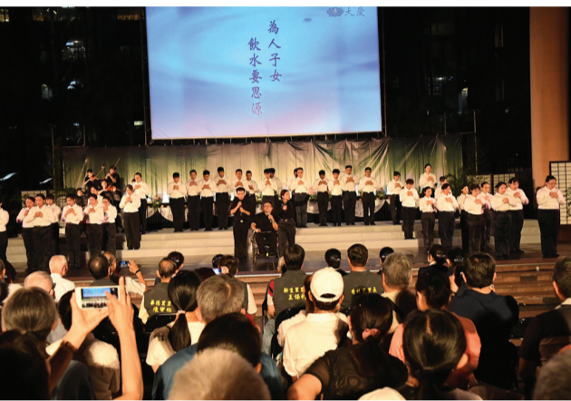
▲農曆七月是孝親月、吉祥月，臺上為慈濟青年志工演繹《父母恩重難報經》。

祈福會在慈濟板橋靜思鼓隊的隆隆鼓聲中開啟序幕，莊嚴的攝受力凝聚現場民眾的虔誠心念，許多人攜家帶眷前來祈願平安。 劉副市長上臺致詞，感謝慈濟帶給人一股心定的宗教力量，更為社會扮演穩定人心的角色。他鼓勵大家學習慈濟人慈悲為懷、濟世救人的精神，珍惜土地、愛