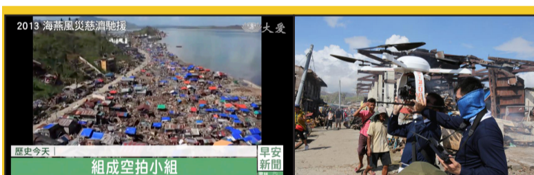
▲二〇一三年海燕颱風重創菲律賓，大愛臺與剛鈺公司合作在重災區萊特省獨魯萬市災區勘災攝影，留下災區紀錄。

本刊訊／慈濟基金會與齊柏林基金會攜手合辦「2024齊柏林飛閱臺灣攝影獎」活動，於八月正式啟動，廣邀全臺灣攝影愛好者共襄盛舉。慈濟基金會運用空拍技術，最早可回溯到花蓮慈濟醫院啟用後，由慈濟志