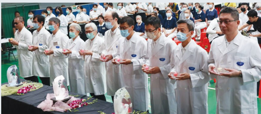
▲義診開始之前，醫療團隊率先禮敬諸佛，也啟動現場的祈福活動。