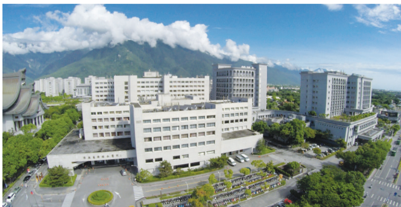
▲花蓮慈濟醫院近期的景觀。