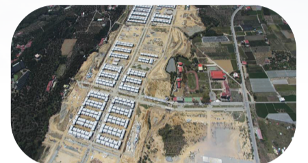
▲志工以遙控飛機吊掛相機，鳥瞰拍攝高雄杉林慈濟大愛園區援建工地。

本刊訊／慈濟基金會與齊柏林基金會攜手合辦「2024齊柏林飛閱臺灣攝影獎」活動，於八月正式啟動，廣邀全臺灣攝影愛好者共襄盛舉。慈濟基金會運用空拍技術，最早可回溯到花蓮慈濟醫院啟用後，由慈濟志