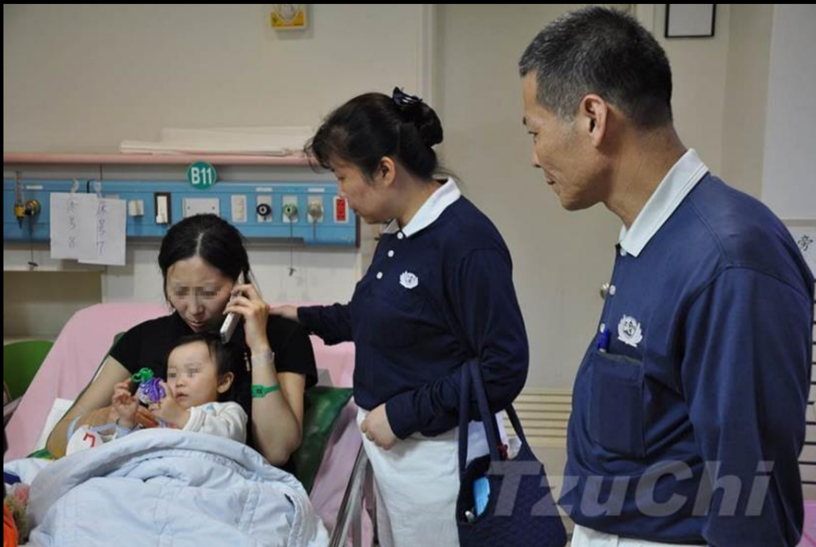
地點：嘉義市榮民醫院