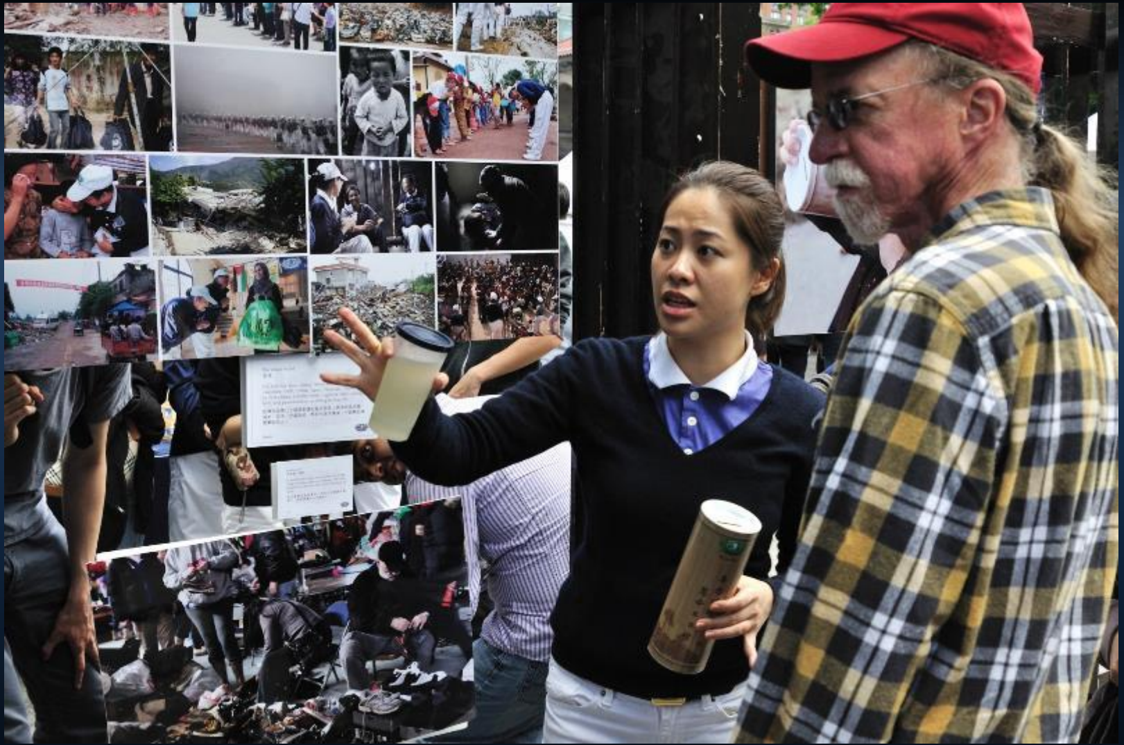
美國紐約「台灣巡禮」活動，照片展，慈青為民眾導覽介紹慈濟愛的足跡。 2013/05/26 地點：美國紐約州紐約市(New York)曼哈頓(Manhattan)