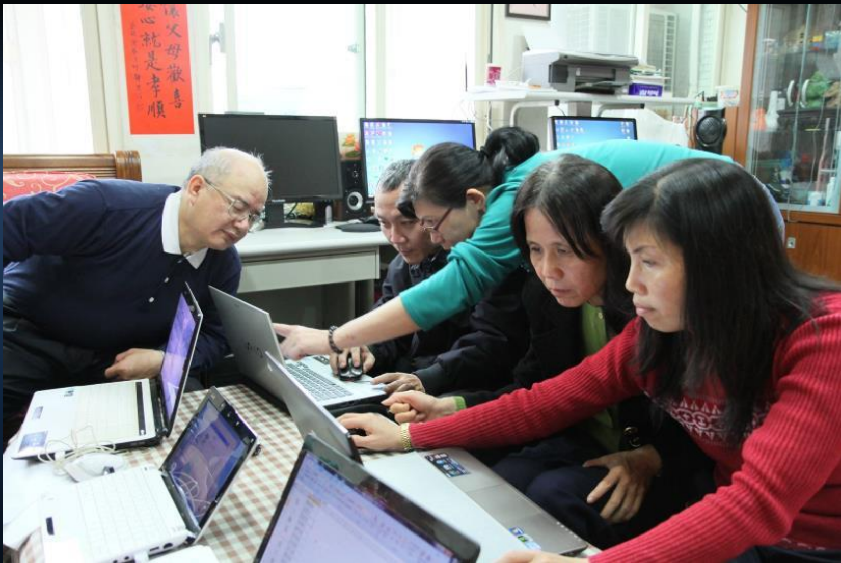
新北市人文真善美志工共修，志工學習撰寫圖說。 2013/03/11 地點：新北市板橋區忠孝路