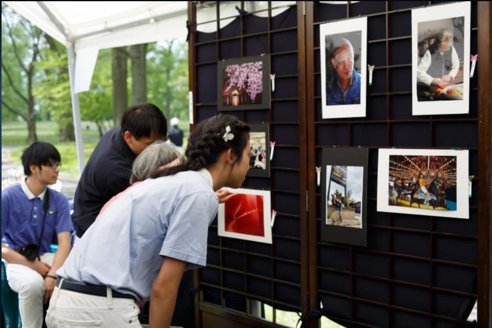
美國紐約分會佛誕日浴佛典禮，攝影比賽作品展，慈少仔細觀看參展照片。 2013/05/12 地點：美國紐約州法拉盛(Flushing)凱辛娜公園(Kissena Park)