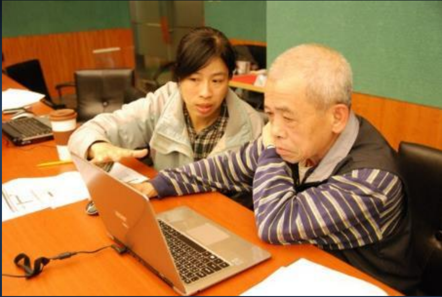
新店、文山區人文真善美志工研習圖像課程。 2013/03/13 地點：新北市新店區技嘉科技公司