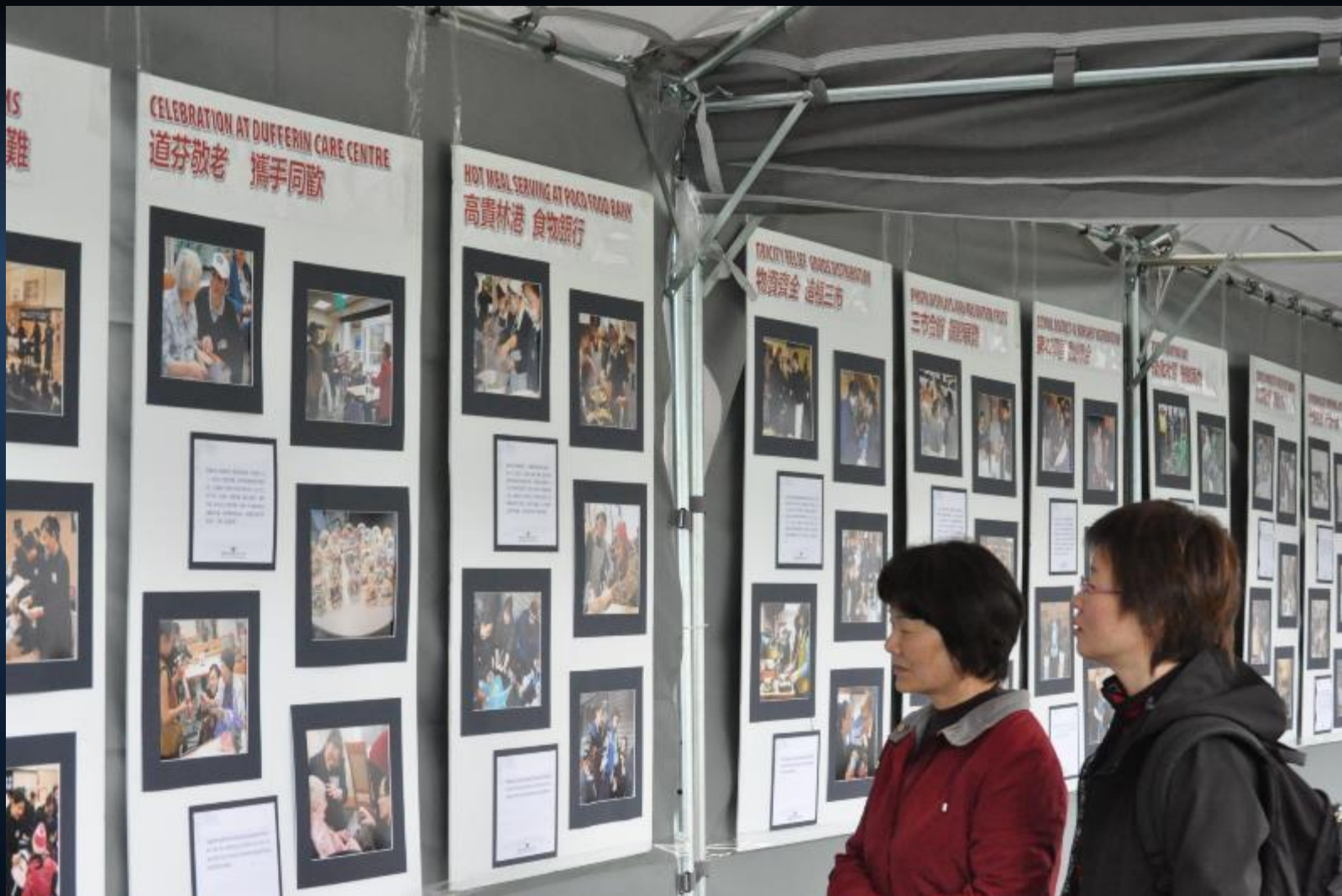
加拿大分會慈濟45周年慶系列活動，攝影展，民眾觀看慈濟攝影照片。 2011/05/08 地點：加拿大卑斯省(British Columbia)列治文市(Richmond)