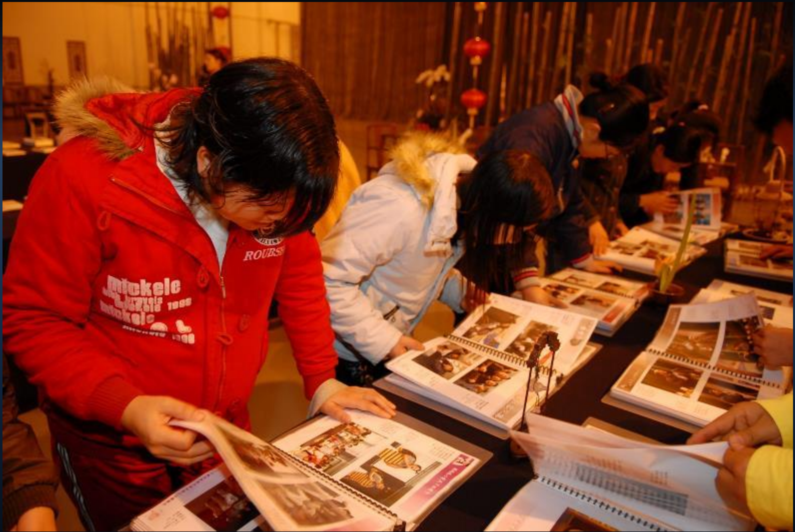
中國江蘇省昆山新春茶會，會眾用心翻閱2006年大上海地區活動檔案。 2007/03/24 地點：中國大陸江蘇省昆山市金亞企業園