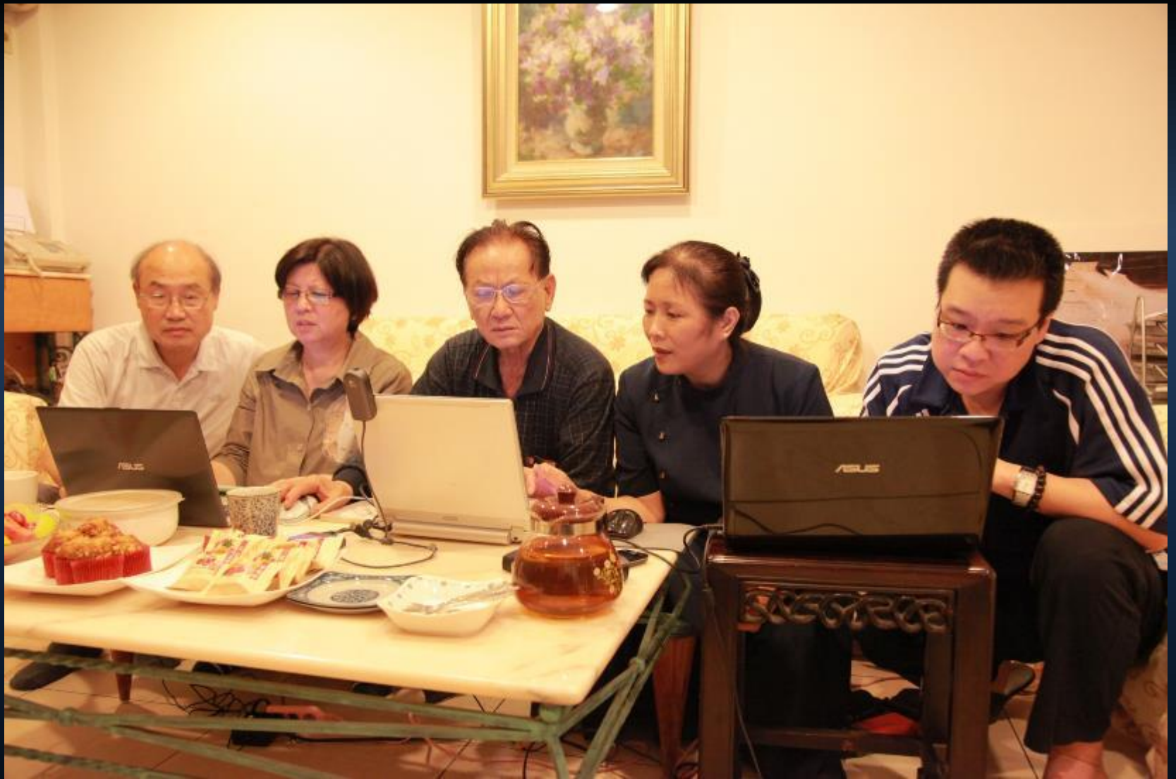
台北市大安區人文真善美志工共修，志工學習撰寫圖說，做好圖像典藏工作。 2013/04/30 地點：台北市大安區和平東路