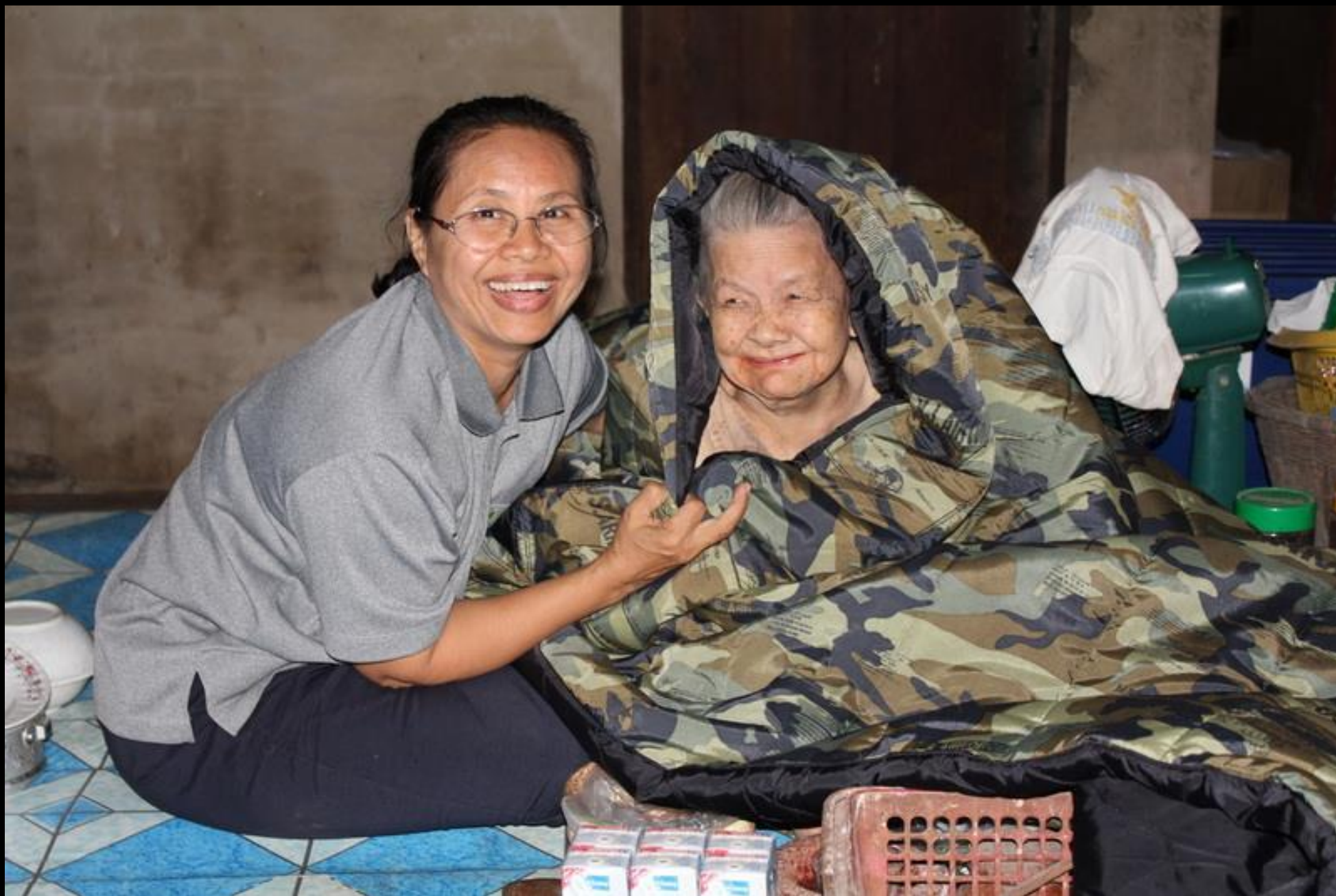
2010/07/24 泰國叻丕府挽才攬縣