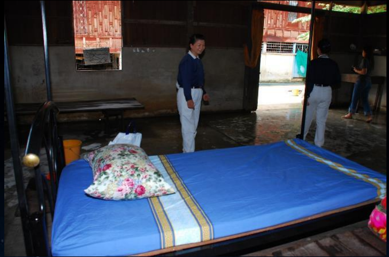
攝影者：桑瑞蓮 2010/07/24 泰國叻丕府挽才攬縣