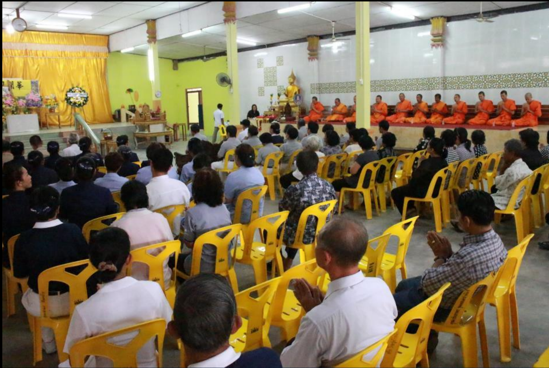
2015/04/27 泰國叻丕府挽才攬縣