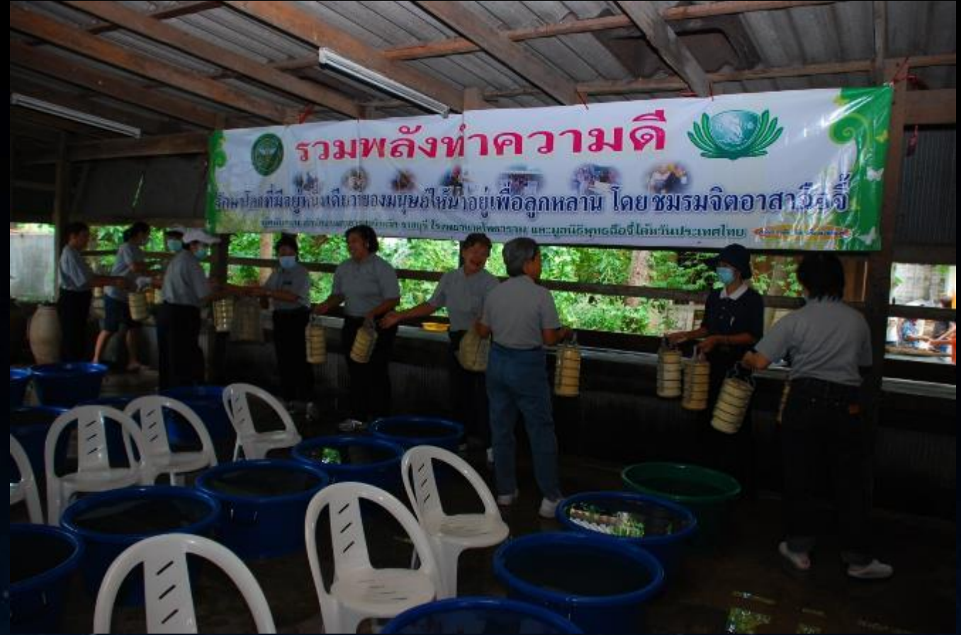
2010/07/24 泰國叻丕府挽才攬縣