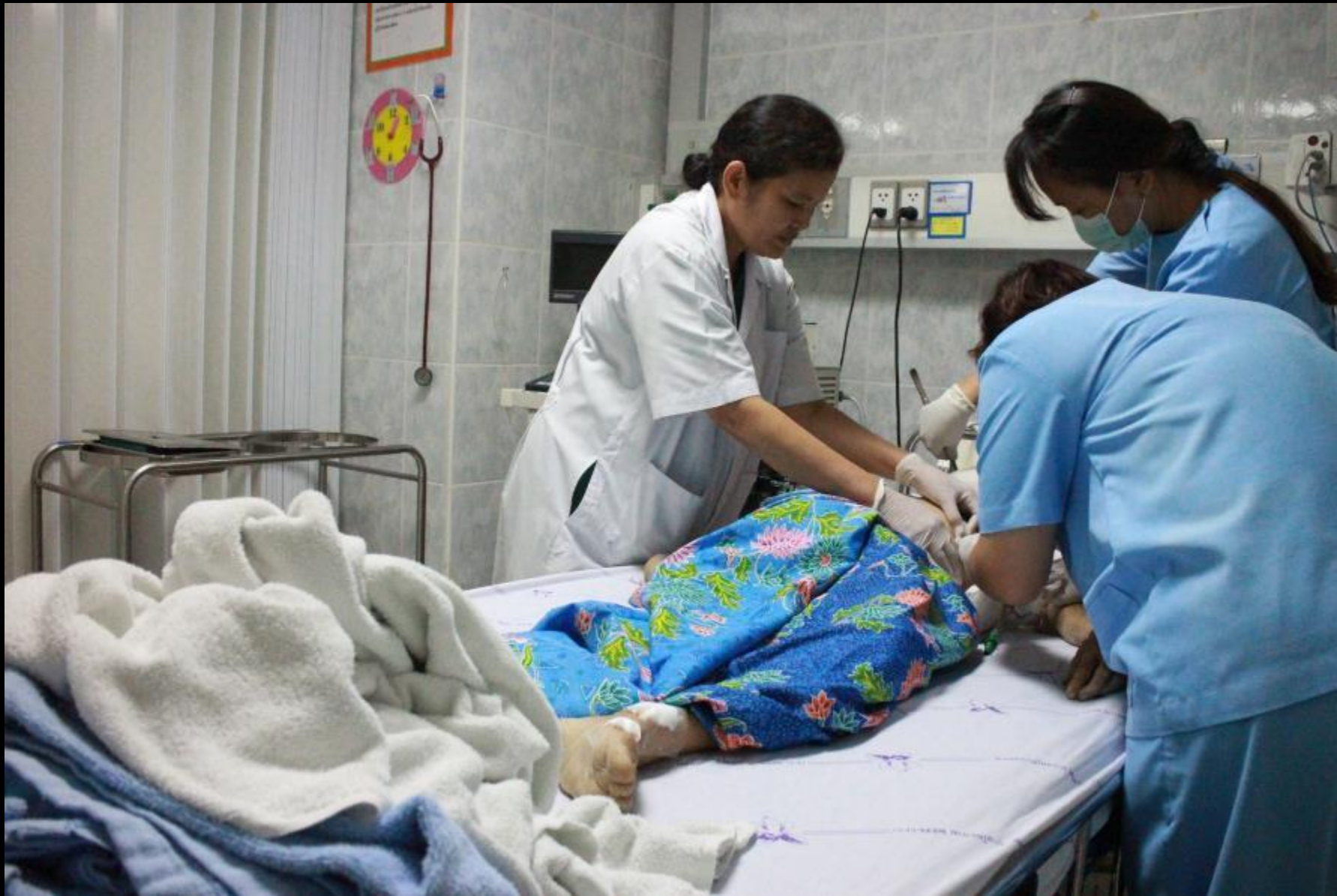
2015/04/25 泰國叻丕府挽才攬醫院

金花阿嬤往生當天， 慈濟委員為她洗澡， 並換上新衣，以及志 工在宋干節時送她的 沙龍。