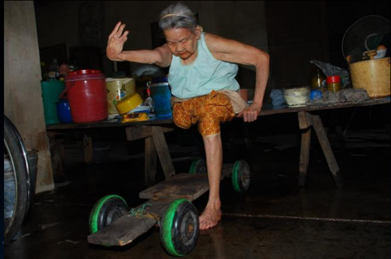
2010/07/24 泰國叻丕府挽才攬縣