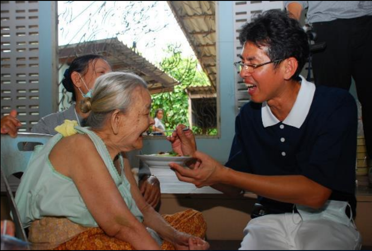
2010/07/24 泰國叻丕府挽才攬縣

獨善其身轉成啟動愛心 人醫會彎猜師兄（挽 才攬醫院前院長）把 阿嬤當成自己的親人 在呵護。