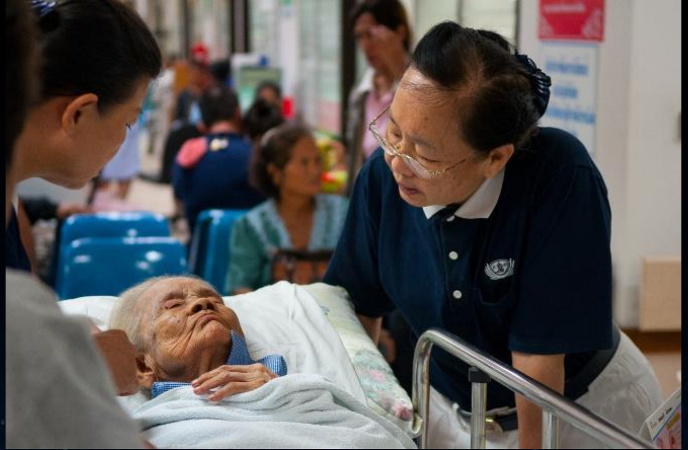
2013/07/118 泰國叻丕府挽才攬醫院