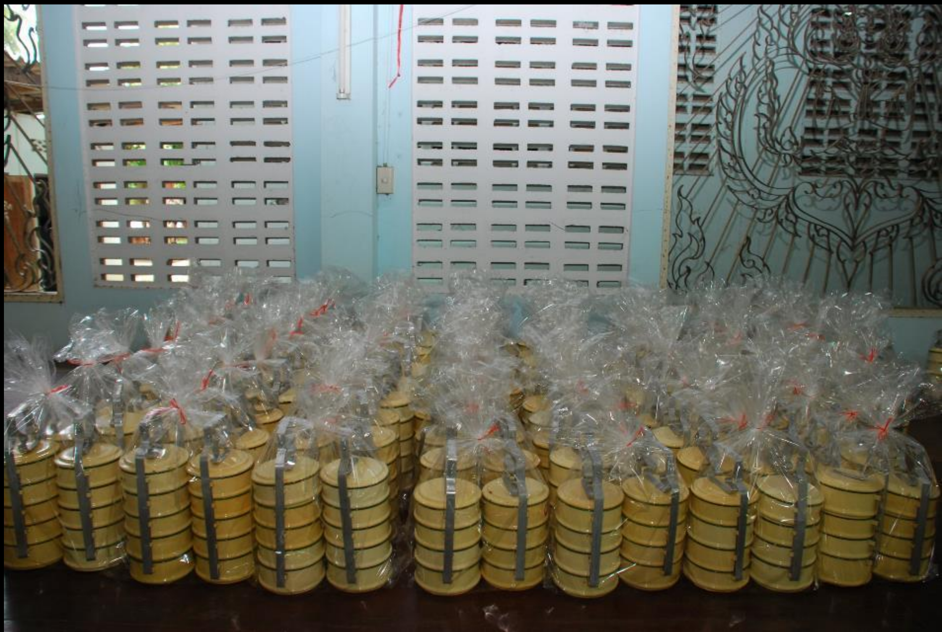
2010/07/24 泰國叻丕府挽才攬縣