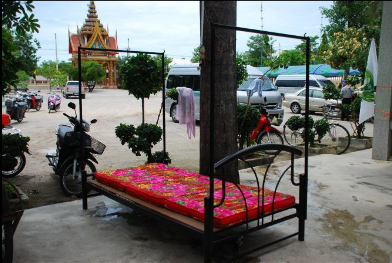
2010/07/24 泰國叻丕府挽才攬縣