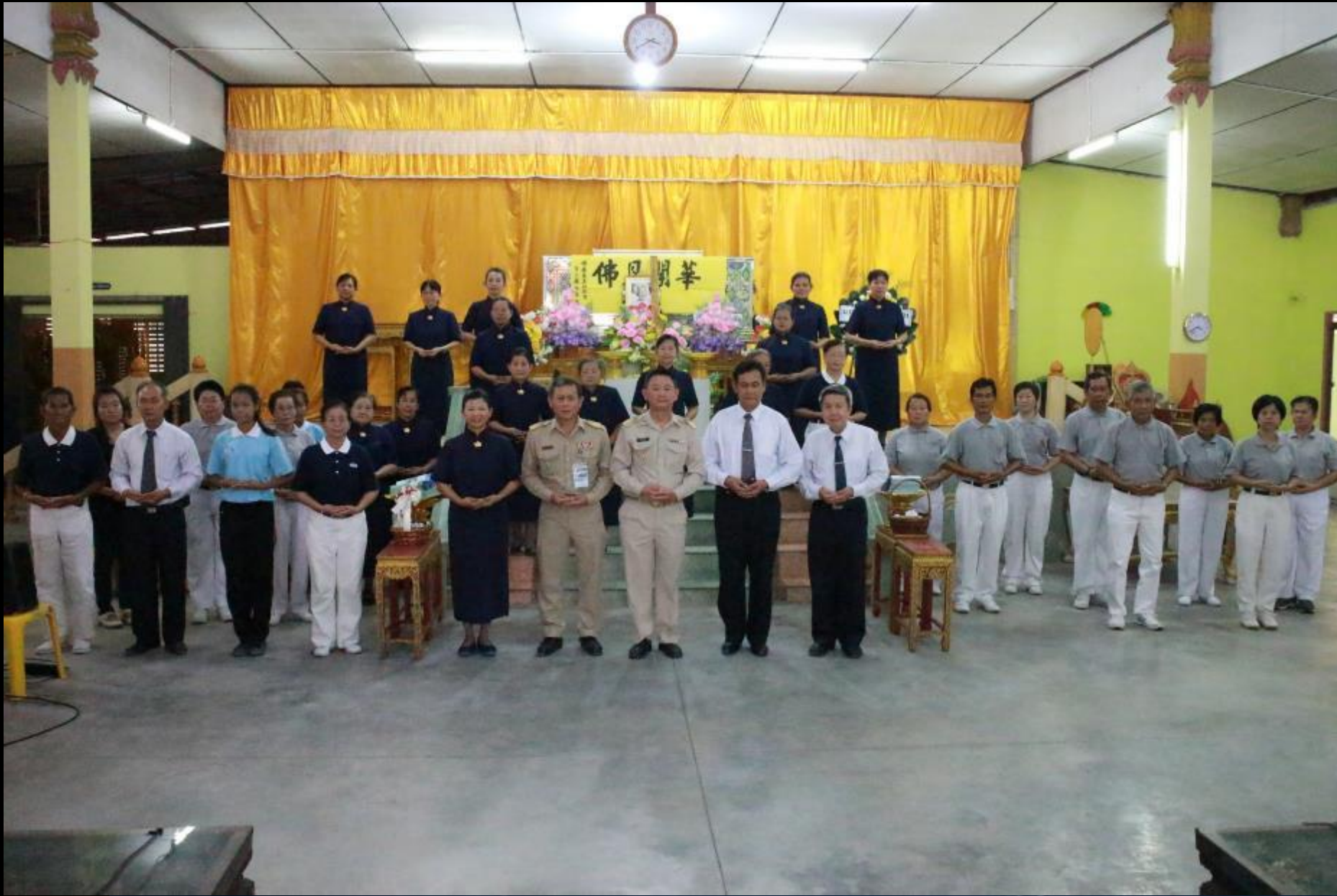
攝影者：康雅風 2015/04/27 泰國叻丕府挽才攬縣