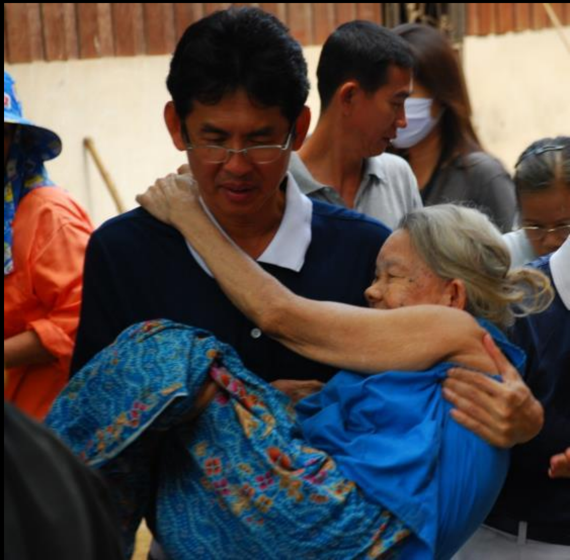
2010/07/24 泰國叻丕府挽才攬縣

彎猜師兄表示，未認 識慈濟之前，只是求 獨善其身而已，接觸 慈濟之後，才懂得走 入人群付出造福。