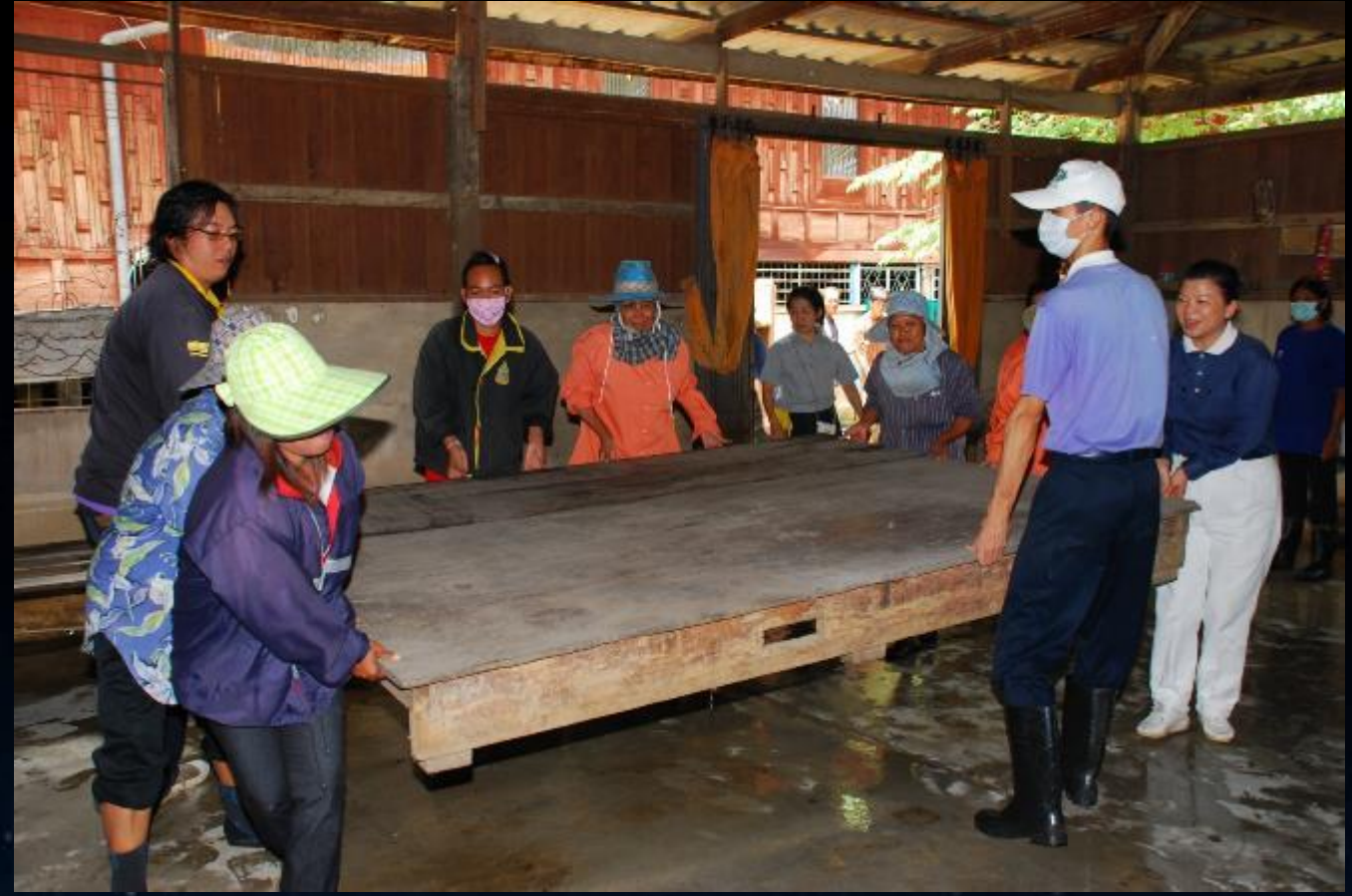
2010/07/24 泰國叻丕府挽才攬縣