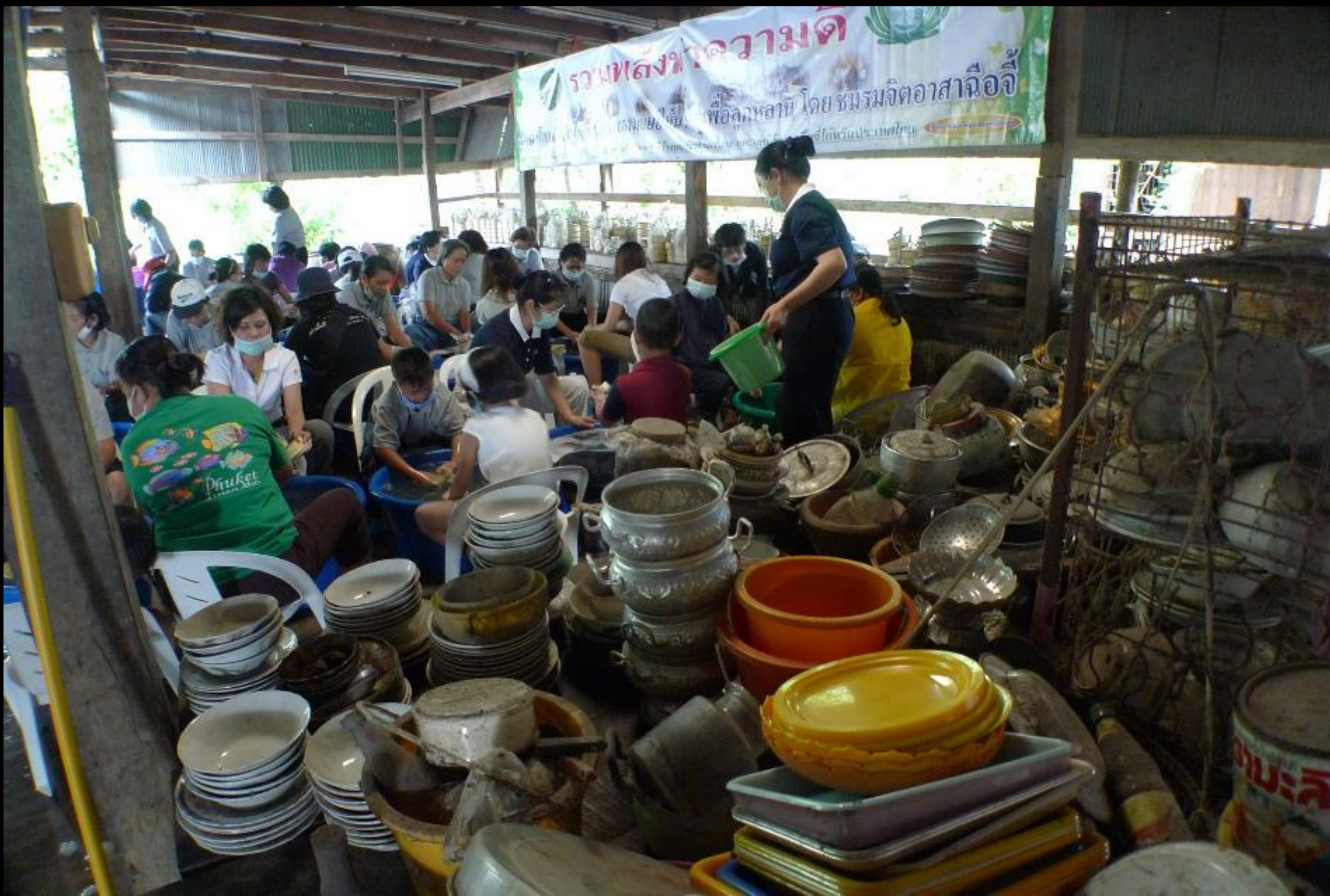
2010/07/24 泰國叻丕府挽才攬縣