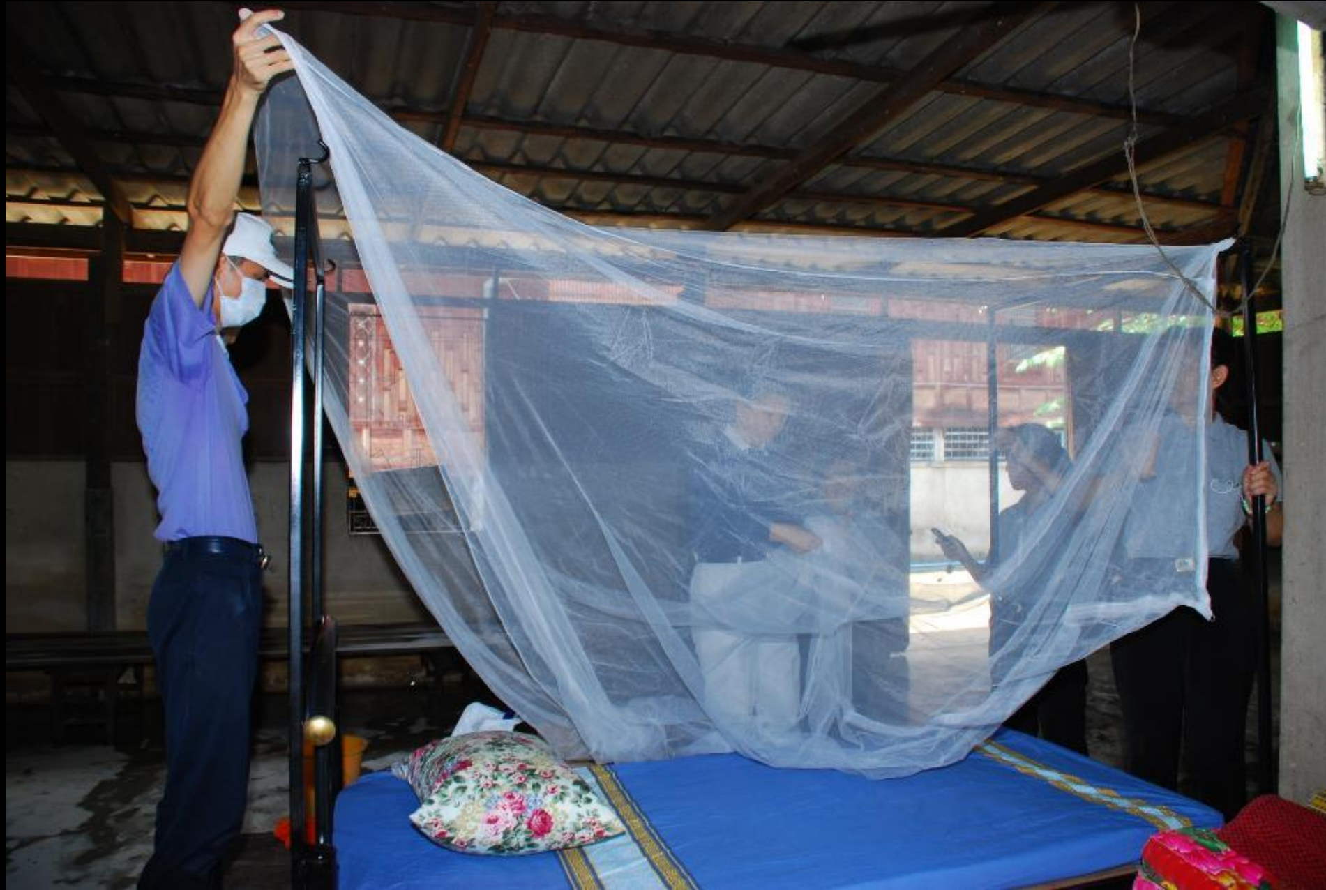
2010/07/24 泰國叻丕府挽才攬縣