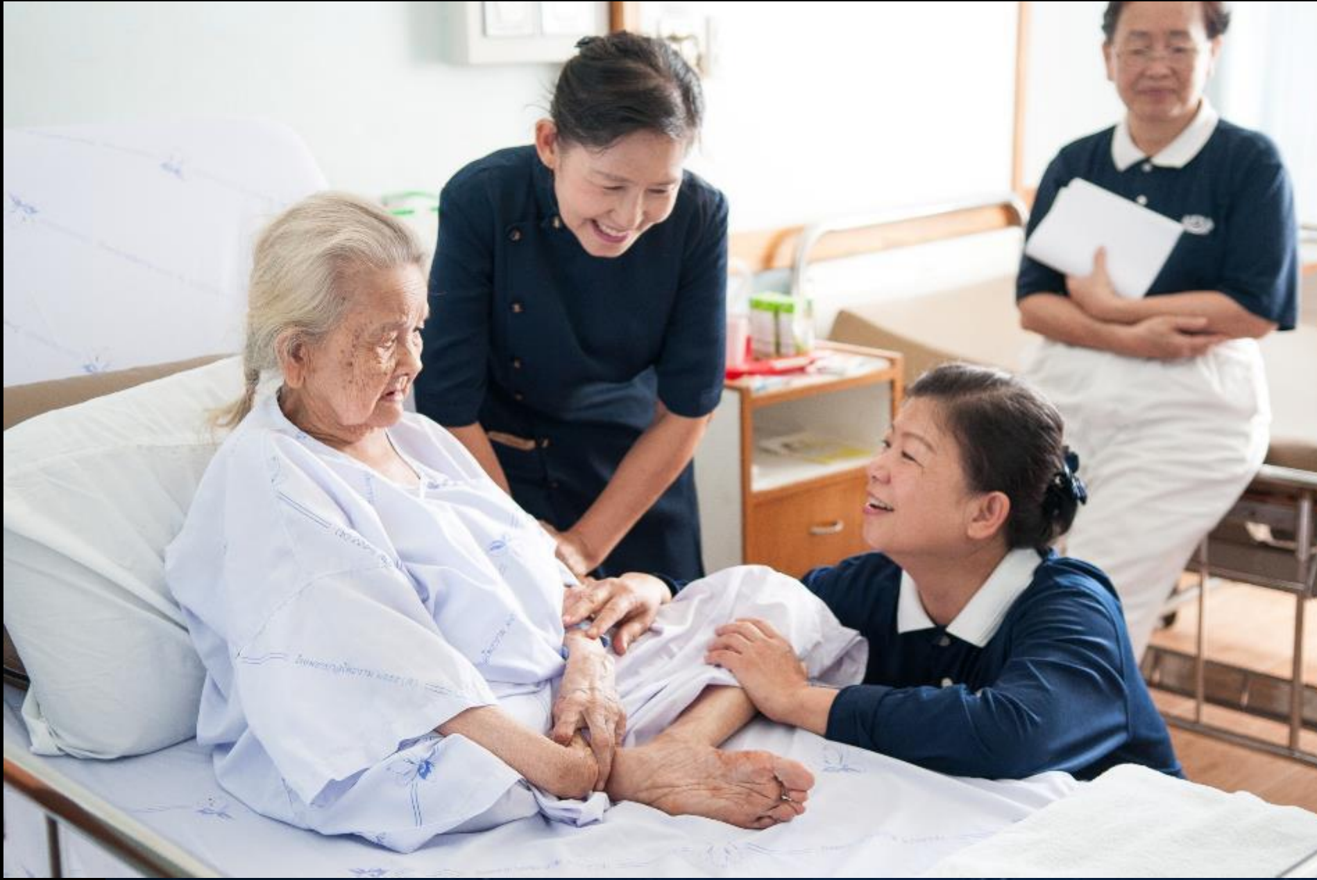
2013/07/18 泰國叻丕府挽才攬醫院