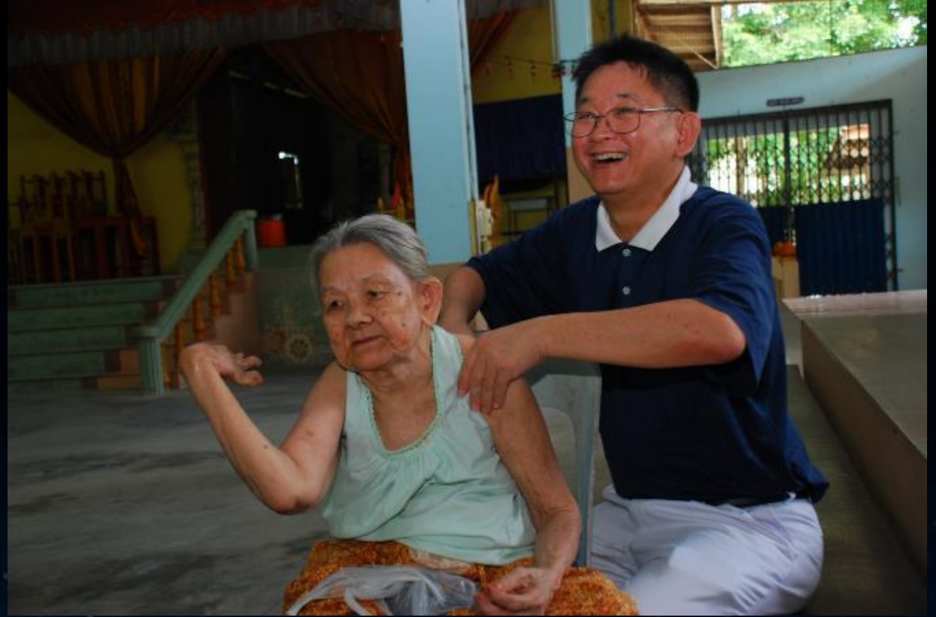
2010/07/24 泰國叻丕府挽才攬縣