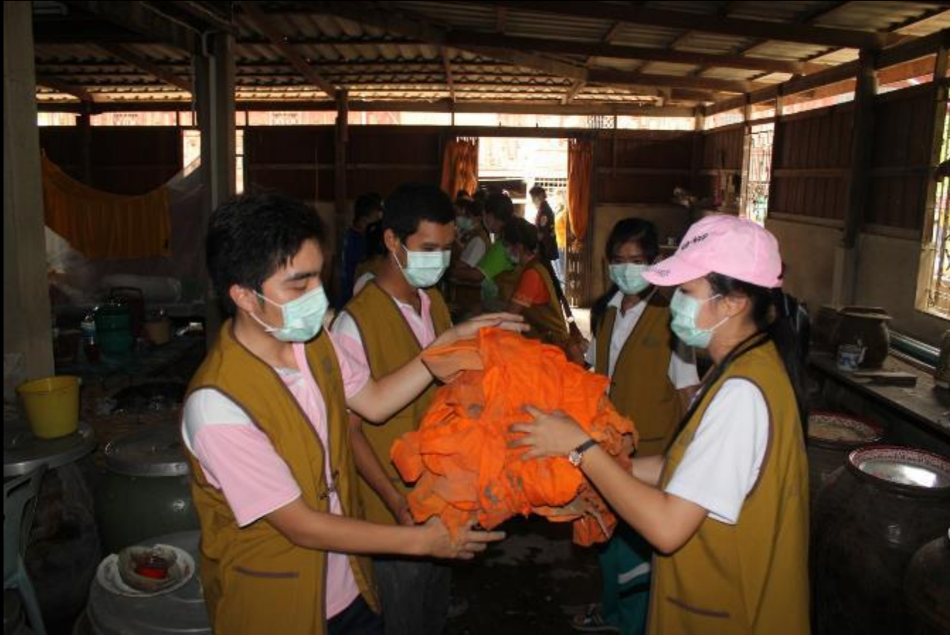
2011/06/19 泰國叻丕府挽才攬縣