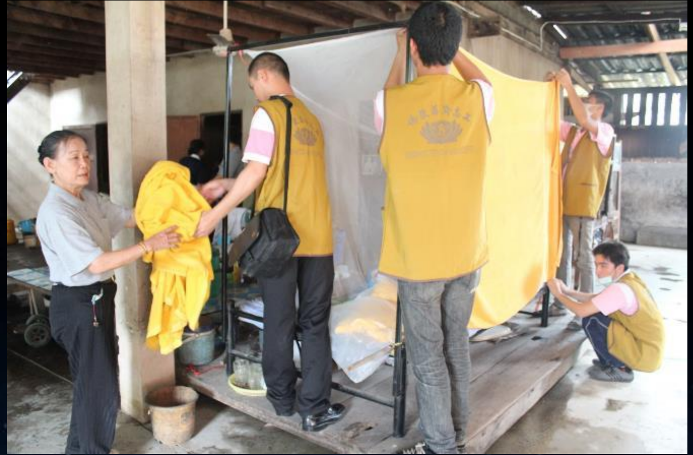
2011/06/19 泰國叻丕府挽才攬縣