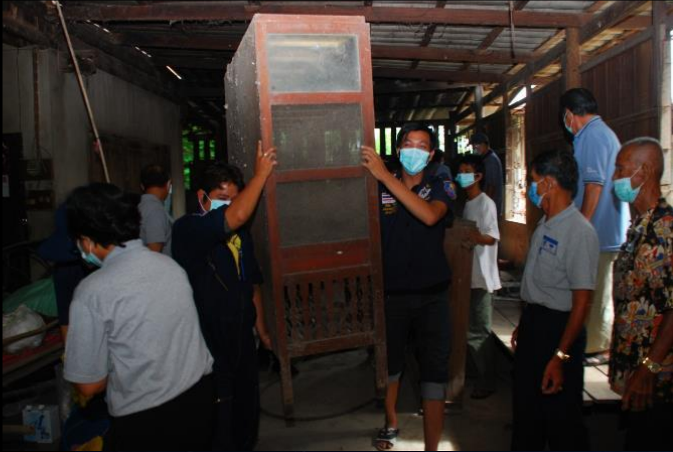
2010/07/24 泰國叻丕府挽才攬縣