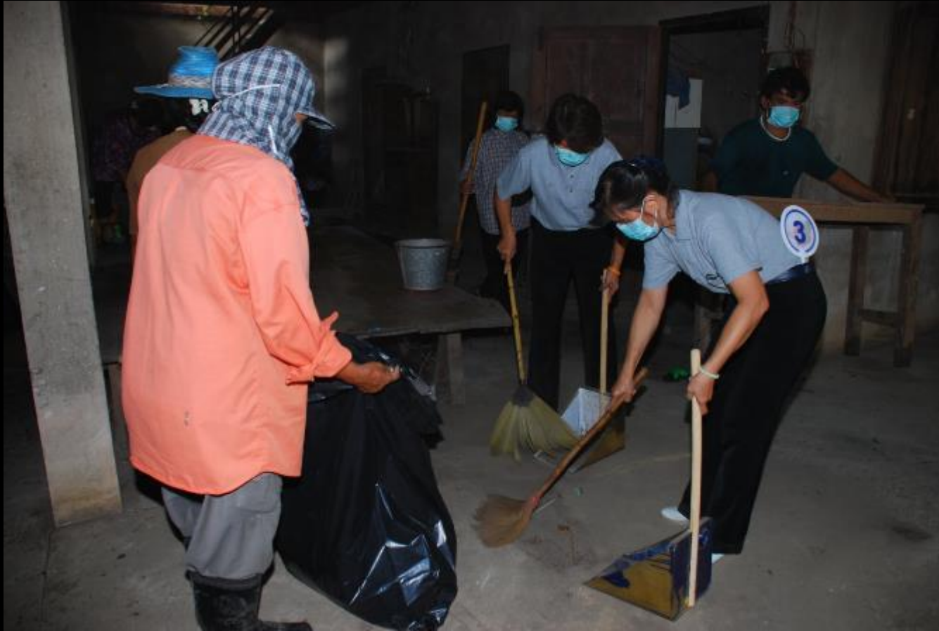
2010/07/24 泰國叻丕府挽才攬縣