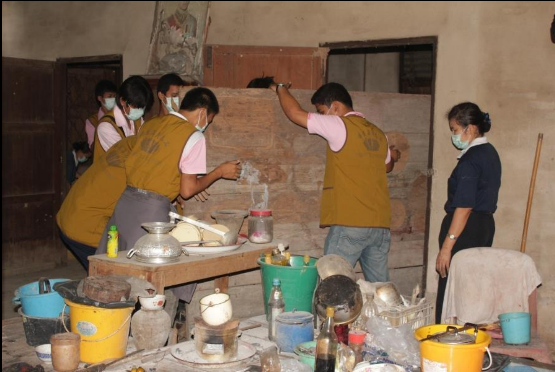
2011/06/19 泰國叻丕府挽才攬縣