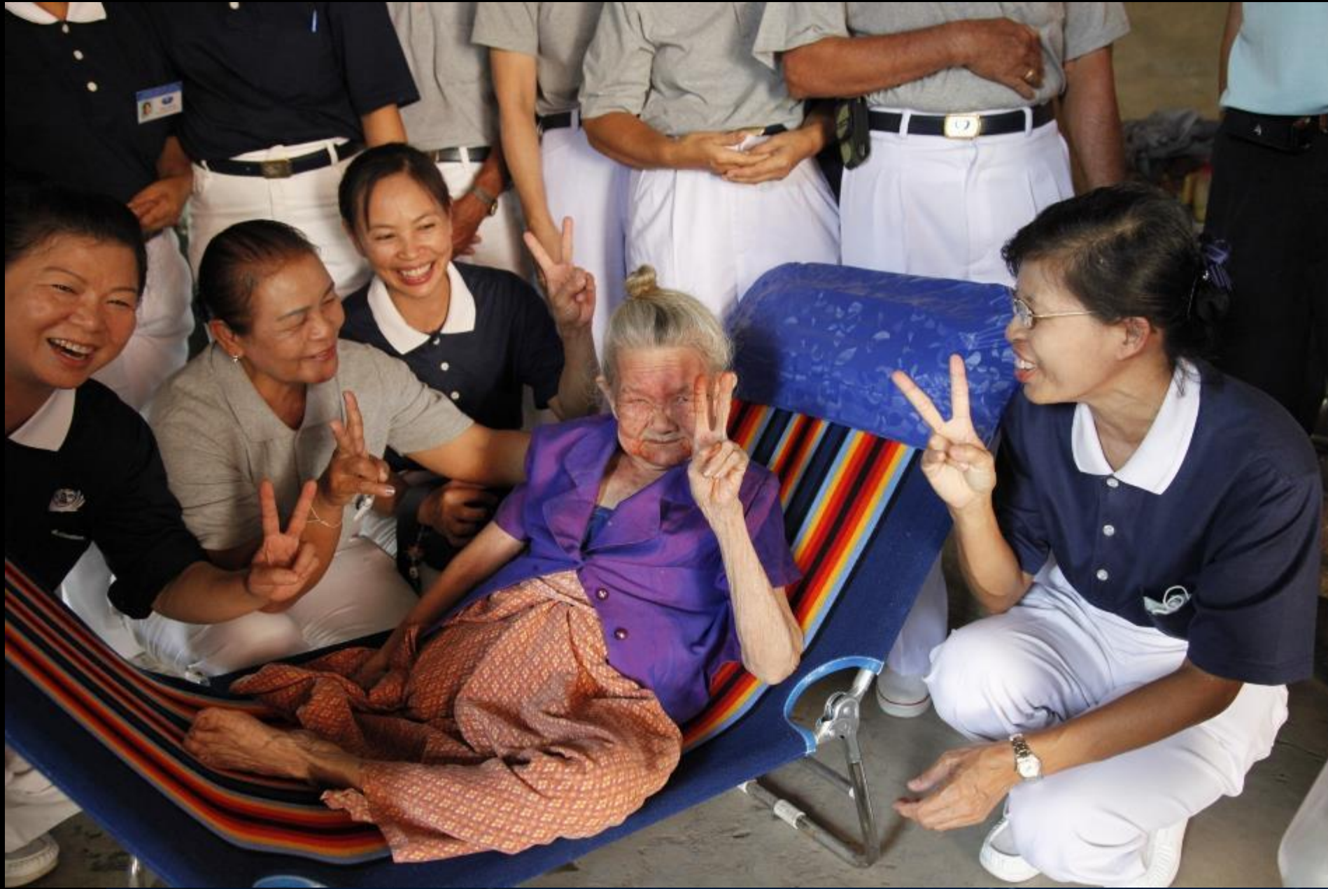
2010/11/10 泰國叻丕府挽才攬縣