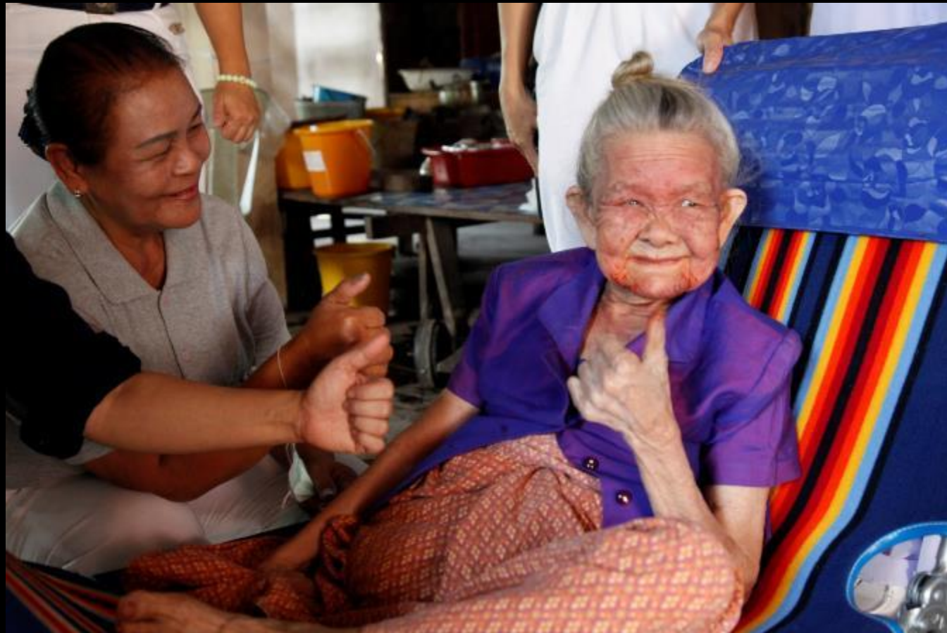
2010/11/10 泰國叻丕府挽才攬縣