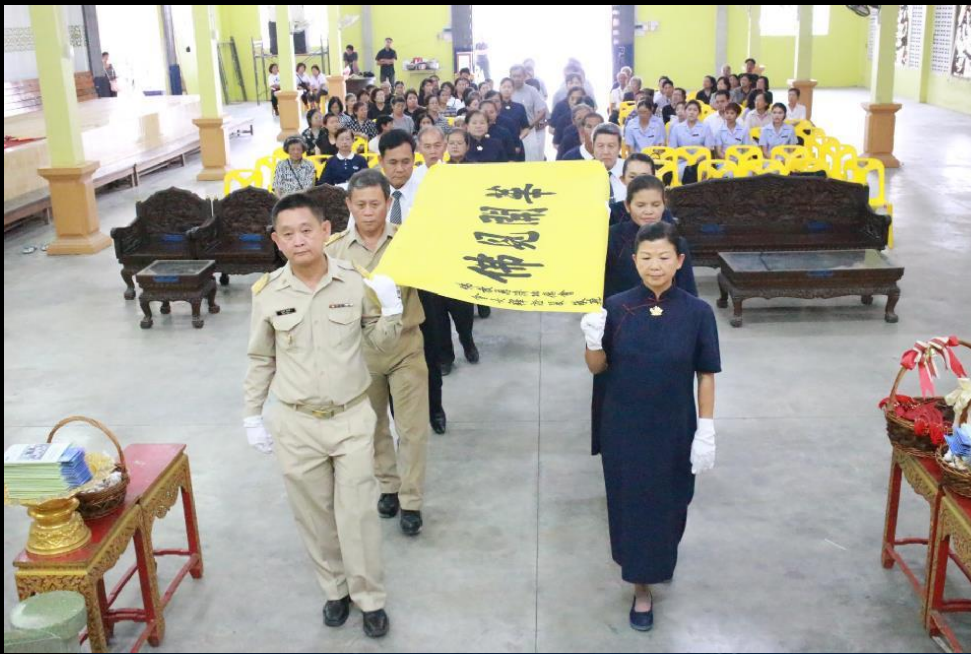
2015/04/27 泰國叻丕府挽才攬縣