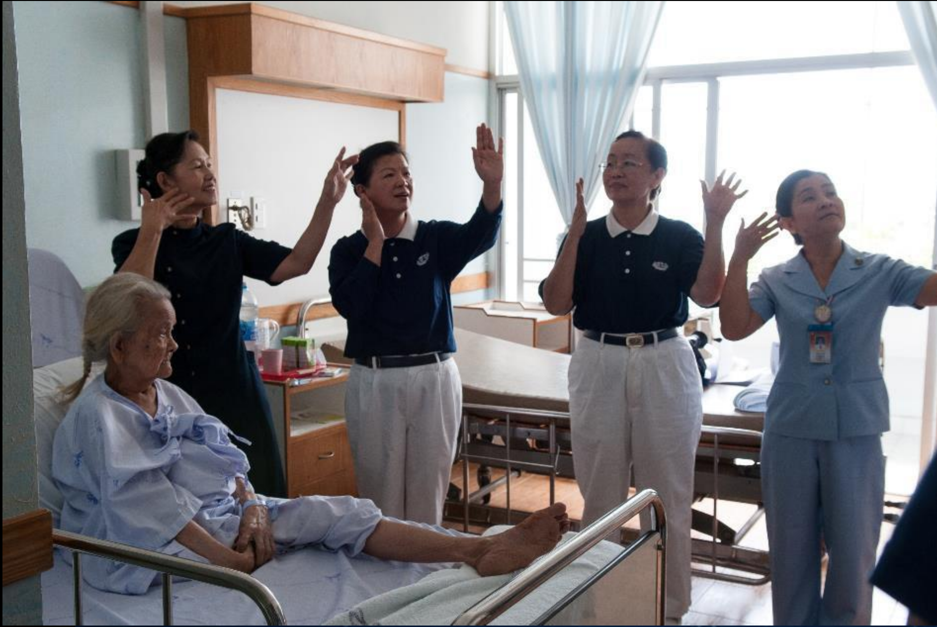
2013/07/118 泰國叻丕府挽才攬醫院