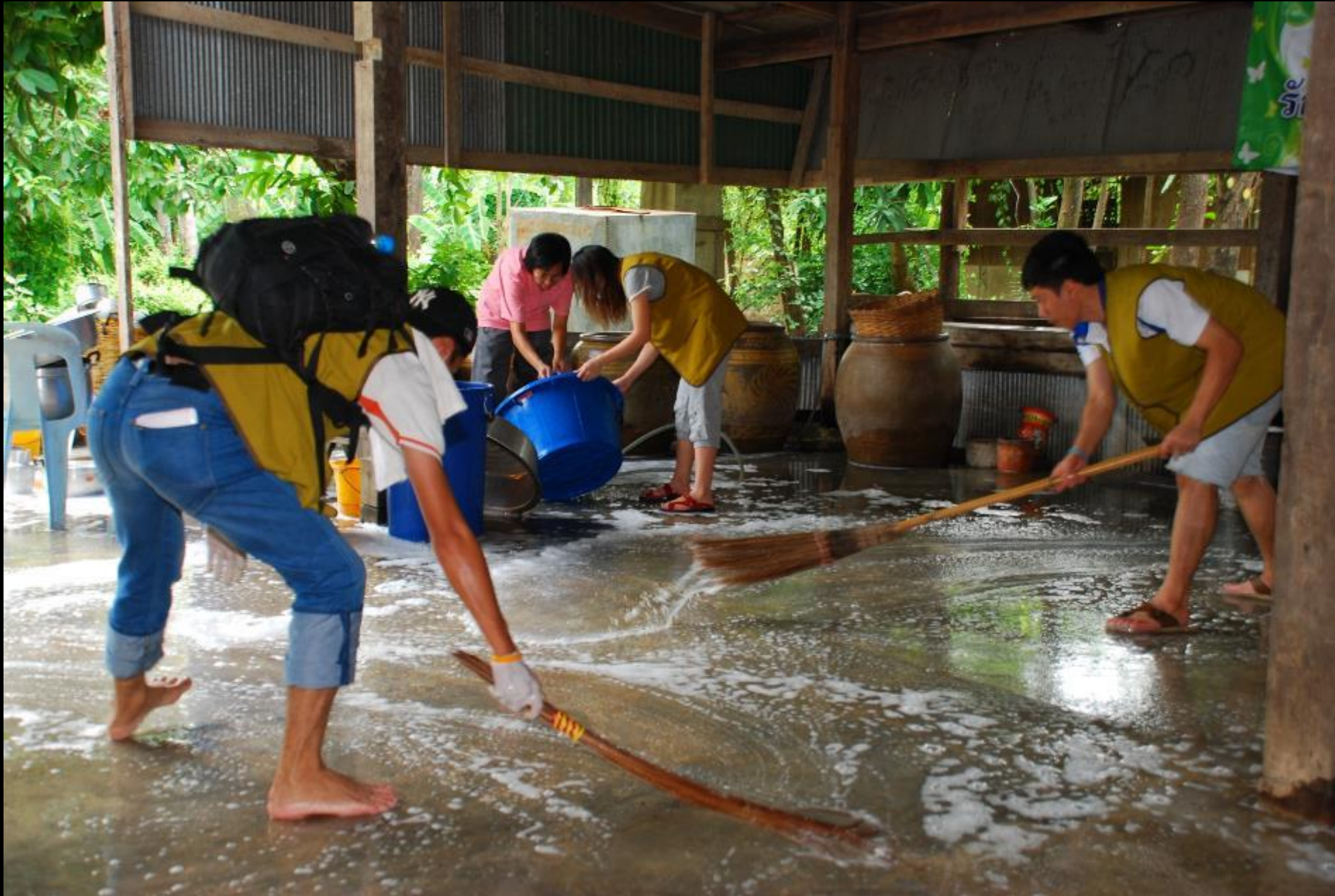
2010/07/24 泰國叻丕府挽才攬縣