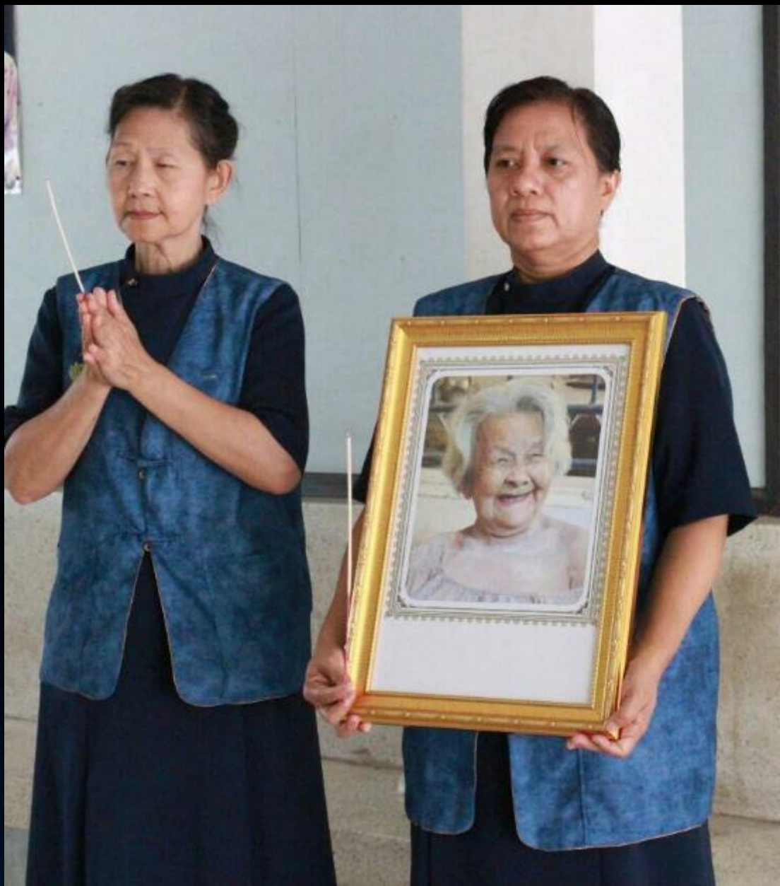
2015/04/25 泰國叻丕府挽才攬縣